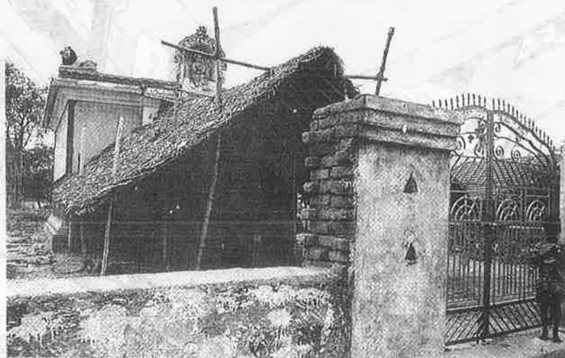
தாழ்த்தப்பட்டோரின் வழிபாட்டு உரிமை பறிப்பு: மேல்சாதி வெறியர்களுக்கு ஆதரவாக நிற்கும் தி.மு.க. அரசு உத்தரவுப்படி பூட்டிக் கிடக்கும் இளங்குண்ணி மாரியம்மன் கோயில்.