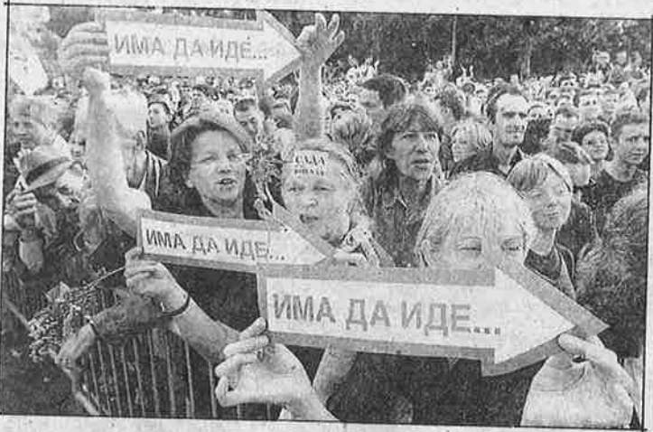
“மிலோசெவிச்சே, வெளியேறு!” எனும் முழக்க அட்டைகளுடன் எதிர்த்தரப்பினர் யூகோஸ்லாவிய நாடாளுமன்றத்தின் முன் நடத்திய ஆர்ப்பாட்டம்: அமெரிக்காவுக்கே அறுவடை.

யூகோஸ்லாவியாவில் அண்மையில் நடந்த அதிபர் தேர்தலில் இனவெறி பிடித்த பாசிச சர்வாதிகாரி மிலோசெவிச் தோல்வியடைந்து நாட்டை விட்டே தப்பியோடிவிட்டார். எதிர்க்கட்சி கூட்டணித் தலைவரான வோஜிஸ்லாவ் கோஸ்டுனிகா, மக்கள் திரளின் வெற்றி ஆரவார ஆர்ப்பாட்டங்களுடன் அதிபராகப் பதவியேற்றுள்ளார். மிலோசெவிச்சின் தோல்வியானது, “செர்பிய மக்களின் ஜனநாயகப் போராட்டங்களுக்குக் கிடைத்த வெற்றி; இனி யூகோஸ்லாவிய கூட்டமைப்பில் அமைதியும் சமாதானமும் சுதந்திரமும் பூத்துக் குலுங்கும் புதிய சகாப்தம் தொடங்கி விட்டது” என்று அமெரிக்கா மற்றும் மேற்கு ஏகாதிபத்தியங்கள் பெருந்த ஆரவாரம் செய்கின்றன.