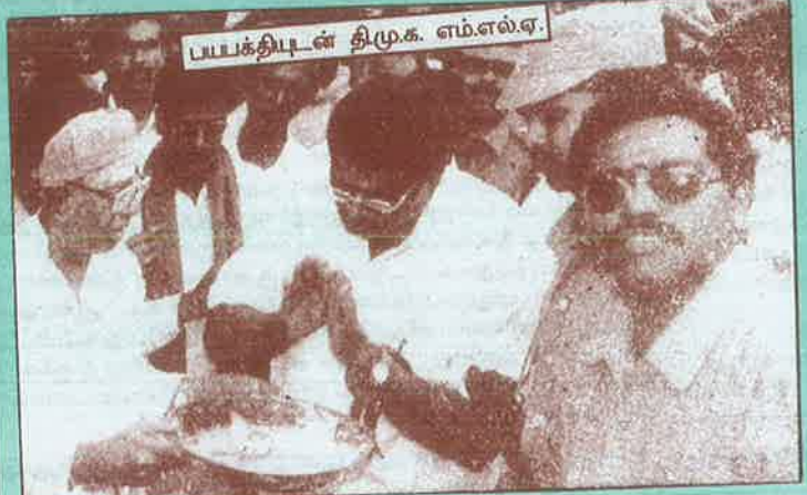
பயபத்தியுடன் தி.மு.க. எம்.எல்.ஏ.