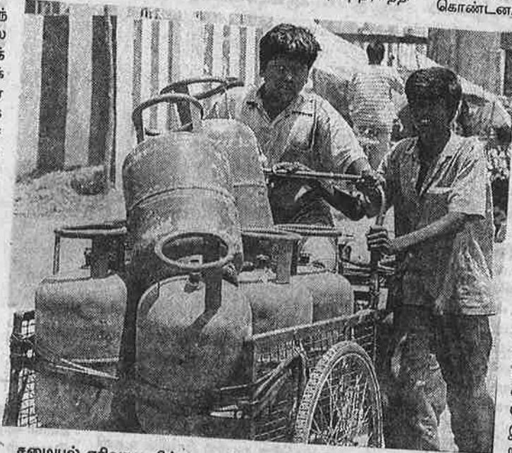
சமையல் எரிவாயு விற்பனையில் அரசிற்கு இலாபத்திற்கு மேல் இலாபம் கிடைப்பதால்தான், கேட்டவுடன் எரிவாயு இணைப்புக் கொடுக்கும் 'சேவை' துவங்கப்பட்டுள்ளது.

இத்தேசங்கடந்த எண்ணெய் தொழிற்கழகங்கள் தங்களின் முதலீட்டுக்குக் கணிசமான இலாபமடைய, ஒரு பீப்பாய் கச்சா எண்ணெய் பதினெட்டு டாலருக்கு விற்க வேண்டும் என எதிர்பார்க்கின்றன. ஆனால், 1997-ஆம் ஆண்டு தென் கிழக்காசிய நாடுகளில் ஏற்பட்ட பொருளாதாரச் சரிவு, கச்சா எண்ணெயின் விலையை இருபது டாலரில் இருந்து பத்து டாலராகச் சரித்துவிட்டது. இச்சரிவில் இருந்து மீள்வதற்கு உற்பத்தியைக் குறைக்கத் தொடங்கிய இந்நிறுவனங்கள், இந்த ஆண்டின் துவக்கத்தில், புதிதாக எண்ணெய் வயல்களைத் தோண்டவும், எண்ணெய் உற்பத்திக்கும் போடவிருந்த மூலதனத்தில் 20 சதவீதத்தைக் குறைத்துக் கொண்டன. இப்படி தேசங்கடந்த தொழிற்க