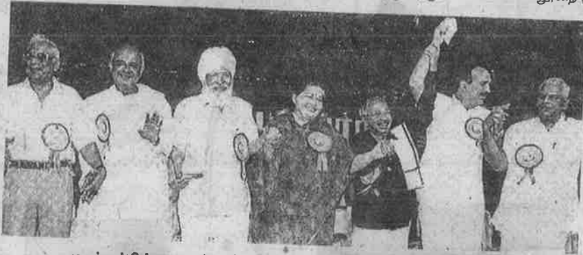
மதச்சார்பின்மை என்ற பெயரில் ஊழல் மகாராணி ஜெயாவோடும், காங்கிரசோடும் கூட்டணி கட்டிக் கொண்டிருக்கிறது சி.பி.எம்.

சீனப் பாதையின் படி, கிராமப் பிரதேசங்களில் பிரதானமாக விவசாயிகளைத் திரட்டி, கொரியலாப் போராட்டங்கள் மூலம் விடுதலைப் பிரதேசங்களை நிறுவி, விரிவுபடுத்தி அவை அவையாக முன்னேறி நகரங்களைச் சுற்றி வளைத்துக் கைப்பற்ற வேண்டும். ரஷ்யப்