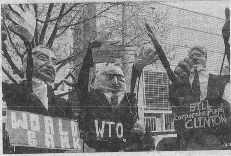
மக்களை மரணக் குழியில் தள்ளிவரும் உலக வங்கி, ஐ.எம்.எப்., அமெரிக்க அதிபர் பில் கிளிண்டன் ஆகிய கொடும்பூவிகளுடன் ஆர்ப்பாட்டம்.

செக்கோஸ்லாவினா என்ற போலி சோசலிச நாட்டை செக், ஸ்லோவாகியா என்று இரு நாடுகளாக உடைத்தது, ஏகாதிபத்தியம். இதை இரத்தம் சிந்தாத அமைதியான 'வெல்வெட் புரட்சி' என்று ஏகாதிபத்திய வாதிகள் சித்தரித்தனர். இப்புரட்சிக்குத் தலைமை தாங்கி செக் நாட்டின் அதிபராகிய ஹேவல், தன்னை மாபெரும் ஜனநாயக வாதியாகப் பீற்றிக் கொண்டார். ஆனால் கண்டன எதிர்ப்பைக் கூட சகித்துக் கொள்ள முடியாமல் இப்போராட்டத்தைக் கடுமையாக ஒடுக்கியுள்ளார். ஆர்ப்பாட்டக்காரர்கள் செக் நாட்டுக்குள் நுழைய விடாமல் செக் - ஜெர்மனி - ஆஸ்திரியா - போலந்து எல்லையிலேயே தடுத்து நிறுத்தப்பட்டனர். மேலும் பிரேக் நகரில் ஊர்வலங்களுக்குத் தடையுத்தரவு பிறப்பிக்கப்பட்டது. அதையும் மீறி ஆர்ப்பாட்டம் செய்தோர் மீது தண்ணீரைப் பீய்ச்சியடித்து கண்ணீர்ப்புகை குண்டும் வீசப்பட்டது.