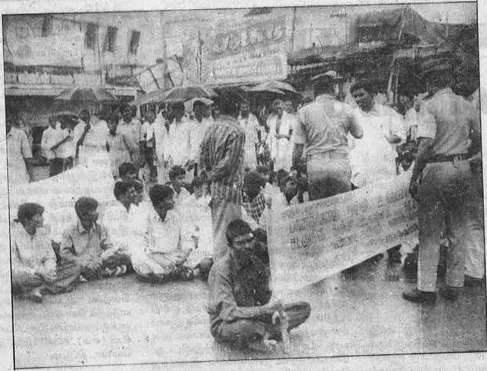
தி.மு.க. அரசால் பறிக்கப்பட்ட கல்விச் சலுகைகளை மீட்டெடுப்பதற்காகத் தமிழக மாணவர்கள் நடத்திய சாலை மறியல்.

போராட்டத்தில் ஈடுபட்டதற்காக முகிளி, தஞ்சை, சும்பகோணம், பொறையாற்பகுதிகளில் மொத்தமாக சுமார் 750 மாணவர்களை கைதாழினர். கைதுக்குப்பிறகும், பிரச்சனையைத் தீர்க்கும் வரை உண்ணாவிரதம் இருக்கப்போவதாக மைய போராட்டக்குழு அறிவித்தது. இதனால் பீதியடைந்த காவல்துறை அதிகாரிகளை வைத்து சமரச பேச்சுவார்த்தைக்கு மையப்போராட்டக்குழுவை ஓயாமல் அழைத்தது. 'கடனுதவி அளிப்பதால் பொருளாதார நெருக்கடி ஏற்படுகிறது' என்று மழுப்பலாக பதிலளித்த அதிகாரிகளிடம் "அரசு அதிகாரிகள் அரசியல்வாதிகளின் ஆடம்பர செலவாலும், அன்னிய பகாசர கம்பெனிகளுக்கு அளிக்கும் மானியத்தாலும் ஏற்படாத பொருளாதார நெருக்கடி மாணவர்களுக்கு அளிக்கும் கடனுதவியால் மட்டும் ஏற்படுகிறதா?" என எதிர்க்கேள்வி கேட்டு வாயை அடைத்தனர்.