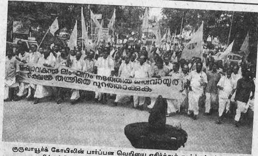
குருவாயூர்க் கோயிலின் பார்ப்பன வெறியை எதிர்த்துத் தாழ்த்தப்பட்டோர் - பிற்பட்டோர் அமைப்புகள் நடத்திய கண்டன உள்வலம்.

“நான் கடவுளை நம்புகிறேன்; விக்ரிகர வழிபாட்டையும் நம்புகிறேன்; சனாதன தர்மத்தையும் பார்ப்பன அதிகாரத்தையும் ஏற்கிறேன்; மார்க்சியத்தையும் ஏற்கிறேன்” என்று கூறிக் கொண்டு போலி கம்யூனிஸ்டுகள் கோயில் நிர்வாகக் குழுவில் கொலுவீற்றிருக்கிறார்கள், அவர்களோடு கூட்டணி கட்டிக் கொண்டு சமூக நீதி ஒட்டுக் கட்சிகளும் கோயில் நிர்வாகப் பதவிகளைப் பிடித்துள்ளன. கோயிலின் சடங்கு - விதிமுறைகளைத் தீர்மானிக்க பார்ப்பன தலைமைப் பூசாரிக் குத்தான் அதிகாரம் என்றால், சலுகைகளையும் சன்மானங்களையும் பொறுக்கித் தின்பதற்குத்தான் இந்தப் பதவிகளா?