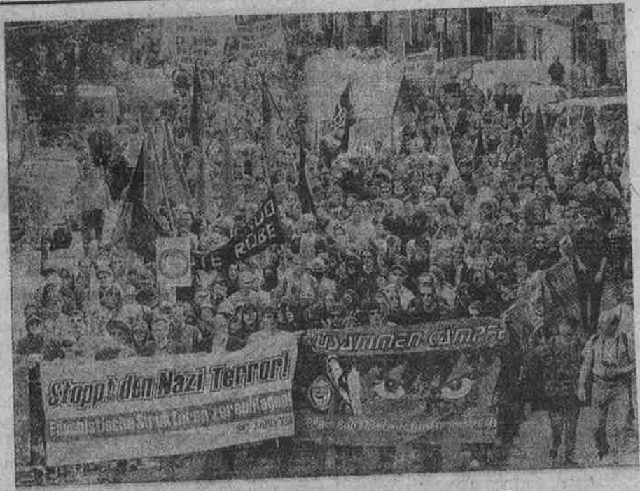
ஜெர்மனியின் டஸ்ஸல்டோரில் நவீன நாஜிகளுக்கு எதிராக நடந்த ஆர்ப்பாட்டம்.

எனவேதான் கடந்த பத்தாண்டுகளில் அங்கொன்றும் இங்கொன்றும் தாக்குதல்களை நடத்தி வந்த நவீன நாஜிகள் இப்போது அமைப்பு ரீதியாகத் திரண்டு இட்டமிட ஒருங்கிணைந்த முறையில் தாக்குதல்களை நடத்துகின்றனர். "சிட்டிசன்ஸ் பேண்டு" எனும் தனியார் வானொலி நிலையத்தின் மூலம் தமது குண்டர் படைக்கு நவீன நாஜிகள் தகவல்களையும் உத்தரவுகளையும் பிறப்பிக்கின்றனர். "இட்வர் ஓங்குக!" என்ற பெயரிலும் இன்னும் பல்வேறு சங்கேத மொழிகளிலும் தனிப்பே இணையத் தளமும் உருவாக்கிக் கொண்டு, உலகெங்குமுள்ள நவீன நாஜிக் குழுக்களுடன் வலைப் பின்னலை உருவாக்கிக் கொண்டுள்ளனர், முன்னாள் இரா