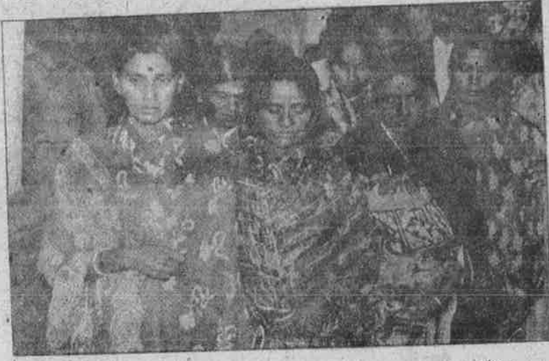
வீரப்பனின் கூட்டாளிகள் என்ற குற்றச்சாட்டு நிரூபணமாகும் முன்பே, நீதிமன்றத்தால் தண்டிக்கப்பட்டு வரும் அப்பாவி மலைவாழ் மக்கள்.

"தடா" சட்டம் இவர்களுக்குப் பொருந்தும் எனக் கொண்டாலும், "தடா" வழக்குகள் தொடர்பாக 1938-ஆம் ஆண்டு உச்சநீதி மன்றம் அளித்த தீர்ப்பின்படியே இவர்களைப் பிணையில் விடுவதற்கு எவ்விதத் தடையும் கிடையாது. அந்தத் தீர்ப்பில், உச்சநீதி மன்றம் தடா கைதிகளை மூன்றாகப் பிரித்து, குற்றத்தில் மிகச் சிறிய பங்காற்றியவர்கள் மூன்று வருடம் சிறையில் இருந்தால், முக்கியப் பங்காற்றியவர்கள் ஐந்து வருடம் சிறையில் இருந்தால் அவர்களைப் பிணையில் விடலாம் என்று