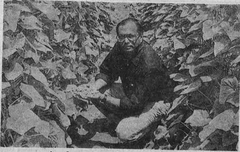
ஏற்றுமதி சார்ந்த நவீன விவசாயக் கொள்கையால் பலனடைந்து வரும் நவீன 'விவசாயி'.

உங்கள் நிலங்களைப் பார்வையிட்டு ஒப்புதல் அளித்த பிறகு, மேம்பாட்டு வேலைகள் தொடங்கும். அதாவது, மண் பரிசோதனை செய்து அதன் சத்துக்களுக்கு ஏற்ப பழமரங்கள், மலர் வகைக் கன்றுகள் - விதைகளை நாங்களே தருவோம். நிலத்தைச் சமப்படுத்தி, போர் போட்டு, சொட்டு நீர்ப்பாசன வசதியும் செய்து தருவோம். இதற்காக ரூ. 1 லட்சம் முதல் ரூ. 2 கோடி வரை கடனாகப் பெறலாம்.