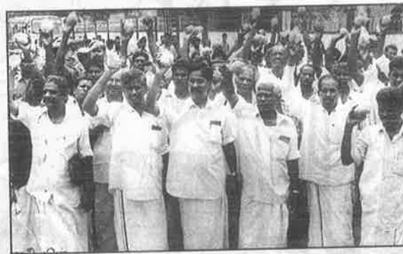
தாராளமயத்தால் போண்டியாகிப் போனக் கொப்பரைத் தேங்காய் விவசாயிகளின் போராட்டம்