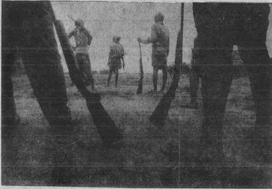
ஆயுதங்களோடு ஆட்கள் நிற்பதைப் பார்த்து இது ஏதோ பீகார் கிராமப்புறம் என்று எண்ணிவிடாதீர்கள்; இது, மேற்கு வங்கத்திலுள்ள கேஷ்பூர் கிராமம். மேற்கு வங்கத்தில் அரசியல் வன்முறைதான் “மார்க்சிஸ்டு”களின் வெற்றி-தோல்வியைத் தீர்மானிக்கிறது.

பன்சுரா தோல்விக்கு, சி.பி.(எம்) தலைமை என்னதான் விளக்கமளித்துக் கொண்டிருந்தாலும் எல்லாவற்றுக்கும் பதிலடியாக, கல்கத்தா மாநகரத் தேர்தல் முடிவுகள் வந்தன. 20 ஆண்டுகளுக்கு மேலாக சி.பி.(எம்) அதிகாரம் செலுத்தி வந்த கல்கத்தா மாநகர ஆட்சியை திரிணாமுல்