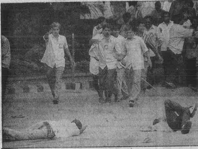
மின் கட்டண உயர்வுக்கு எதிராக ஐதராபாத்தில் நடந்த பேரணியை ஒடுக்க போலீசு நடத்திய துப்பாக்கிச் சூட்டில் காயமடைந்தவர்கள்.

இப்படி மந்திரிகள், அதிகாரிகளின் பொது நிகழ்ச்சிகள் குலைக்கப்பட்டு அவர்கள் நடமாடவே முடியாதவாறு முடக்கப்படுவது தொடரவே, போராட்டக்காரர்