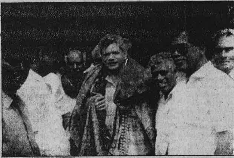
கோவை விமான நிலையத்தில், 'மார்க்சிஸ்டு' கட்சியின் அரசியல் தலைமைக்குழு உறுப்பினர் சீதாராம் யெச்சூரி, சந்தன மாலை, சால்வை அணிவித்து வரவேற்கப் படுகிறார். இது, மலர்க் கிரீடம், கட்-அவுட் கலாச்சாரத்தின் தொடக்கமா?

வேறொரு காரணத்தை முன்வைத்து, சி.பி.(எம்), கட்சியின் அங்கீகாரத்தையே ஏன் இரத்து செய்யக் கூடாது என்று கேட்டு வம்பு செய்கின்றன, வழக்கு மன்றமும், தேர்தல் ஆணையமும், அரசியல் கட்சிகள் பொதுக் கடையடைப்புகள் நடத்துவது சட்டவிரோதமானதென்று கேரள உயர்நீதி மன்றம் தீர்ப்பளித்தது. ஏற்கனவே, பொது கடையடைப்பு நடத்தியதற்காக சி.பி.(எம்) கட்சியின் அங்கீகாரத்தை ரத்து செய்யும் முயற்சியில் வழக்கு மன்றமும் தேர்தல் ஆணையமும் இறங்கியுள்ளன. பொதுக் கடையடைப்புகள் சட்டவிரோதமானவைதாம் என்று உச்சநீதி மன்றமும் தீர்ப்பளித்து விட்டது. சட்டவாதத்தில் முழுகிப்போன சி.பி.(எம்) இந்தத் தீர்ப்புக்கு எதிராக எதுவும் செய்வதறிபாது திகைத்து நிற்கிறது.