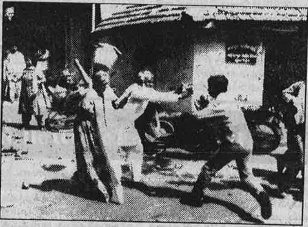
நவபுரா போலீசு நிலையம் அருகிலேயே வயதான முசலிம் தம்பதியினரைத் திரிசூலத்தால் தாக்கும் இந்து மதவெறியர்கள்.

தலைநகரில் உள்ள 10 ஆரம்பப் பள்ளி நிலத்தைக் கைப்பற்ற வீட்டுமனை மாஃபியாக்கள் போட்டி போடுவதும், பள்ளிகள் விற்பனையில் பொது ஏலமுறை அறிவிக்கப்படாமல் அமைச்சரவை மட்டத்திலேயே முடிவு செய்து இலஞ்ச - ஊழல் பழுத்து நாறுவதும் இதையே திருபிக்கின்றன. குறிப்பாக, ராஜ்கோட்டிலுள்ள காந்தி படித்த ஆரம்ப பள்ளியின் மைதான நிலத்தைக் கைப்பற்றி அடுக்குமாடி குடியிருப்பு கட்ட வீட்டுமனை மாஃபியாக்கள் போட்டி போடுவதை அப்பள்ளி ஆசிரியர்களே அம்பலப்படுத்தியுள்ளனர்.