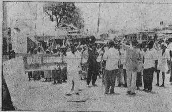
பேரூராட்சி முன் மனித மலத்தைக் கொட்டி பு.மா.இ.மு. நடத்திய போராட்டம்.

— புரட்சிகர - மாணவர் இளைஞர் முன்னணி, ஈரோடு.