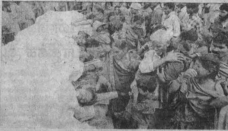
லஸ்கர் - இ - தோய்பா என்ற முகலீம் தீவிரவாதக் குழுவால் சுட்டுக் கொல்லப்பட்ட பீகார்த தொழிலாளர்களின் சடலங்கள்.

ஆண்டு தோறும் ஆகஸ்டு மாதம் வட நாட்டு பக்தர்கள் அமர்ந்த சாரத குகைக் கோவிலுக்குப் போய் உறைபனி விங்கத்தைத் தரிசிப்பதைத் தனது மத வெறி நோக்கத்துக்கு ஆர்.எஸ்.எஸ். பாசிச ரிவாரங்கள் பயன்