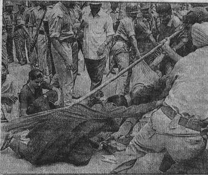
துப்பாக்கிச் சூட்டைக் கண்டித்துப் போராடும் பெண்களை மிருகத்தனமாகத் தாக்கும் ஆந்திர போலீசு.

இந்தக் கொள்கை உ.பி., ஒரிசா, இப்போது ஆந்திரா எனப் படிப்படியாக அமலாக்கப்படுகிறது. பல மாநிலங்களில் விவசாயிகளுக்கு வழங்கப்படும் மானிய விலை அல்லது இலவச மின்சாரம் இரத்து செய்யப்படும். பெருந்தொழில் நிறுவனங்கள் தவிர, விவசாயிகள், சிறு தொழில் நிறுவனங்கள், வீட்டுப் பயனீட்டாளர்கள் போன்றவர்களுக்கு 100, 200 சதவீதமென்று கட்டணத்தை உயர்த்த வேண்டும் என்று புதிய மின் திட்டங்களுக்குக் கடனாக நிதி அளிக்கும் ஏகாதிபத்திய நிறுவனங்கள் நிர்வகிக்கின்றன. இதை வெளிப்படையாகவே சொல்லும் சந்திரபாபு நாயுடு, புதிய பொருளாதாரக் கொள்கை, சீர்திருத்தத்தை ஆதரிக்கும் காங்கிரசு, மின் கட்டண உயர்வை எதிர்ப்பது எந்த வகையில் நியாயமானது என்று கேள்வி எழுப்புகிறார்.