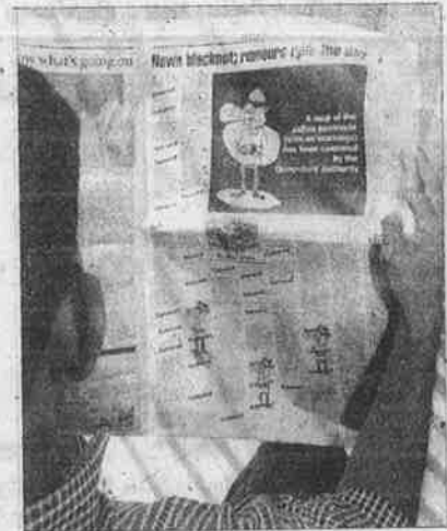
பத்திரிகை தணிக்கையால், வதந்திகளே செய்திகளாகத் தரப்படுவதாகக் கூறும் சிறிலங்கா பத்திரிகை.

ஈழப் பிரச்சினைக்கு அரசியல் தீர்வு காணப் போவதாக வாக்குறுதி கொடுத்து முதல் தடவை சந்திரிகா ஆட்சியைப் பிடித்தார். ஆனால், சிங்கள இனவெறி காரணமாக ஈழத்தமிழர்களுக்கு ஏற்படைய திட்டம் எதுவும் முன் வைக்கத் தவறினார். பின்னர் இராணுவத் தீர்வு காண விழைந்து முழு அளவிலான போர் துவங்கிய யாழ்குடா நாட்டைக் கைப்பற்றினார். அதைத் தொடர்ந்து சிங்கள இனவெறியர் - அரசி