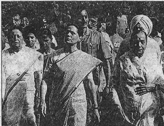
மானியங்களைத் திரும்பவும் தரக்கோரி தில்லியில் காங்கிரசு நடத்திய ஊர்வலம்: சோனியாவின் தலைமை ஆட்டம் காணுவதைத் தடுப்பதற்கான முயற்சி.

ஆகிய பிரச்சினைகள் எப்படியாவது அரசை நிர்பந்தித்து ஏதாவது நிலாரணம் காண வேண்டும் என்ற உண்மையான அக்கறையோடுதான் இவர்கள் போராடினார்களா?