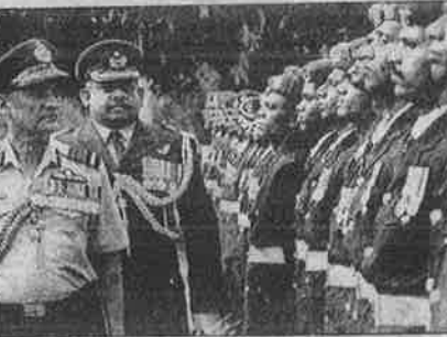
அமெரிக்காவின் ஆசியோடு இலங்கை இராணுவத்துக்கு ஆலோசனை கூற, பா.ஜ.க. கூட்டணி அரசால் அனுப்பப்பட்ட இந்திய விமானப்படைத் தளபதி டிப்ளில் (இடது ஓரம்) இலங்கை இராணுவத்தின் அணி வகுப்பைப் பார்வையிடுகிறார்.

அவைகத்த இராணுவவாதம் அடிப்படையிலானவைதான். அரசியல் ரீதியில் ஈழப் புலிகள் பூழ்மயம் என்பதையே இதுவரை நிரூபித்து வந்திருக்கிறார்கள். முதலாவதாக, இலங்கை - ஈழச் சூழலில் நண்பர்களையும் - எதிரிகளையும் பிரித்தறிந்து, சரியான அரசியல் நடைமுறையைப் பின்பற்றத் தவறி விட்டார்கள். இராணுவ - ஆயுத பலமே எல்லாவற்றையும் ஈடுசெய்து விடும் என்றும், தமது பிளாடிகளின் மூலம் நடக்கும் பிரச்சாரமும், தனிநபர் சாகச பயங்கரவாதச் செயல்களுமே அரசியல் பலவீனங்களை இட்டு நிரப்பிவிடும் என்றும் நம்புகின்றனர்.