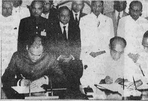
இந்தியாவின் பிராந்திய மேலாதிக்க நோக்கத்தோடு உருவாக்கப்பட்ட இந்திய - சிறீலங்கா ஒப்பந்தத்தில் கையெழுத்திடும் ராஜீவ் மற்றும் ஜெயவர்த்தனே

1996 டிசம்பரில் புலிகளின் கவனம் யாழ் தீபகற்பத்தை நோக்கித் திரும்பியது. தீபகற்பத்தின் தெற்கு, தென்கிழக்கு, கிழக்குக் கரைகளில் இறங்கி முகாம்களை நிறுவி உறு