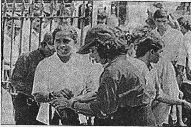
பேச்சுவார்த்தைக்கு எதிராக சிங்கள இனவெறிக் கட்சியான ஜே.வி.பி. நடத்திய ஆர்ப்பாட்டம்

துவ நடவடிக்கையில் யாழ்குடா உட்பட வடக்கில் பல பகுதிகளைக் கைப்பற்றிய போது, புலிகள் பேச்சு வார்த்தைக்கு அழைப்பு விட்டபோதும் மறுத்தது. "ஆயுதங்களைக் கீழேபோட்டு விட்டு, இலங்கையை அரசியல் சட்டத்தை ஏற்றுக் கொள்ள வேண்டும்" என்று நிறைவேற்ற நிபந்தனை போட்டது. புலிகள் ஓயாத அவைகள் நடவடிக்கையைத் துவங்கிய போது, நார்வே நாட்டுப் பஞ்சாயத்துக்கு இலங்கை அரசு ஒப்புக் கொண்ட போது, சிங்கள பாசிச இனவெறியர்கள் நார்வே நாட்டுக் கொடியை எரித்து எதிர்ப்புக் காட்டினர். அதையும் அரசு ஊக்குவித்தது. இப்போது புலிகளிடம் பெருந்தோல்வி காணும் நிலையிலும் மீண்டும் பலத்தைத் திரட்டவே கால அவகாசம் தேடிக்கொள்வதற்கே சமாதானப் பேச்சு வார்த்தை நாடகமாடுகிறது.