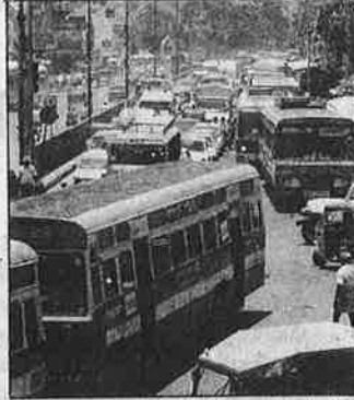
Vehicles pile on Anna Salai bumper to bumper on Monday, during the CITU procession. This stretch is part of the "green corridor" announced by Traffic police, to enable smooth vehicular flow. The police were unable to...

Ironically, a much smaller group of workers from the literacy mission who wanted to stage a dharna near the State Council House around the same time were refused permission, and they had to shift to a token protest. "The question therefore is not one of democracy and freedom of expression, but of shows of strength by organized groups," an officer said.