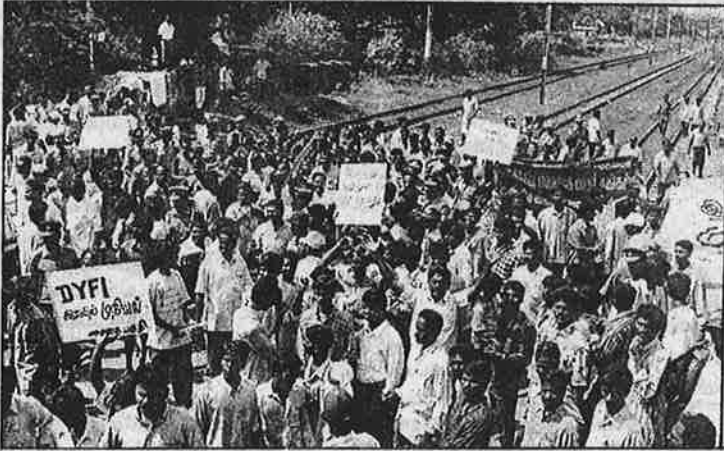
விலைவாசி உயர்வைக் கண்டித்து 'மார்க்சிஸ்டு' கட்சியின் இளைஞர் அமைப்பு நடத்திய ரயில் மறியல்: கண்துடைப்பு போராட்டம்!

மானியக் குறைப்பு, விலையேற்றத்துக்கான காரணம், அடிப்படை நோக்கம் ஏழை - எளிய மக்களுக்குத் தெரியாமல் இருக்கலாம். ஆனால், ஓட்டுக் கட்சிகள் அனைத்திற்கும் தெரியும். உலகவங்கி, சர்வதேச நிதி