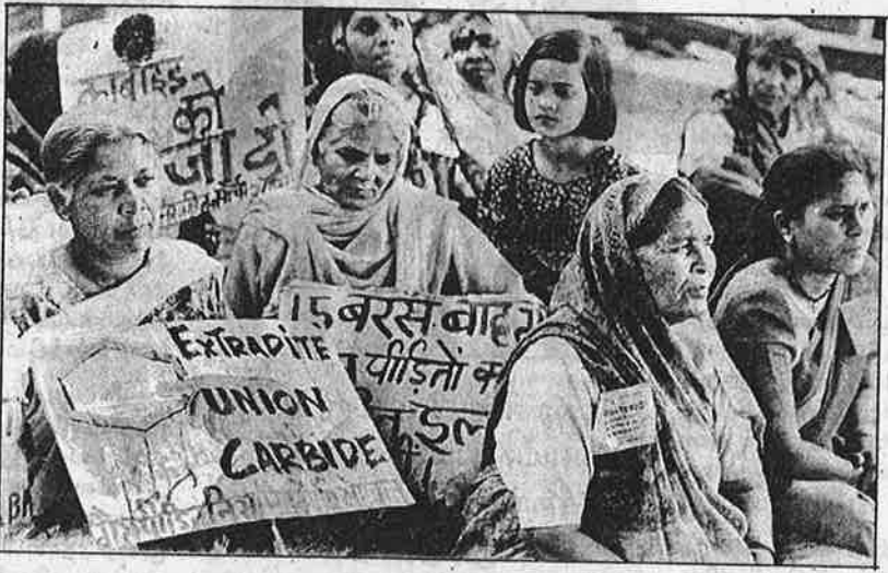
போபால் விஷ வாயுக் கசிவு வழக்கில் உச்சநீதி மன்றத் தீர்ப்பால் வருசிக்கப்பட்ட போபால் நகரத்து மக்கள்.

வழக்குத் தள்ளி வைக்கப்பட்டது. ஜெயாவின் வழக்கறிஞர் தனது கட்சிக்காரர் சிறப்பு நீதிமன்ற விசாரணைக்கு உட்படத் தயார் என்று அறிவித்தார். அப்படியே செய்யும்படி உச்சநீதி மன்றம் தீர்ப்பளித்து விட்டது. எப்படி, தடியும் உடையாமல், பாம்பும் சாகாமல் திறமையாக செயல்பட்டது, உச்சநீதி மன்றம், பார்த்தீர்களா?