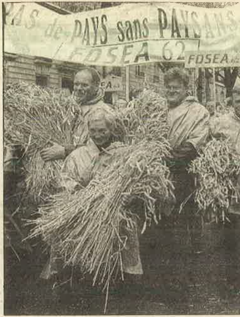
"எங்களின் விவசாயத்தை அமெரிக்காவுக்குப் பலியிட மாட்டோம்" எனப் போராடும் பிரான்சு நாட்டு உழவர்கள்.

நான்கில் மூன்று பங்கை, ஏகாதிபத்திய நாடுகள்தான், தங்கள் கைகளில் வைத்துக் கொண்டுள்ளன. மீதமுள்ள ஒரு பங்கை தான் நூறுக்கும் மேற்பட்ட ஏழை நாடுகள் பங்கு போட்டுக் கொள்கின்றன. உலக ஏற்றுமதி வர்த்தகத்தில் இந்தியாவின் பங்கு 0.6 சதவீதம்தான். இந்த அற்பமான ஏற்றுமதி வர்த்தகம் தடுக்கப்பட்டால், இந்தியப் பொருளாதாரம் அடியோடு பாதிக்கப்பட்ட வாய்ப்புகள் இல்லை.