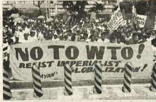
ஏகாதிபத்தியங்கள் திணிக்கும் உலகமயமாக்கலை எதிர்த்து பிலிப்பைன்சு நாட்டுத் தலைநகர் மனிலாவில் நடந்த ஆர்ப்பாட்டம்

இந்தியாவில் இருந்து அமெரிக்காவுக்கு ஏற்றுமதி செய்யப்பட்ட குட்டைப் பாவாடைகள் எளிதாகத் தீப்பிடித்துக் கொள்ளும்