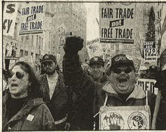
தனது வேலை உத்தரவாதத்துக்காக உ.வ.க.வை எதிர்த்தும் அமெரிக்கத் தொழிலாளர்கள்

களின் நலன்களுக்காக உருவாக்கியுள்ள, தாராளமயம் - உலகமயம், ஏகாதிபத்திய நாடுகளுக்கு, அந்நாட்டின் தொழிலாளர்களுக்கு சிலபாதகமான விளைவுகளை ஏற்படுத்துவது தவிர்க்க இயலாதது என்பதுதான்!