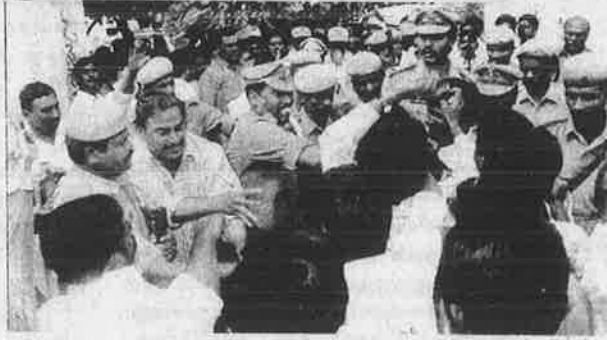
கடப்பா நகரில் போலீசு அக்கறாதலை மீறி, உலக வங்கியின் எடுபிடி சந்திரபாபு நாயுடுவின் மக்கள் விரோத ஆட்சிக்கெதிராகப் போங்கிலரும் மாணவர் போராட்டம்.

சட்டத்திற்கான செயல் திட்டத்தையும் தயாரித்துள்ளது.