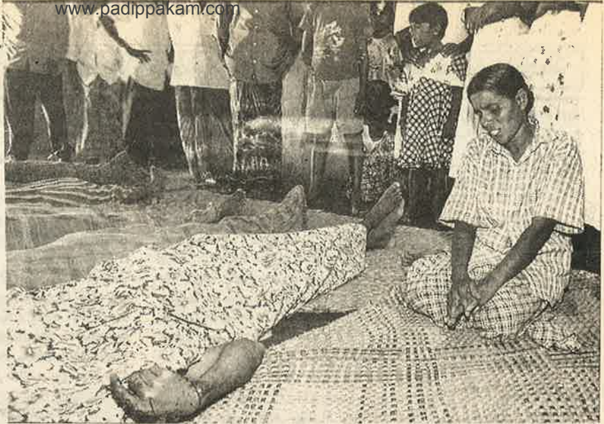
விடுதலைப் புலிகளால் கொல்லப்பட்ட சிங்கள இன மக்கள்