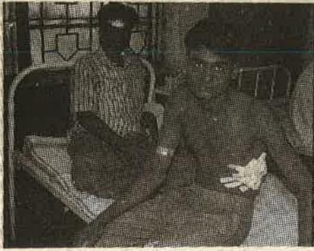
வறுமைக் கொடுமையிலிருந்து மீள், இந்திய இராணுவத்தில் சேர முயன்று, ஆடுமேடுப் பிள் போது கூட்ட நெரிசலைக் கலைக்க போலீசு நடத்திய துப்பாக்கிச் சூட்டில் படுகாயமடைந்த இளைஞர்கள்

வறுமை மிகக் கொடியது. வயிற்றுக்காக உயிருக்கே ஆபத்தான வேலைகளைப்பல உழைப்பாளிகள் செய்வதைப் பார்த்து அதிர்ச்சியும் வேதனையும் நெஞ்சைத் தாக்கும். ஆனால் அதையும் விஞ்சும் வகையில், ஒருவர் கூலிக்கு வேலை செய்யும் படை வீரனாகச் சேர்வது எவ்வளவு கொடுமையானது!