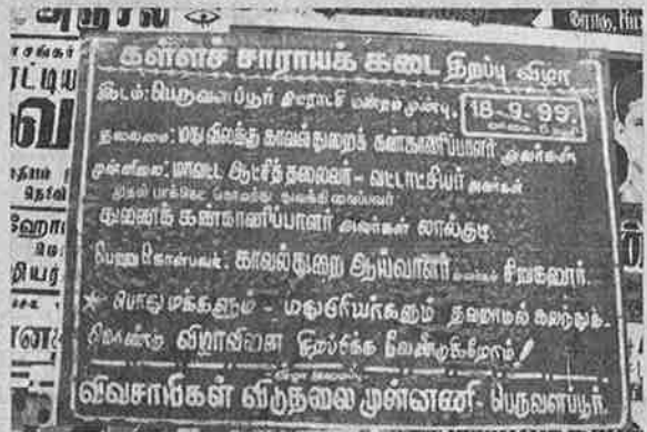
போலீசு - சாராய கிரமினல் கும்பலைக் கதி கலங்க வைத்த வி.வி.மு.வின் சுவரொட்டி

திருச்சி நகரிலும் பரவலாக கள்ளச் சாராயக் கடை திறப்பு விழா சுவரொட்டிகள் ஒட்டப்பட்டதோடு, மாவட்ட ஆட்சியர் அலுவலக வளாகத்திலும் இச்சுவரொட்டிகள் ஒட்டப்பட்டதால் நகரமே பரபரப்பாகி, பெருந்த உற்சாகத்துடன் மக்களிடம்