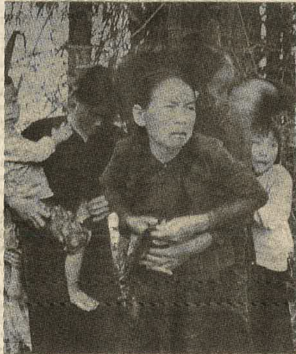
அமெரிக்க இராணுவம், தங்களை சுட்டுக் கொல்லத் தயார் ஆவதைக் கண்டு அஞ்சி நடுங்கும் வியட்நாமின் மைலாய் ரொமத்தைச் சேர்ந்த குழந்தைகள், தாய்மார்கள்.

• தென் அமெரிக்க நாடான பெருவில் 1984 ஆம் ஆண்டில் மட்டும் கிட்டத்தட்ட 5,000 க்கும் மேற்பட்டோர் இரா