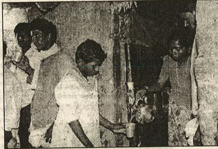
பெல்லாரி தொகுதியிலுள்ள கிராமப்புற தேர்தல் கடைகளில், தாழ்த்தப்பட்டோருக்கு அலுமினிய டம்ளர் தான்!