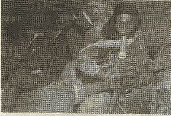
வறுமையின் கொடுமை: இந்திய இராணுவத்தில் கூலிப் படையினராகச் சேர்ந்துள்ள கூர்க்கா இளைஞர்கள்.

தாரை வார்ப்பது, உணவு தானியங்களுக்கான மானியங்களைக் குறைத்து ரேஷன் கடைகளை மூடுவது, அரசு வங்கிகளில் மக்கள் போட்டுள்ள சேமிப்புகளை குறிப்பிட்ட காலத்திற்கு திரும்ப எடுக்கத் தடைவிதிப்பது முதலான சீரமைப்புக் கொள்கைகளைத் தீவிரப்படுத்தி நெருக்கடியிலிருந்து தப்பித்து விடலாம் என்று அவர்கள் தீர்வை முன்வைக்கிறார்கள். இதுதான் தென்கிழக்காசிய நாடுகளையும், மெக்சிகோ, பிரேசில் முதலான அமெரிக்க கண்டத்து நாடுகளையும் திவாலாக்கிய பாதை. வறுமையையும் வேலையின்மையையும் மேலும் தீவிரமாக்கிய பாதை. ஏகாதிபத்திய ஜனமனர்களின் கட்டளைப்படி, இம்மரணப் பாதையில் நாட்டையும் மக்களையும் தள்ளுவதற்கே இந்திய ஆட்சியாளர்கள் தயாராக உள்ளனர் என்பதையே நிலைமைகள் சுட்டிக் காட்டுகின்றன.