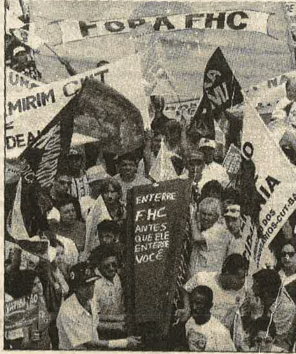
"உங்களைப் புதைகுழிக்கு அனுப்பும் முன், அதிபர் கார்டோ -சோவைப் புதையுங்கள்" என்று அதிபருக்கான சவப்பெட்டியுடன் பிரேசில் மக்கள் நடத்தும் ஆர்ப்பாட்டம்.

திவாலான நாட்டை மீட்பதாகக் கூறிக் கொண்டு ஏகாதிபத்திய வல்லரசுகளும் உலக வங்கியும் அவரசகாலக் கடன் கொடுத்து, சிக்கன சீரமைப்பு நடவடிக்கையைச் செயல்படுத்து மாறு உத்திரவிட்டன. அதன்படி தனியார்மயமாக்கல் தீவிரப்படுத்தப்பட்டு, பிரேசில் நாட்டின் 30 பெரும் வங்கிகள் அந்நியருக்குத் தாரை வார்த்தப்பட்டன. பிரேசிலின் மிகப்பெரிய அரசுத்துறை தொலைத் தொடர்பு நிறுவனமான "டெலிபிராஸ்" தனியார் மயமாக்கப்பட்டது. அதில் பணியாற்றிய ஆயிரக்கணக்கான ஊழியர்கள் வேலை நீக்கம் செய்யப்பட்டனர், திவால் நிலையைக் காட்டி அரசின் சமூக நலத் திட்டங்கள் முற்றாகக் கைவிடப்பட்டன. அரசுத்துறை ஊழியர்களின் ஒய்வூதியத் தொகையும் அரசால் முடக்கப்பட்டது. அமேசான் நதி பாயும் பிரேசிலின் வடமேற்கு வளமான நிலங்கள் அனைத்தும் அந்நியர்களால் கைப்பற்றப்பட்டு பெரும் விவசாயப் பண்ணைகளாகி விவசாயிகள் நிலமிழந்து நாடோடிகளாயினர். மொத்த விளை நிலத்தில் பாதிக்கும் மேற்பட்டவை விரல் விட்டு எண்ணக்கூடிய நிலப்பிரபுக்களிடம் அந்நிய நிறுவனங்களிடமும் உள்ளன. பிரேசில் குடிமகனின் சராசரி வருவாயைவிட மக்கள் தொகையிடில் ஒரு சதவீதமாக உள்ள பெரும் பணக்காரர்களின் வருமானம் 45 மடங்கு அதிகமாகும்.