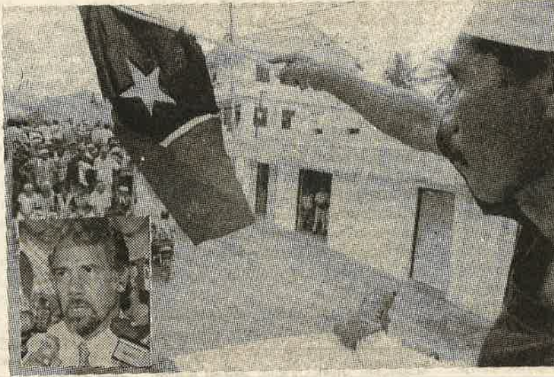
கிழக்கு திமோரின் விடுதலையை ஆதரித்து நடந்த ஊர்வலம். (உள்படம்) ஃபிரெடி லினின் தலைவர் சனானா குஸ்மாவோ

1975-ஆம் ஆண்டு இந்தோனேஷியாவில் இருந்த பிரிட்டன் தூதர், தனது அரசுக்கு எழுதிய கடிதத்தில், "இந்தோனேஷியா, எவ்விதத் தடையின்றியும், விரைவாகவும் கிழக்கு திமோரை இணைத்துக் கொள்வது பிரிட்டனின் நலன்களுக்கு உகந்தது" என எழுதினார். திமோரிய மக்களின் மீது இன ஒடுக்குமுறை பாசிசத் தாக்குதலைக் கட்ட