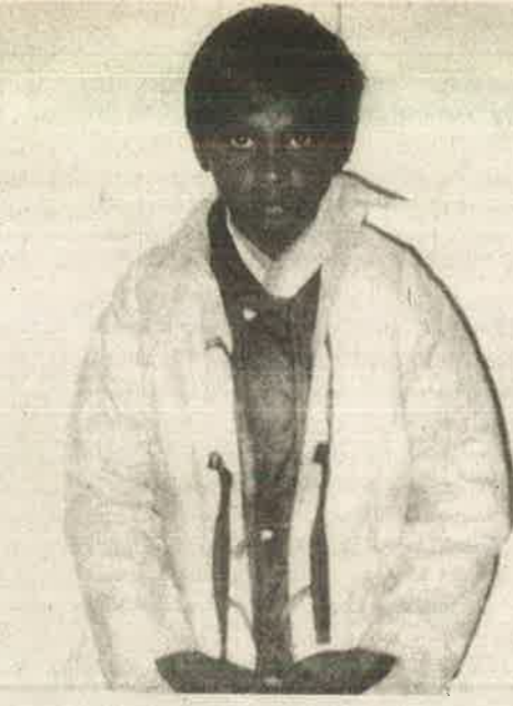
குளிர், பனி, மழையில் இருந்து தொழிலாளர் குடும்பத்தினர் தங்களைத் தற்காத்துக் கொள்ள இந்த உடைகள் போதுமா?

ஆடிக் காற்றில் பறக்கும் ஓடுகளுக்கும் பாரமாக மண் மூட்டையை நிரப்பியிருக்கிறார்கள். அதையும் தாண்டி மாஞ்சோலையில் ஓடுகள் உடையும்; காற்றிலே பறக்கும். அதனால் வரும் நடத்தை நிர்வாகம் ஏற்காது. மேகமலையில் கூரையின் மேலிருக்கும் மணல் மூட்டைகளில் செடி கொடிகளும் உண்டு. குளிரை ஓரளவிருத்ததடுக்கும் உள் கூரைச் செல்வு தொழிலாளியினுடையது. வீட்டிற்கு வெள்ளையடிக்க மூன்றாண்டுக்கு ஒருமுறை சுண்ணாம்பைக் கொடுத்து ஒரு நாள் கூலியையும் நிர்வாகம் கொடுக்கும். இதனால் வெள்ளையடிக்கும் கணக்கில் முக்கால் வாசி மிச்சமாகும். வீட்டைச் சுற்றி வேலிகள் இல்லை. கரடி தாக்கிய, பாம்புகள் கடித்த கதைகள் மாஞ்சோலையில் ஏராளம். வாசலுக்கு வெளியே தாண்டினால் அதல பாதாளச் சரிவுகளும் உண்டு. நமக்குத்தான் திகைப்பென்றாலும், மக்களுக்கு அவை சாதாரணமானவை.