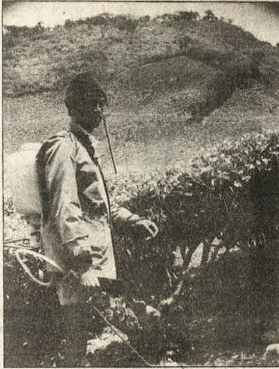
கையுறையோ, கவாசக் கவசமோ இன்றிக் தேயிலைச் செடிகளுக்கு மருந்தடிக்கும் மேகமலை எஸ்டேட் தொழிலாளி.

மலையில் ஏறிப்போய், சில ஹெக்டேர்களில் போட வேண்டும். பலரிடம் மருந்தடிப்பதற்குத் தேவையான பாதுகாப்பு கவசமோ, உடையோ கிடையாது. சில தோட்டங்களில் நிரந்தரத் தொழிலாளிக்கு மட்டும் தரப்படுகிறது. காவாத்து வெட்டுவது முன்பு கையில்; இப்போது எந்திரத்தில். 10 கிலோ எந்திரத்தை 50 கிலோ வலுக்கொண்டு இயக்கி 225 முதல் 350 செடிகள் வரை வெட்ட வேண்டும். வெட்டி முடிந்ததும் வலிக்கும் நெஞ்சில் சாராயம் இறங்கும். அலுப்பும் பறந்து போகும். இப்படிப்பட்ட ஒரு எந்திரத்தின் வேலையில் 20 பேர் உடல் உழைப்புக் கூலியும் பறி