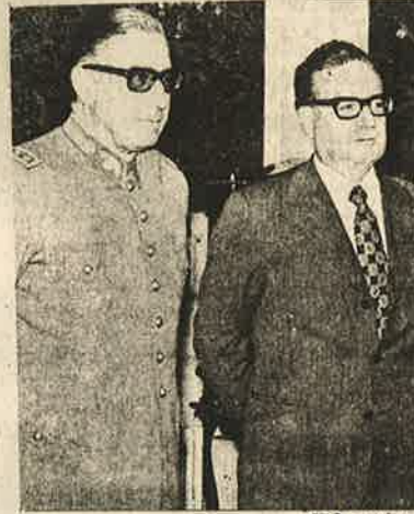
சி. நு. ஏ. சதி செய்து கொன்ற சிலி நாட்டின் முன்னாள் அதிபர் அலெண்டே (இடது)வும், அமெரிக்க கைக்கூலி பிளோசெடும்.

ஈரானில் அமெரிக்கா உதவியுடன் ஆட்சி நடத்தி வந்த மன்னர் ஷாவை கொடும்பனியின் கலைமையிலான இல்