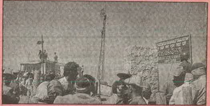
குகை வழிபாட்டுத் தலத்தின் அருகே காவிக் கொடி ஏற்றும் இந்துமத வெறியர்கள்