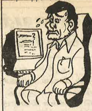
இந்தச் சனியன்புடிச் இண்டர்நெட்டால், எனருகில் நடந்த விபச்சார ஏலம் உலகெங்கும் தெரிஞ்சு போச்சே

விபச்சார விடுதிகளை நடத்தும் சமூக விரோதிகளுக்கும், அரசியல்வாதிகளுக்கும் தொடர்பு இருப்பது ஒருபுறமிருக்க, தாராளமயமாக்கலின் பின் இந்திய அரசு நோகாமல் வருமானம் ஈட்டிக்கொள்ள, சுற்றுலாகத் துறையைதான் பெரி