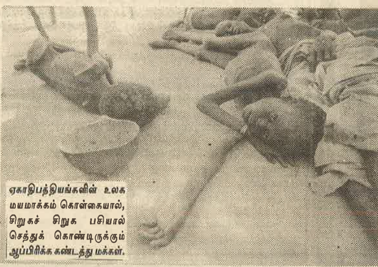
ஏகாதிபத்தியங்களின் உலகமயமாக்கம் கொள்கையால், சிறுகச் சிறுக பசியால் செத்துக் கொண்டிருக்கும் ஆப்பிரிக்க கண்டத்து மக்கள்.

அமெரிக்காவும் இங்கிலாந்தும் இணைந்து நடத்திய இத்தாக்குதலை ஆதரிக்கும் ஏனைய வல்லரசுகளையும், அவற்றின் அடிமைகளையும் எளிதில் இனங்காண முடியும். ஆனால்,