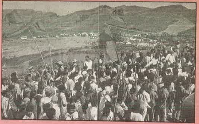
இரத யாத்திரை நடத்தி இன்னுமொரு அயோத்தியை கர்நாடகாவில் உருவாக்கத் துடிக்கும் இந்துமத வெறியர்களின் சதித்தனம்.

சென்ற டிசம்பர் மாதம் தத்தாத்ரேயா ஜெயந்தி நடைபெறுவதற்கு முன்பு, விசுவ இந்து பரிஷத், பஜ்ரங் தள், ஆர்.எஸ்.எல். ஆகிய மூன்று அமைப்புகளும் இணைந்து "இந்தக் குகை வழிபாட்டுத் தலத்தை விடுதலை செய்யும் இரத யாத்திரைகளை"