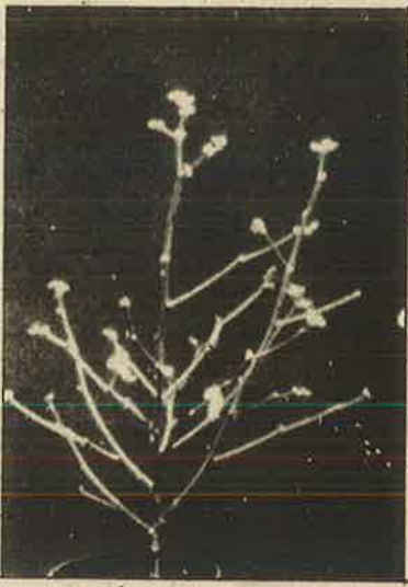
பாரம்பரிய பருத்திச் செடியும், அமெரிக்க விதையில் உருவான பருத்திச் செடியும்: விவசாயிகளை மோசடி செய்யும் விளம்பர வித்தை.

மேலும், மாள்சாண்டோ நிறுவனத்தின் புதியரகப் பருத்தி விதைகள் மண்ணின் உயிரியல் தன்மையை அழித்து விடுகின்றன. விவசாயிகளின் நண்பனாகிய மண்புழு மற்றும் பிற உயிரிகள் இப்புதியரகப் பருத்தியால் கொல்லப்படுகின்றன. இவ்வகை பருத்திப் பூவின் மகரந்தத் துகள்கள் காற்றின் மூலமோ, பிற பூச்சிகள் மூலமோ அண்டையிலுள்ள வேறு பயிர்களில் சேர்ந்தால், அப்பயிரின் விதைகளும் மண்ணின் உயிரியல் தன்மையை அழிப்பதாக மாறிவிடும். எதிர்காலத்தில் எதையும் பயிரிட முடியாதபடி விளை நிலங்கள் தரிசாகிவிடும்.