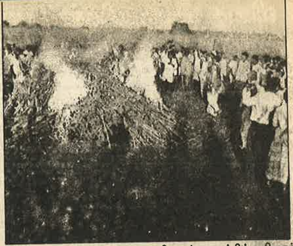
அமெரிக்க நச்சு விதைகளால் விளைந்த பருத்திப் பயிரைத் தீயிட்டுக் கொளுத்தும் கர்நாடக விவசாயிகள்.

இச்சங்கத்தின் கெடுவினால் பீதியடைந்த கர்நாடக அரசு இவ்விதை நிறுவனத்தை நாங்கள் அனுமதிக்கவில்லை; அதைத் தடை செய்யவும் எங்களுக்கு அதிக