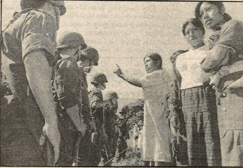
மெக்சிகோ இராணுவத்தினரை கிராமத்திற்குள் நுழைய விடாமல் தடுத்து நிறுத்தும் சியாபஸ் பழங்குடி இனப் பெண்கள்.

வெயில் நன்றாகக் கொளுத்தியது; காட்டில் இருந்து வீசிய காற்று கூட வெப்பமாக இருந்தது. சாலையைப் பார்த்துக் கொண்டிருந்தவர்களுள் ஒருவன், "அடக்கடவுளே, அதோ அவர்கள்" என்றான். நாங்கள் அனைவரும் பதட்டத்தோடு எழுந்து நின்றோம். ஒரு 500 மீட்டருக்கு அப்பால் பெரிய இராணுவப் பட்டாளம்; வீரர்களையும், ஆயுதங்களையும் ஏற்றிக் கொண்டு வந்த லாரிகள் ஒவ்வொன்றாக சாலையின் வளைவில் திரும்பின. குழந்தைகள் கற்களைப் பொறுக்கத் தொடங்கினர். மனித உரிமை அமைப்புகளில் இருந்து வந்தவர்கள் தங்கள் புகைப்படக் கருவிகளை கீழே குனிந்து எடுத்துக் கொண்டார்கள். இதே சமயத்தில் பெண்கள் கைகளில் கழிகளோடு சாலையை நோக்கி முன்னே நடக்கத் தொடங்கினர்.