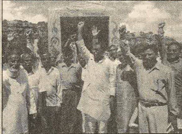
ஆர்.எஸ்.எஸ்.-இன் சுதேசி யாத்திரை: மோசடிப் பேர்வழிகள் வருகிறார்கள்... பொது மக்களே உஷார்!

னாட்டு நிறுவனங்களை அனுமதிக்க மாட்டோம்; இதுதான் சுதேசி" எனப் பேசி வந்த பா.ஜ.க., பன்னாட்டு நிறுவனங்கள் 100 சதவீதம் மூலதனமிட்டு சிகரெட் உற்பத்தியில் ஈடுபட அனுமதித்துள்ளது.