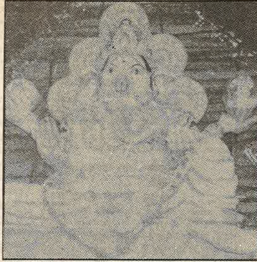
இந்து முன்னணியின் அணுகுண்டு விநாயகர்; இந்துக்கள், இவரிடம் தங்கள் துன்பம் தீர வேண்டுவதா? இல்லை, பாகிஸ்தான் மீது குண்டு போடச் சொல்லி வேண்டுவதா?

"இந்து மத சாஸ்திரங்களின்படி நிறுவப்பட்டு, பூசை செய்யப்பட்டு, வணங்கப்பட்ட பிள்ளையார் சிலைகள், பூசை முடிந்து தெருவுக்கு இழுத்து வரப்பட்டபின், அதிலிருந்து கடவுள் மறைந்து விடுகிறார். தெருவுக்கு இழுத்து வரப்பட்டவை, இந்து மத சாஸ்திரங்களின்படியே, அவை வெறும் களிமண் சிலைகள்தான்; அல்லது பிளாஸ்டர் ஆஃப் பாரிசால் செய்யப்பட்ட உருவ பொம்மைகள்தான். அதை இந்து முன்னணிக் காலிகளும், இன்னபிற இந்து மதவெறி அமைப்புகளும் கண்ட துண்டமாக அறுக்கலாம்; காலால் மிதிக்கலாம். அச்சிலைகளில் இருந்த கடவுள் மறைந்து விட்டதால், ஊர்வலத்தின் பொழுது அந்த உருவ பொம்மைகளுக்கு நேரிட அலவங்களைக் கண்டு, இந்து பக்தர்கள் பதைபதைக்கத் தேவையில்லை. இதுதான் பார்ப்பனக் கும்பல் கற்பிக்கும் நியாயம்!