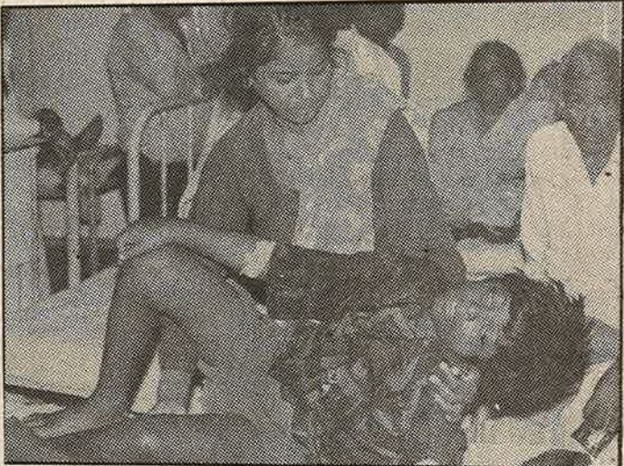
கலப்பட எண்ணெயின் கோரம்: மருத்துவமனையில் உயிருக்குப் போராடும் குழந்தைகள்

கூடந்த மாதத்தில் சமையல் எண்ணெய் கலப்படத்தால் பிஞ்சுக் குழந்தைகள் உட்பட 50-க்கும் மேற்பட்டோர் கொல்லப்பட்டனர்.