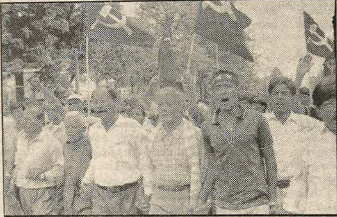
இராணுவத்தின் பயங்கரவாத வெறியாட்டத்தை எதிர்த்து நேபாளத் தலைநகரில் கம்யூனிஸ்டுகள் நடத்தும் ஆர்ப்பாட்டம்