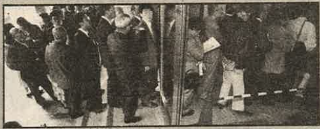
திவாலான யாமைசி நிறுவனத்திலிருந்து தமது முதலீட்டைத் திரும்பப் பெறக் காத்திருக்கும் ஜப்பானிய ஏமாளிகள்.

டிசம்பரில் திவாலாகி மூடப்பட்டது. இது ஆண்டுக்கு 2500 கோடி டாலர் அளவுக்கு வியாபாரம்