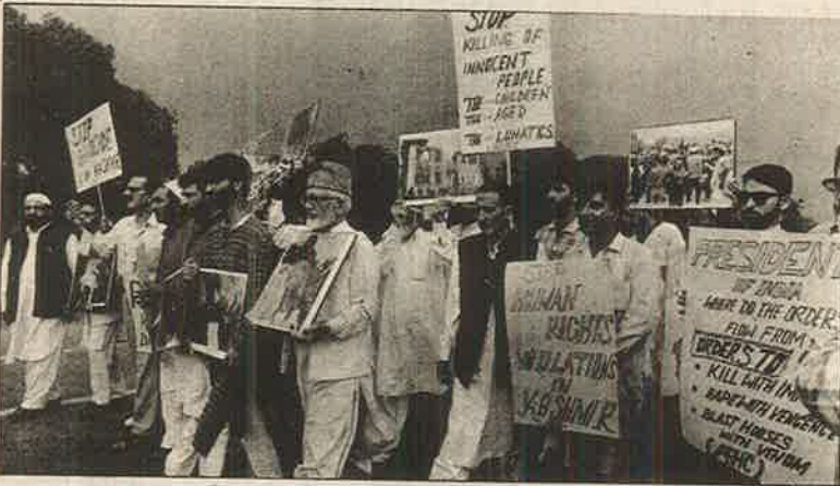
காஷ்மீரில் தொடரும் அரசு பயங்கரவாத அடக்குமுறைக்கு எதிராக மனித உரிமை அமைப்பினரின் ஆர்ப்பாட்டப் பேரணி.

கடந்த நவம்பர் மாத மத்தியில் இந்தியக் குடியரசுத் தலைவர் சிறீநகருக்கு வருகை தந்த போது, வீடுவீடாக சோதனை நடத்தப்பட்டு நூற்றுக்கணக்கான அப்பாவி இளைஞர்கள் கைது செய்யப்பட்டனர். ஜம்மு - காஷ்மீர் விடுதலை முன்னணியின் தலைவரான யாகின் மாலிக் உட்பட பல்வேறு அரசியல் இயக்கங்களின் பிரமுகர்களும் முன்னணியாளர்களும் கைது செய்யப்பட்டு சிறையிடப்பட்டனர். 'குடியரசுத் தலைவர் திரும்பிச் சென்ற பின்னரும் இந்த அடக்குமுறை தொடர்கிறது.