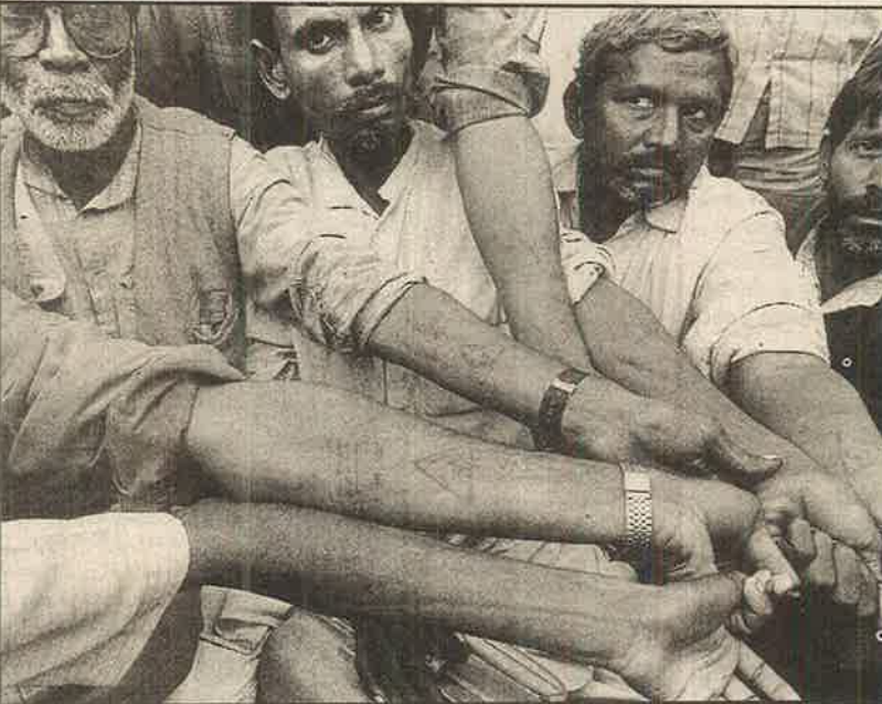
“இவன் ஜான்சி சிறையில் இருந்து விடுதலையானவன்” எனப் போலீசால் முத்திரை குத்தப்பட்டவர்கள்: போலீசுக்கு சாதாரண மனிதர்கள் அடிமாடுகள் தான்.

வரையறைபற்ற கைதுகள் - கொட்டிக் கொலைகளைக் கட்டுப்படுத்த உச்சநீதிமன்றத்தால் கொண்டு வரப்பட்ட ஆணைகள் எல்லாம் வெத்து வேட்டாயின.