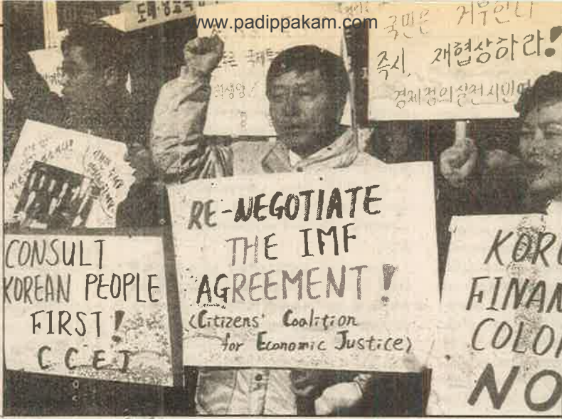
நாட்டைத் திவாலாக்கி ஐ.எம்.எஃப்.பி.டம் அடகுவைத்த துரோகிகளுக்கு எதிராக தென்கொரிய மாணவர் - தொழிலாளர்களின் ஆர்ப்பாட்டம்.

“தென் கிழக்காசிய நாடுகளைப் போல இந்தியாவில் பொருளாதார