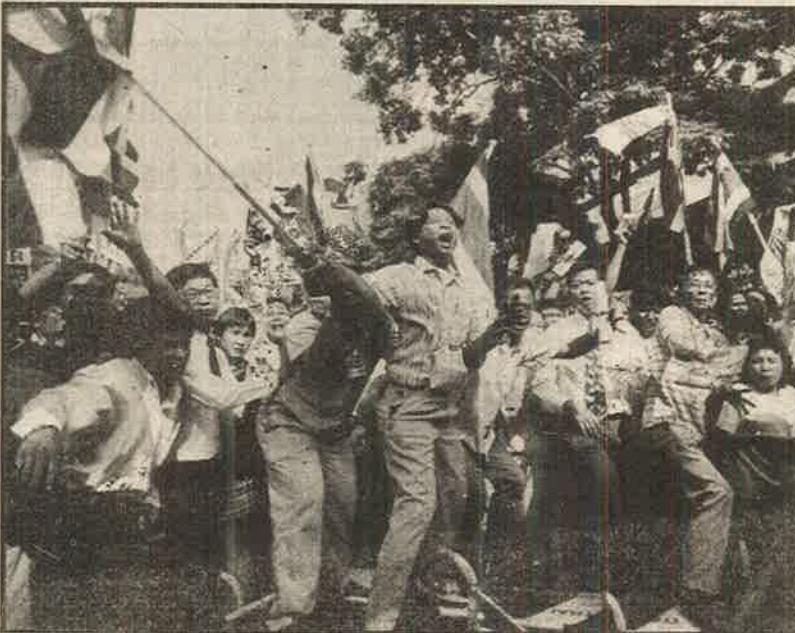
நாட்டைத் திவாலாக்கிய துரோக ஆட்சியாளர்களுக்கு எதிராக தாய்லாந்து தொழிலாளர் - அரசு ஊழியர்களின் போர்க்கோலம்.

யும் அடிமைத் தனத்தை யுமே விளைவாகக் கொண்ட தனியார் மயம் - தாராளமயம் - உலகமயம் எனும் ஏகாதிபத்திய கட்டமைப்புக்கு உலக மக்கள் இனியும் இசைந்து செல்ல முடியாது. தென் கிழக்காசிய நாடுகளைப் போலவே இந்தியாவும் திவாலாகும் அபாயத்தில் உள்ள நிலையில், இந்திய மக்கள் விழித்தெழ வேண்டும். தென்கிழக்காசிய மக்களுக்கு ஆதரவாக, ஏகாதிபத்தியங்களுக்கும் ஐ.எம்.எஃப்.பி.ன் முத்தலான அதன் ஆதிக்கக் கருவிகளுக்கும் எதிரான போராட்டத்தைத் தொடர அணி திரள வேண்டும்.