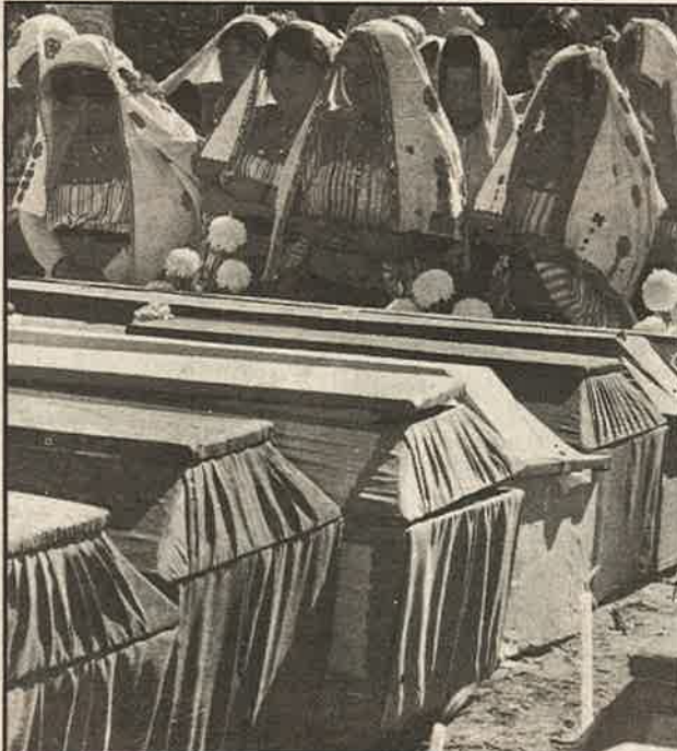
நிலப்பிரபுக்களின் குண்டர் படையால் கொல்லப்பட்ட விவசாயிகளுக்கு இறுதி அஞ்சலி செலுத்தும் செவ்வந்தியர்கள்.

இலங்கையில் கடந்த டிசம்பர் 12-ஆம் நாளன்று களுத்துறை சிறையில் நடந்துள்ள சிங்கள இனவெறிப் படுகொலைகள், சந்திரிகா அரசின் கோர முகத்தை மீண்டும் திரைகிழித்துக் காட்டியுள்ளது. 1983-ம் ஆண்டு சிங்கள சிறைச்சாலையில் 52 தமிழ்க் கைதிகள் கொல்லப்பட்டதையடுத்து நடந்துள்ள மிகப்பெரிய தாக்குதலாகும் இது. டிசம்பர் 10-ஆம் நாள் மனித உரிமைகள் தினத்தை நினைவு கூர்ந்து உலகெங்கும் ஆர்ப்பாட்டங்கள் நடந்த வேளையில் கொழும்பு - களுத்துறை சிறையில் சிங்கள கைதிகளிடையே உள்ள ரௌடிகளுக்கும் தமிழ்க் கைதிகளுக்கும்மிடையே வாக்குவாதம் முற்றி கைகலப்பு நடந்தது. உணவுப் பகிர்வின் போது சிங்கள ரௌடிகளுக்கு அதிகளவு உணவு வழங்குவதும், தமிழ்க் கைதிகளுக்கு அற்ப அளவு வழங்குவதுமாக உள்ளதை எதிர்த்து தமிழ்க் கைதிகள் கேள்வி கேட்டதை ஒட்டியே இக்கைகலப்பு நடந்துள்ளது. களுத்துறை சிறையில் மொத்தமுள்ள 884 கைதிகளில் 445 பேர் தமிழர்கள். அவர்கள் அனைவருமே அரசியல் கைதிகளாவர். அதேநாளில் இதர சிறைகளிலிருந்து சிங்கள இனவெறி பிடித்த கைதிகள் களுத்துறை சிறைக்கு திட்டமிட்டே கொண்டு வரப்பட்டனர்.