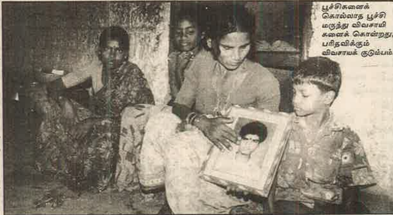
பூச்சிகளைக் கொல்வதற்கு பூச்சி மருந்து விவசாயிகளைக் கொன்றது; பரிதவிக்கும் விவசாயக் குடும்பம்.