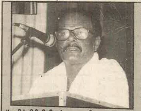
"தலித் பிரிவினருந்து ஒரு சரியான தலைமை உருவாகும் வரை ராமதாசு தான் தமிழர்கள் தலைவர்" என்று நிறப்பிரிசுகையில் பிரபஞ்சன் பிரகடனம் செய்தார். நிறப்பிரிசுகை நடத்திய அந்த ஆய்வரங்கத்தின் விவாதத்தில் கலந்து கொண்ட அறிஞர் பெருமக்கள் யாரும் இதற்கு முரண்பட்ட கருத்துக் கூறவில்லை.