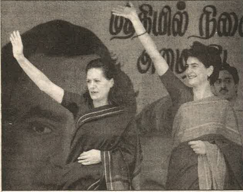
திருப்பெரும்புதூரில் சோனியாவும், அவரது மகள் பிரியங்காவும்: விசுவாசத்தையும், அனுதாபத்தையும் ஒரு சேரக் கலந்து வகுக்கப்பட்டுள்ள காங்கிரசின் தேர்தல் உத்தி

மர்மப் புன்னகையுடன் இருந்த 'மோனாலிசா' ஒரு வழியாக வாழ் திறந்து பேசத் தொடங்கி விட்டார். பல கோஷ்டிகளாகப் பிளவுபட்டு, சிதறண்டு இற்று விழுந்து கொண்டிருக்கும் காங்கிரசுக் கட்சிக்கு முட்டுக் கொடுக்கும் கடைசி முயற்சியாக சோனியாவும் தேர்தல் பிரச்சாரத்தில் இறங்கி விட்டார். தனது வாகி பிரியங்காவின் ராஜீவ் கொலையுண்ட திருப்பெரும்புதூரில் தனது தேர்தல் பிரச்சாரத்தைத் துவக்கிய அவர், பெங்களூர், ஐதராபாத் என்று தென் மாநிலங்களில் பறந்து, ஒவ்வொரு இடத்துக்கும் ஏற்ப ஒவ்வொரு நாக்குடன் பேசும் அளவுக்குத் தேர்ச்சியும் பெற்று விட்டார். பாசிஸ்டுகளுக்கே உரித்தான திமிரோடும், அண்டப்புளுகை அவிழ்த்து விட்டுச் சதிராடுவதிலும் பாசிச ஜெயாவையும் அவர் விஞ்சுகிறார். தேர்தல் நெருங்கியதும் தமிழ்நாடு, பீகார், மே.