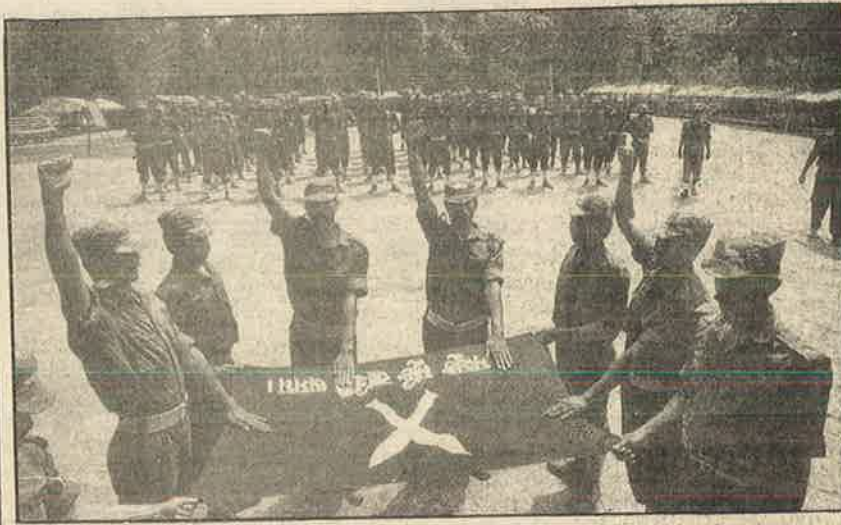
பயிற்சியில் உல்ஃபா போராளிகள்

இது அரசியல்வாதியும் அரசாங்கத் தலைவருமான மகந்தாவுக்கும் தரகு அதிகார முதலாளி டாடாக்களுக்கும் இடையிலான மோதல் மட்டுமல்ல. மகந்தாவோடு சேர்ந்து இராணுவ, போலீசு அதிகாரிகளும் இதே குற் றச்சாட்டுகளை வைக்கிறார்கள். டாடாக்க ளுக்குப் பின்னே இன்னும் சில தரகு அதிகார முதலாளிகளும், அரசிப்பல் தலைவர்களும்