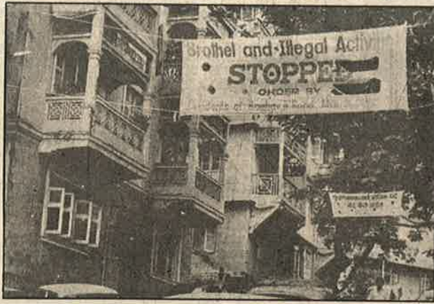
"இங்கே விபச்சாரம் ஒழிக்கப்பட்டு விட்டது" என்று "பேனர்" கட்டி போராட்ட வெற்றி அறிவிக்கப்படுகிறது.

விபச்சார மையமாக மாறியிருந்த தெற்கு மும்பையிலுள்ள ராகவ்ஜி சாலையிலிருந்து விபச்சாரிகளை வெளியேற்றுவதில், அப்பகுதிவாழ் மக்கள் தொடர்ச்சியான போராட்டத்திற்குப் பிறகு வெற்றியைச் சாதித்துள்ளனர். ஏற்கனவே மும்பை நகரின் பல பகுதிகள் விபச்சார - சமூக விரோதிகளின் மையமாகிவிட்ட நிலையில், மேட்டுக்குடி - நடுத்தர வர்க்கத்தினர் வாழும் பகுதிகளிலும் இவை பரவத் தொடங்கியுள்ளன. மேல்தட்டு நடுத்தர வர்க்கத்தினர் வாழும் ராகவ்ஜி சாலை பகுதியில் இரவானதும் விபச்சாரிகளை நாடி கார்கள், மோட்டார் சைக்கிள், ஆட்டோ, டாக்கிகளில் பலர் குவியத் தொடங்குவர். சாராய போளையில் பலர் கலாட்டா செய்வர். கடந்த பல ஆண்டுகளாகத் தொடரும் இந்த அக்கிரமத்தை எதிர்த்து இப்பகுதிவாழ் மக்கள் அரசு உயர் அதிகாரிகளுக்கும் போலீசாருக்கும் பலமுறை புகார் மனுக்களை அனுப்பியும், டார்டியோ போலீசு நிலையத்துக்கு நேரில் திரண்டு சென்று முறையிட்டும் கூட எந்த நடவடிக்கையும் எடுக்கப்படவில்லை. விபச்சாரிகளின் சம்பளப் பட்டியலில் போலீசாரும், வாடிகையாளர்களாக உயரதிகாரிகளும் உள்ள நிலையில் புகார்கள் குப்பைக் கூடைக்குச் சென்றன.