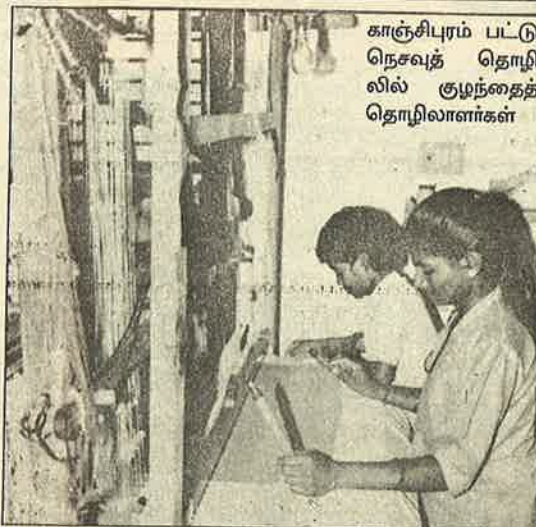
காஞ்சிபுரம் பட்டு நெசவுத் தொழிலில் குழந்தைத் தொழிலாளர்கள்

ரசியா, பெலாரூஸ், மாஸ்கோவா, உக்கரை நாடுகளில் இவ்வருட குளிர் காலம் மிக மோசமானதாக இருக்கும் என எதிர்பார்க்கப்படுகிறது. அப்பொழுது இந்நாடுகளின் வெப்பநிலை உறைபனி நிலைக்கும் கீழாக, — 50 டிகிரிக்கு சென்று விடுமாம். இந்நாடுகளைச் சேர்ந்த 10 இலட்சத்திற்கும் அதிகமான ஏழைகள், அநாதைகளை இக்கட்டுங்குளிரில் இருந்து காப்பாற்ற 565 கோடி ரூபாய் தேவை. ஆனால் பொருளாதார சீர்திருத்தங்களினால் இந்நாடு