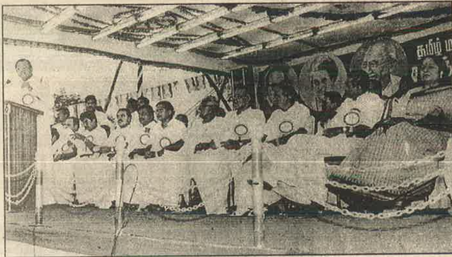
த.மா.கா. மதுரையில் நடத்திய தாழ்த்தப்பட்டோர் உரிமை பாதுகாப்பு மண்டல மாநாடு : ஓட்டுப்பொறுக்கப்போடும் நாடகம்.

சவுக்கடிக்கும் தாழ்த்தப்பட்ட மக்கள் இன்றும் தனது இன்னுயிரைத் தந்து கொண்டிருப்பார்கள். இன்றைக்கும் மூப்பனாரின் ஊரில் தாழ்த்தப்பட்ட மக்கள் இவரது பெயரைக் கூற முடியாது என்பதே இதற்கு சான்றாக அமையும்.