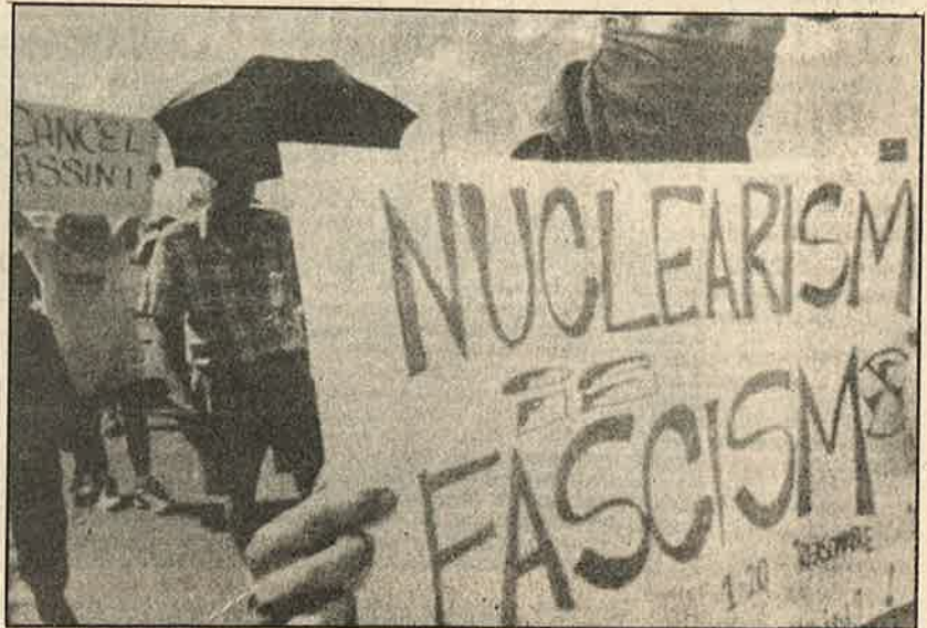
“அணு ஆயுத பாசிசம் ஒழிக!” - அணுக் கதிர்வீச்சு அபாயம் கொண்ட அமெரிக்காவின் “காசினி” விண்கோளுக்கு எதிராக ஆர்ப்பாட்டம்.

தற்போது சனி கிரகத்துக்கு “காசினி” எனும் விண்கோளை அமெரிக்கா ஏவியுள்ளது. 2004-ம் ஆண்டில் சனியைச் சென்றடையும் இக்கோளுக்கு சக்தியளிக்க 30 கிலோ எடையுள்ள புரூட்டோனியம் அடங்கிய மின்கலங்கள் வைக்கப்பட்டுள்ளன. எந்த விண்கோளும் இந்த அளவுக்கு கதிரியக்க ஆற்றல் கொண்ட புரூட்டோனியத்தைக்