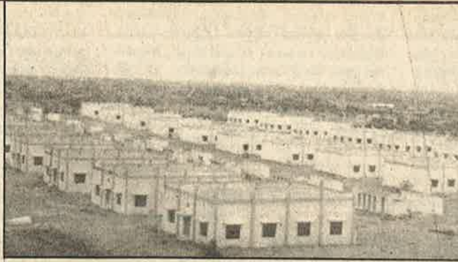
திருப்பூர் - முதலிபாளையத்தில் இன்னும் திறக்கப்படாமல் பாழடையும் பின்னலாடைத் தொழிற்பேட்டை.

தமிழகத்தில் ஆயிரக் கணக்கானோர் ஈடுபட்டுள்ளனர். இப்போது இவர்களது பிழைப்பிலும் மண் விழுந்துவிட்டது. தீப் பெட்டி தொழிலைப் போலவே காலணி தயாரிப்புத் தொழிலிலும் இயந்திரமயமாக்கம் வேகமாக திணிக்கப்பட்டு வருகிறது. "காலணிகளை பெரிய அளவில் உற்பத்தி செய்பவும் ஏற்றுமதி செய்பவும் இதர நாடுகளுடன் போட்டியிடவும் பெருமளவு மூலதனமும் நவீனப்படுத்தலும் அவசியமாகிறது. சிறு தொழில் துறையில் அவ்வளவு முதலீடு செய்ய முடியாதபடி வரம்புகள் உள்ளன. எனவே சிறுதொழில்