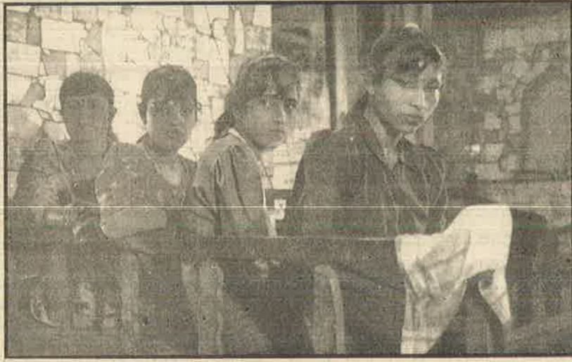
விபச்சாரச் சந்தையில் சிறுமிகள் : தாராளமயமாக்கலின் எதிர் விளைவு.

இருக்கலாம்” என யுனிசெப் அறிக்கை அம்பலப்படுத்தியுள்ளது. கோவாவில் வெள்ளைப் பன்றிகள்; பிற இடங்களில் உள்நூர் ஓநாய்கள். இக்கும்பலுக்கு தோலின் நிறத்தில்தான் வேறுபாடேயன்றி, வக்கிர புத்தியில் அல்ல.