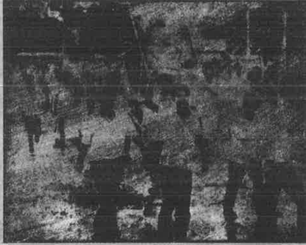
நக்சல்பாரி பேரெழுச்சிக்கு ஆதரவாக கல்கத்தா நகர வீதியில் திரண்ட புரட்சியாளர்கள்.

1967 மார்ச் 18-இல் தொடங்கிய நக்சல்பாரி விவசாயிகளின் போராட்டம் ஏப்ரல் மாதத்தில் பேரெழுச்சியாகப் பற்றிப்பரவியது. நிலப்பிரபுக்களிடமிருந்த விவசாயிகளின் உடன் பந்திரங்கள் பறிக்கப்பட்டு தீக்கிரையாக்கப்பட்டன. நிலப்பிரபுக்களின் ஆயுதங்களும், துப்பாக்கிகளும் பறிமுதல் செய்யப்பட்டன. கொடிய நிலப்பிரபுக்களுக்கு விவசாயிகள் கமிட்டி மரண தண்டனை வழங்கியது. வில்லும் அம்பும் கோடரியும் துப்பாக்கியும் ஏந்திய விவசாயிகள், அந்த வட்டாரத்தின் நிர்வாகத்தைத் தங்கள் கைகளில் எடுத்துக் கொண்டனர். விவசாயிகளின் அனுமதியின்றி யாரும் அப்பிராந்தியத்திலுள்ள நுழைய முடியாது என்ற நிலைமை மே மாதத்தில் சாதிக்கப்பட்டது. "உழுபவனுக்கே நிலம் சொந்தம்; உழைப்பவனுக்கே அதிகாரம்" என்ற முழுக்கம் நடைமுறையில் நிறுவிக்கப்பட்டது. விவசாயிகள் முதன்முதலாக சுதந்திரக் கூற்றை சுவாசிக்கத் தொடங்கினர்.