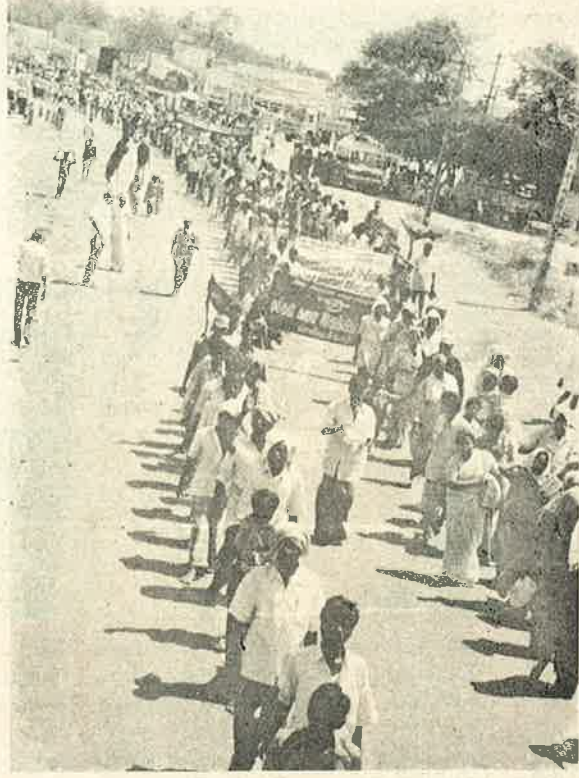
நெய்வேலியில் தடையை மீறி மறியல் செய்ய அணிவகுத்துச் செல்லும் தோழர்கள்