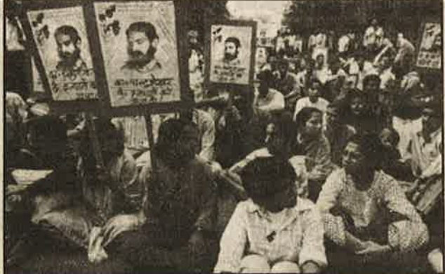
கொலைகார லல்லு கும்பலுக்கு எதிராக, மாண்புமிகு போள மாணவர் தலைவர் படத்தை ஏந்தி தில்லிப் பக்கலைக்கழக மாணவர்கள் நடத்தும் ஆர்ப்பாட்டம்.

பாலஸ்தீன சுயாட்சி துரோக ஒப்பந்தம் கழிப்பறைக் காகிதமாகிப் போனதையடுத்து, யூதர்களுக்கும் பாலஸ்தீனியர்களுக்கும் மிடையே அவ்வப்போது நடந்து வந்த மோதல்கள் அண்மைக் காலமாக உக்கிரமடைந்துள்ளன. கடந்த மார்ச் மத்தியில், ஜெருசலேம் எல்லையை ஒட்டியுள்ள குன்றுப் பகுதியான ஜீபெல் அபு ஹீரான்ப் பகுதியில் யூதர்களுக்கான குடியிருப்புக்களைக் கட்ட இஸ்ரேலிய இனவெறி அரசு முற்பட்டதும், தமது பாரம்பரிய