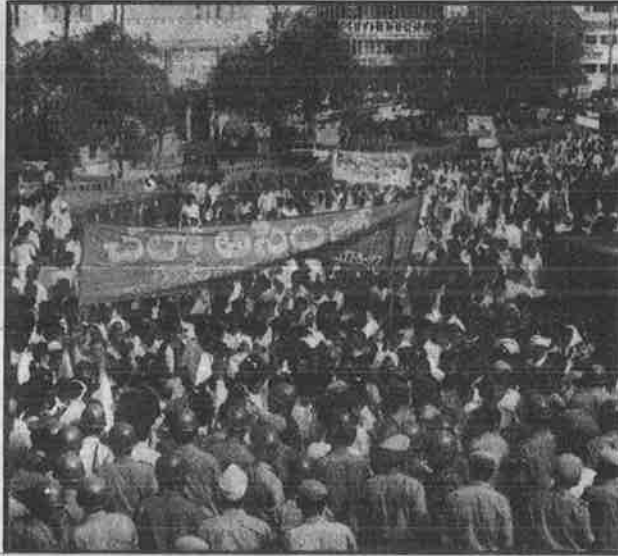
கட்டுமின்வெட்டினால் பாதிக்கப்பட்ட ஆந்திர விவசாயிகள் கடைப் பஞ்சாயத்து எப்படியிருக்க அரசுக்கு எதிராக நடத்தும் போராட்டம், கும் என்று சொல்லத் தேவையில்லை.

இப்பிரச்சினையை யொட்டி இஸ்ரேலிய அரசுக்கும் பாலஸ்தீன விடுதலை இயக்கத்தலைவர் அராபத்துக்குமிடையே அமெரிக்க அதிபர் கிளின்டன் முன்னிலையில் நடந்த சமரசப் பேச்சு வார்த்தைகள் இன்னமும் இருபுறமியிலேயே நிற்கிறது. யூதர்களுக்கு விடு கட்டித் தரும் இஸ்ரேலின் திட்டத்தை எதிர்த்து ஐ.நா. பாதுகாப்பு சபையில் ஐரோப்பிய ஏகாதிபத்தியங்கள் கண்டனத்தீர்மானம் கொண்டு வந்தபோது, அமெரிக்கா தனது "விட்டோ" அதிகாரத்தைப் பயன்படுத்தி அதை ரத்து செய்து தனது விசுவாசியான இஸ்ரேலுக்கு ஆதரவாக நின்றது. இந்நிலையில் அமெரிக்காவின் சமரசக் கட்டுமின்வெட்டினால் பாதிக்கப்பட்ட ஆந்திர விவசாயிகள் கடைப் பஞ்சாயத்து எப்படியிருக்க அரசுக்கு எதிராக நடத்தும் போராட்டம், கும் என்று சொல்லத் தேவையில்லை.