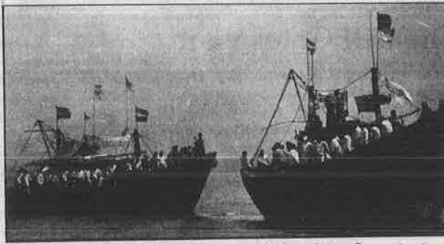
மும்பை துறைமுகத்தை முற்றுகையிட்டு மறியல் போராட்டம் நடத்தும் மீனவர்கள்.

1991-இல் அறிவிக்கப்பட்ட ஆழ்கடல் மீன்பிடிக் கொள்கையினால், நாட்டின் 80 இலட்சத்துக்கும் மேற்பட்ட பாரம்பரிய மீனவர்களின் தொழிலும், வாழ்வும் கடுமையாகப் பாதிக்கப்பட்டது. மீனவர்களின் அன்றாட வருவாய் ரூ.50 - இலிருந்து ரூ.8 - ஆகக் குறைந்தது. இதுதவிர அன்னிய ஆழ்கடல் மீன்பிடிக்கப்பல்களால் பாரம்பரிய மீனவர்களின் வலைகள் அறுபட்டு பெருத்த நட்டம் ஏற்பட்டது. ட்ராலிங் முறையில் ராட்சத எந்திரங்களுடன் அந்நியக் கப்பல்கள் மீன்பிடிப்பதால், மீன் குஞ்சுகளும், முட்டைகளும் அழிந்து மீன் வளமே நாசமாகப்பட்டது. கடல் வளத்தையே நாசமாக்கும் அன்னிய ஆழ்கடல் மீன்பிடி நிறுவனங்களுக்கு ஒரு விட்டர் டீசல் 2 ரூபாய்க்கு மானிய விலையில் வழங்கப்பட்டது. அதேசமயம் இந்திய பாரம்பரிய மீனவர்களுக்கு இச்சலுகைகள் ஏதும் கிடையாது. அன்னிய நிறுவனங்களுக்கு தாராள சலுகைகள் அளித்து கடல் வளத்தையே நாசமாக்கும் அரசின் கொள்கையை எதிர்த்து மீனவர்கள் தொடர்ந்து போராடிய பிறகு, அரசு நியமித்த முராசி கமிட்டியும், நாடாளுமன்ற நிலைக் குழுவும் கடற்கரை மாநிலங்களில் சுற்றுப்பயணம் செய்து அந்நிய நிறுவனங்களுக்கு வழங்கப்பட்ட மீன்பிடி உரிமத்தை ரத்து செய்யுமாறு வலியுறுத்தின. ஆனாலும் ஆட்சியாளர்கள் இதை ஏற்று செயல்படுத்தவில்லை.