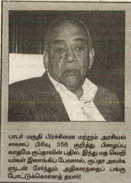
பாபர் மசூதி பிரச்சினை மற்றும் அரசியல் சாசனப் பிரிவு 356 குறித்து பிழைப்பு வாாதமே குப்தாவின் பதில். இந்து மத வெறியர்கள் இளைக்கிப் போனால், குப்தா அவர்கள் ஞான சேந்தம் அதிகாரத்தைப் பங்கு போட்டுக்கொள்ளத் தயார்

கே : அமைச்சராயிருப்பதால் வழமையாக உன்ன கட்டுப்பாடுகளினால் தங்களின்