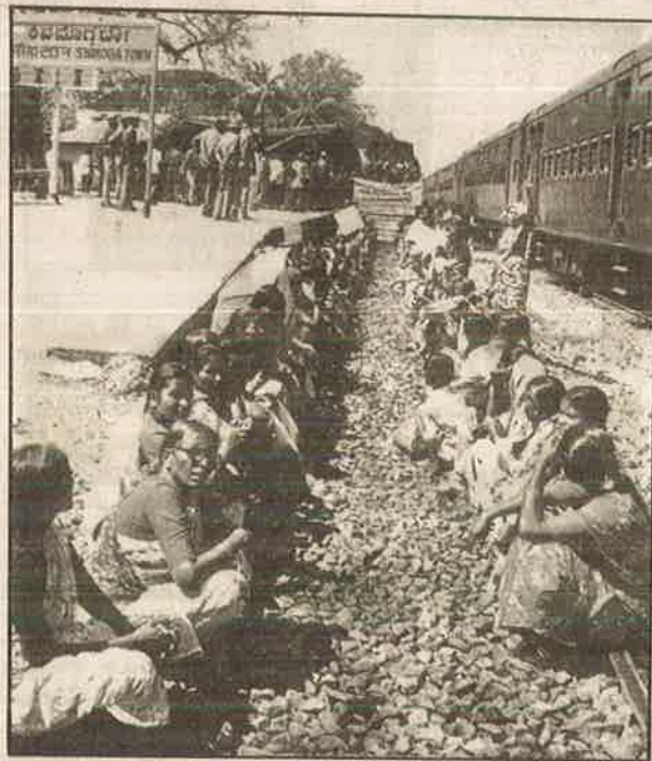
500 கோடியை ஏற்பம்விட்ட சத்துணவுக் கொள்ளையை எதிர்த்த ரயில் மறியல் போராட்டத்தில் சத்துணவு ஊழியர்கள்