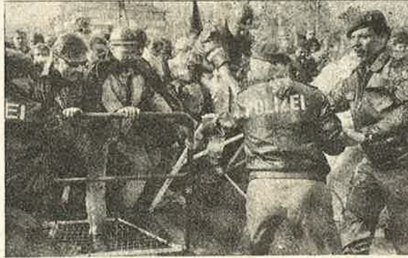
பான் நகரில் போலீசாரோடு மோதும் ஜெர்மன் சுரங்கத் தொழிலாளர்கள்.

ஜெர்மன் அரசு, ஐரோப்பிய ஒன்றிய ஒப்பந்தத்தின்படி தனது பட்ஜெட் பற்றாக்குறையை ஈடுகட்டுவதற்கு 60,000 நிலக்கரி சுரங்கத் தொழிலாளர்களை வேலையில் இருந்து துரத்திவிடத் தீர்மானித்துள்ளது. சுரங்கத் தொழிலாளர்களின் வயிற்றலடிப்பதன் மூலம் 10,500 கோடி ரூபாயை நிலக்கரி மானியமாக வழங்குவதை மிச்சப்படுத்தி விடலாம் என்பதுதான் ஜெர்மனி அரசின் நப்பாசை. தொழிலாளர்கள் பலிகடாவாக்கப்படுவதை