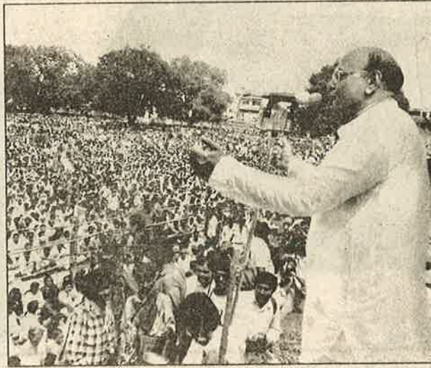
புதுக்கட்சி தொடங்கி பொதுக்கூட்டத்தில் உரையாற்றும் வகேலா

ராக்காமல், ஆர்.எஸ்.எஸ். — அத்வானி கும்பலின் விசுவாசியான சுரேஷ் மேத்தா முதல்வராக்கப்பட்டு கோஷ்டிப் பூசல் தற்காலிகமாக சமரசம் செய்து வைக்கப்பட்டது. இந்தச் சமரச ஒட்டு வேலையும் நீடிக்காமல், வாஜ்பாய் பிரதமராக இருந்தபோது, அவர் பங்கேற்ற பொதுக் கூட்டத்திலேயே வகேலா கோஷ்டியும் முதல்வர் மேத்தா கோஷ்டியும் பகிரங்கத் தெருச் சண்டையில் இறங்கின. இதையொட்டி கட்சி மேலிடம் மேத்தா கோஷ்டி மீது நடவடிக்கை எடுக்காமல் பூசி மெழுகி வந்ததால், தனது ஆதரவாளர்களைத் திரட்டி தனியாக மாநாடு - பேரணி நடத்த வகேலா கிளம்பினார். அதைத் தொடர்ந்து வகேலாவையும் அவருக்கு ஆதரவான எம்.எல்.ஏக்கள் மற்றும் 9 அமைச்சர்களையும் கட்சியிலிருந்து நீக்குவதாக பா.ஜ.க. தலைமை அறிவித்தது. ஆனாலும், கடந்த ஆகஸ்ட்-20-ந் தேதியன்று குஜராத்தில் மிகப் பெரிய பேரணியை நடத்திய வகேலா "ராஷ்டிரிய ஜனதா கட்சி" என்ற பெயரில் புதிய கட்சியைத் தொடங்கி பா.ஜ.க. முகத்தில் கரிபூசியுள்ளார். தனக்கு பெரும்பான்மை எம்.எல்.ஏக்களின் ஆதரவு இருப்ப