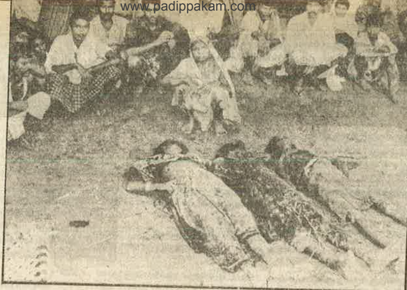
சூலி உயர்வு கேட்ட தாழ்த்தப்பட்டவர்களுக்கு 'சமூக நீதி' ஆட்சியில் கிடைத்தது மரணம்தான்

• கடந்த வருடம் ஜூன் மாதம் குஜராத் மாநிலத்தில் காதி எனும் ஊரைச் சேர்ந்த தாழ்த்தப்பட்டவர்களின் வீடுகள், கடைகள் இன்னும் பிர உடமைகளைத் தீயிட்டுக் கொளுத்தினர் படேல் மேல் சாதியினர். இத்தாக்குதலை தலைமை தாங்கி