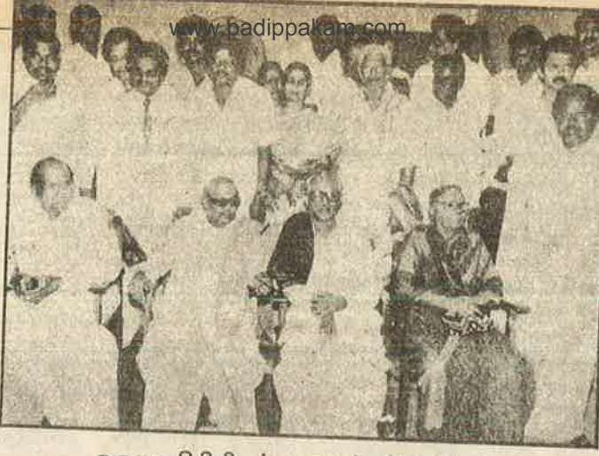
கருணாநிதியிடம் பாவமன்னிப்பு பெற்ற பெரியார் மாவட்ட அ.தி.மு.க.வினர்

எதுவரை போகும்? முன்னாள் ஆட்சியாளர்களின் கிரிமினல், பொருளாதாரக் குற்றங்களுக்கு உரிய தண்டனைகள் வழங்கப்பட்டு, அவர்கள் சூறையாடிய பொதுச் சொத்துக்கள் பறிமுதல் செய்யப்படுமா? அவர்கள் சிறைத்தண்டனை பெற்றாலும் அங்கு அவர்கள் சொகுசாக இல்லாவிட்டாலும் நிம்மதியாக வாழ வாய்ப்பளிக்கப்படுமா அல்லது உடலுழைப்பு உட்பட கடுந்தண்டனை நிறைவேற்றப்படுமா? இதுபோன்ற குற்றவாளிகள் தப்பவே முடியாது என்ற நீதி நிலைநாட்டப்படுமா அல்லது நீதித்துறை, சிறைத்துறை, போலீசின் அழகிய நிலையைப் பயன்படுத்திக் கொண்டு, இந்த ஊழல் பெருச்சாளிகள் தமது வளமான வாழ்வைத் தொடர்வார்களா? - என்பது போன்ற கேள்விகள், சந்தேகங்கள் ஆழமாகவே உள்ளன.