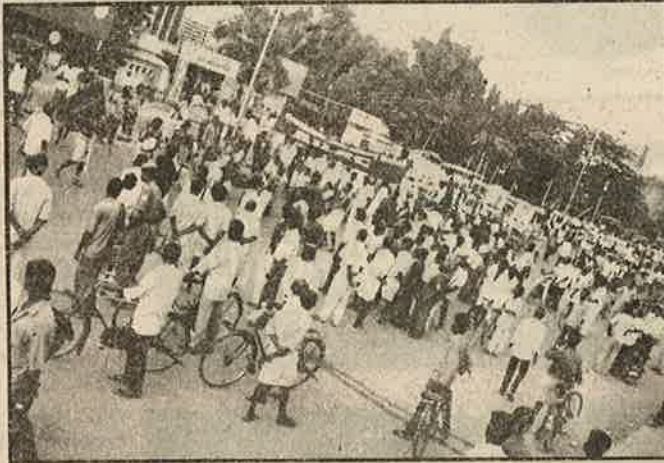
சென்னை பூண்ட்தொரு புரட்சிக் கோலம்

ஆந்திராவில் மக்கள் யுத்தக் குழுவின் மீது விதிக்கப்பட்டுள்ள தடையை நீக்கக் கோரியும், ஆபாச சிரழிவுகளைப் பரப்பும் செயற்கைக் கோள் தொலை