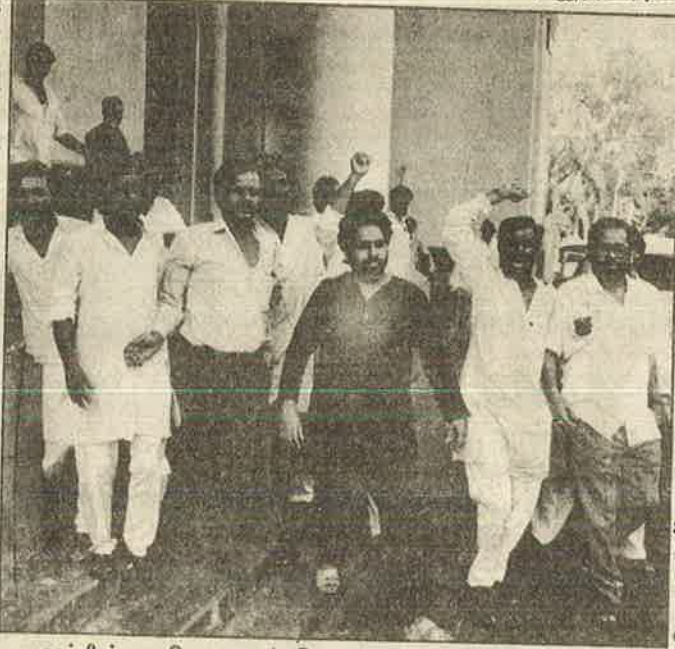
வக்ஃப் வாரிய ஊழல் மோசடியை எதிர்த்துச் சட்டமன்றத்தில் இருந்து காங்கிரசாரின் வெளிநடப்பு