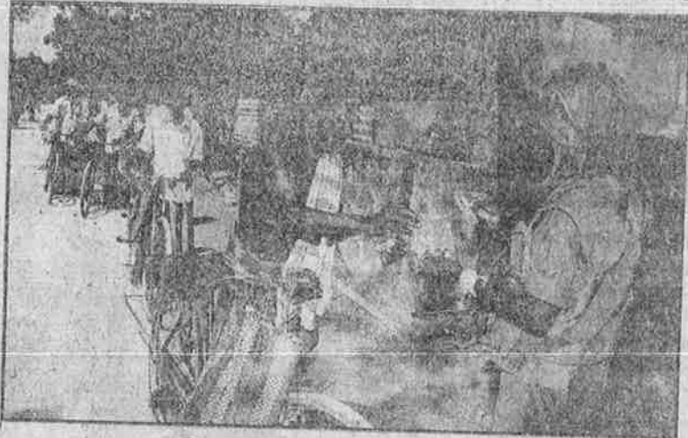
இராணுவக் கெடுபிடிசுளரல் புலிகள் வெளிப்படையாக இயங்க முடியவில்லை

"எதிரியின் தனிப்பட்ட நிலைகளைத் தாக்கி அழிப்பது (கொழும்பு பெட்ரோல் கிடங்கு); தனிநபர் பயங்கரவாதத்தைக் கட்டவிழ்த்துவிடுவது (கொழும்பு மந்திய வங்கி குண்டு வெடிப்பு); இராணுவ முகாம்களின் மீது திடீர் தாக்குதல் நடத்துவது (முல்லைத் தீவு) - இவை போன்ற கொடூரங்களின் மூலம் சிங்கள இராணுவத்தை முகாமுக்குள்