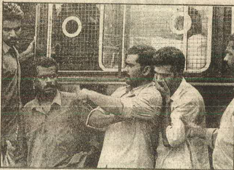
சூரியநெல்லிச் சிறுமியைப் பாலியல் பலாத்காரப்படுத்திய கயவர்கள்

மோகம்தான் காதல் என்ற தவறான கருத்துக்கு வந்து விடுவதும் இந்தத் தொடர் பாலியல் வன்முறைகளுக்கு ஒரு காரணம்" என்கிறார் சுகதருமாரி. இவர் ஒரு கவிஞரும் சமூக சேவகியுமாவார். சமீபத்தில் அமைக்கப்பட்ட பெண்கள் கமிசனின் தலைமைப் பொறுப்புக்கு இவர் நியமிக்கப்பட்டுள்ளார்.