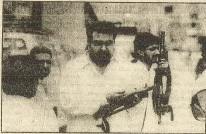
“ஆசாத்” காஷ்மீர் தேர்தலின்போது எதிர்க் கட்சி வேட்பாளர்களை மிரட்டும் ஆளும் கட்சி குண்டர்கள்

இதற்கிடையே ஆசாத் காஷ்மீர் உயர்நீதி மன்றம் கில்ஜித், பால்திஸ்