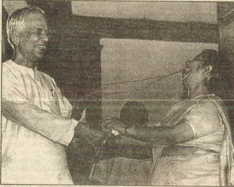
மக்களை முட்டாளாக்கிய மகிழ்ச்சிக் களிப்பில் வலது கம்யூ. அமைச்சர் சதுரணன் மிஸ்ராவும் பா.ஜ. எம்.பி. சுஷ்மா சுவராஜும்.

இப்போது அதே பெரும் முதலாளிகள், பெரும் வியாபாரிகள், பெரும் பண்ணையார்கள் கூட்டம் காமராஜரின் வாரிசாக மூப்பனாரையும் ரஜினியையும் முன்னிறுத்தி ஆட்சியைப் பிடிக்க எத்தனிக்கின்றது. தமிழ்நாட்டுப் பார்ப்பனப் பத்திரிக்கைகளோ, காமராஜரோடு இந்தி வெறியரும், குலக்கல்வி நாயகரும், கட்சி மாறிகளின் ஆட்சி அமைத்தவரும், அமெரிக்கத் தாசருமான இராஜாஜியையும் சேர்த்து காமராஜர் - ராஜாஜி துதிபாடி மூப்பனாரை ஆட்சிக்குக் கொண்டு வரப் பிரச்சாரம் செய்கின்றன. காங்கிரசு - பார்ப்பன கும்பலால் முன்னிறுத்தப்படும் மூப்பனாரின் கொள்கை - இலட்சியங்களில் மக்களால் நிராகரிக்கப் பட்டதலை உண்டா? இல்லை; அவர்கள் பீற்றிக் கொள்வது போல, மூப்பனாருக்கு நேர்மை - திறமை உண்டென்று காட்டுவதற்கு ஏதாவது ஆதாரம் அடிப்படை உண்டா? எதுவுமில்லை. அவசர நிலை ஆட்சிக் காலத்திலேயே காமராஜரின் கட்சியை இந்திராவிடம் விவையேசி விற்றவர்; அதன்பிறகு வந்த இந்திரா - சஞ்சீவ - ராஜீவ் என்ற நேரு பரம்பரைக்கும் நரசிம்மராவுக்கும் எிக்வாசியாக இருந்து அவர்களுடைய இலஞ்ச ஊழல், அதிகார முறைகேடுகள், அக்கிரமங்கள் எல்லாவற்றையும் ஆதரித்தவர். இந்தித் திணிப்பு, காஷ்மீர் நிப்பிரச்சினை, சமூத்த மிழர் பிரச்சினை உட்பட எந்த விவகாரத்திலும் தமிழக நலனுக்காகக் குரல் கொடுத்தவரில்லை. உண்மைதான் மூப்பனார் கட்சி ஒரு வேளை தேர்தலில் வென்றால் அது காமராஜர் ஆட்சியாகத் தான் இருக்கும்; ஆனால் அது நிச்சயம் தமிழர் நலனுக்கானதாக இருக்காது!