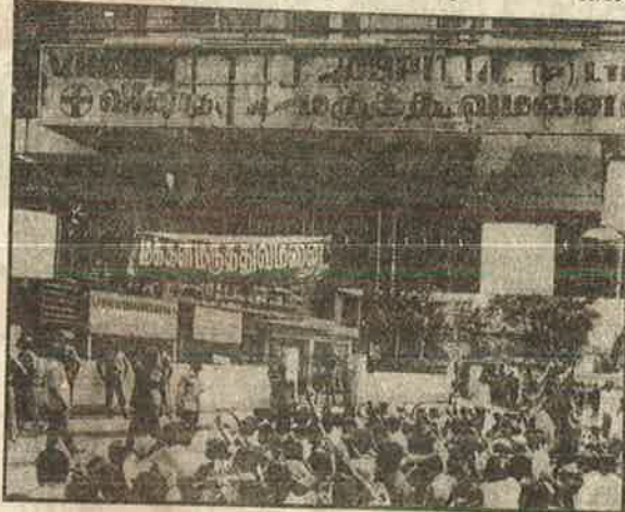
மருத்துவமனையைக் கைப்பற்றிய பின்னர் போலீஸின்தாக்குதலைக்கண்டித்து சாலை மறியல் வெளியிட்டது. அப்பத்திரிகை அலுவலகத்திற்கு நேராகச் சென்று, தோழர்கள் இவ்வதற்கு மறுப்பு செய்தி கொடுத்ததை, பிரசுரிக்காது இருட்டடிப்பு செய்தது, ஜூ.வி. "ஏவுகணை" என்ற மற்றொரு பத்திரிகை, "ம.க.இ.க. உள்ளூர் தி.மு.க. பிரமுகர் ஒருவரிடம் காசுவாங்கிக் கொண்டு, போராட்டத்தை நடத்துவதாக" தனது அபாரக் கண்டுபிடிப்பை வெளியிட்டிருந்தது.

இச்சிறு வெளியீடு அடுத்தடுத்து நான்கு பதிப்புகளில் 70,000 பிரதிகள் அச்சிடப்பட்டு விற்பனைக்கு கொண்டு செல்லப்பட்டன. இது ஒன்றே இப்போராட்டம் மக்கள் மத்தியில் எத்துணை ஆதரவைப் பெற்றிருந்தது என்பதற்கு சாட்சி. மேலும் சுவரெழுத்து, தெருமுனைப் பிரச்சாரம், பேருந்துப் பிரச்சாரம், பொதுக்கூட்