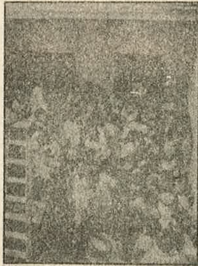
வாக்குச்சாவடியை ஆக்ரமித்த சி.பி.எம். குண்டர்கள்.

கவோ, அமைப்பாகவோ திரண்டு எதிர்க்காதிர்கள்! நீங்கள் செய்ய வேண்டியதெல்லாம் தேர்தல் வேலைகளைக் கவனிப்பதுதான்!" என்று உபதேசிக்கிறார்கள். திடீர்ப் பணக்கார அரசியல் ரௌடிகளுக்கு எதிரான நமது இயக்கத்தைக் கொச்சைப்படுத்தும் இதே சி.பி.எம். தலைவர்கள், தாம் நாற்காலிகளைப் பிடிப்பதற்காக கேரளத்திலும், மேற்கு வங்கத்திலும் ஆர்.எஸ்.எஸ்., காங்கிரசு குண்டர்களுக்கு எதிராகத் தேர்தல் ரௌடிகளைத் திறகு தனது கட்சிக் குண்டர்களை ஏவி விடத் தவறுவதில்லை. இதற்கான ஆதாரங்கள் நிறைவே உண்டு.