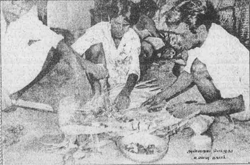
அவ்வாறு சிவமுகர் உணவு உயர்.

இதோ வாரியில் இருந்து இறக்கப்படும் இந்த நெல் மூட்டைகள் நான்கு மாவட்டம் உணவு அமைச்சரவை