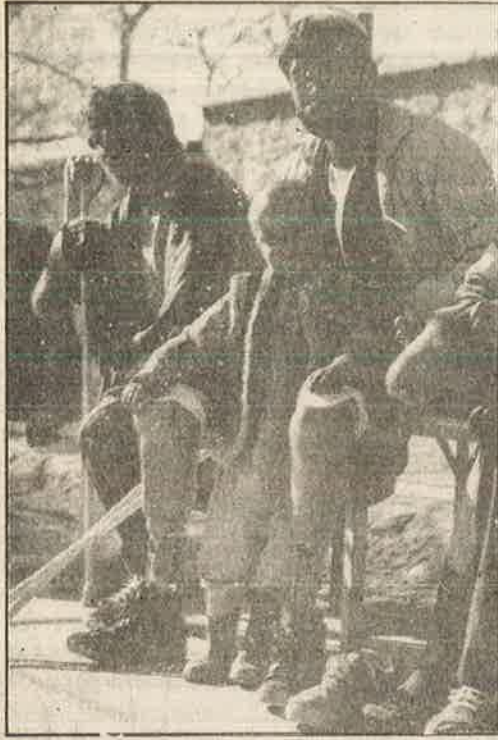
கண்ணி வெடிகளால் கால்களை இழந்து பரிதவிக்கும் ஆப்கான் மக்கள்

செய்திப் பதிவுகள் செய்திப் பதிவுகள் செய்திப் பதிவுகள் செய்திப் பதிவுகள் செய்திப் பதிவுகள் செய்திப் பதிவுகள் செய்திப் பதிவுகள்