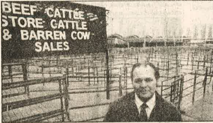
நோய் தாக்கிய பசுக்களைக் கொன்ற பின்னர் வெறிச்சோடி கிடக்கும் கால்நடைப் பண்ணை

மேலை நாடுகளில் கால்நடை வளர்ப்புத் தொழில்