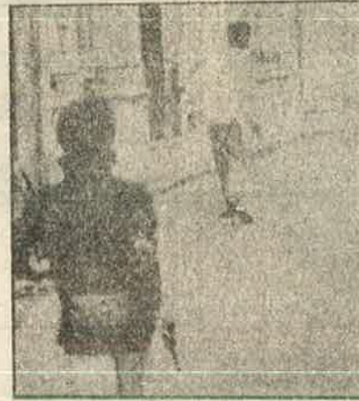
தேர்தல் நாளன்று ஆயுதங்களுடன் அலையும் சி.பி.எம். குண்டர்கள்.

பொதுவில் சமூக விரோதிகளும் - ரௌடிகள், குண்டர்கள், அடியாட்கள், அவர்களின் கிரிமினல் குற்றங்களும் சமுதாய, பொருளாதார காரணங்களால் உருவானாலும் குறிப்பாக, அரசியல் கிரிமினல்மயமாவதற்கான அடிப்படை - சட்டமன்ற, நாடாளுமன்ற ஜனநாயகம் எனப்படும் ஒட்டுச் சீட்டு அரசியலில் உள்ளது. அரசியல் கட்சிகளை நடத்துவது, நிதி வசூலிப்பது, தேர்தல் தில்லுமுல்லுகள், அராஜகம், வன்முறை மற்றும் நாடாளுமன்ற, சட்டமன்ற - ரௌடித்தன்மை ஆகிய நடவடிக்கைகளில் கைதேர்ந்த கிரிமினல் அரசியல்வாதிகளை ஒட்டுச் சீட்டு அரசியல்தான் பெற்றெடுத்தது. காந்தியம், கம்யூனிச சோசலிசம், ஜனநாயக சோசலிசம், இந்து ராஷ்டிர