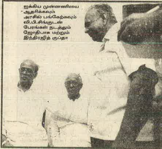
ஐக்கிய முன்னணியை ஆதரிக்கவும் அரசில் பங்கேற்கவும் வி.பி.சிங்குடன் பேரங்கள் நடத்தும் ஜோதிபாக மற்றும் இந்திரஜித் குப்தா

புரட்சியின் கோட்டையாகச் சித்தரிக்கப்பட்ட மே. வங்கத்திலேயே தொழிலாளர்கள் நிறைந்த பகுதியில் இம்முறை போலிகள் படுதோல்வி அடைந்துள்ளனர். வெற்றி பெற்ற தொகுதிகளில் கூட வாக்குகள் முன்னைவிடக் குறைந்துவிட்டன. கோளத்தில் 'மார்க்சிஸ்டு' கட்சியின் முக்கிய தலைவரான அச்சுதானந்தன் படுதோல்வி அடைந்துள்ளார். அங்கு 'இடது முன்னணி' வெற்றி பெற்ற போதிலும் கட்சிக்குள் முதல்வர் பதவிக்கான நாய்ச்சண்டை முற்றியதால், 10 நாட்களுக்கு மேலாகியும் ஆட்சியமைக்க முடியவில்லை. பின்னர் சமரசங்கள், சரிகட்டல்களுக்குப் பிறகு நாயனார் முதல்வராகியுள்ளார்.