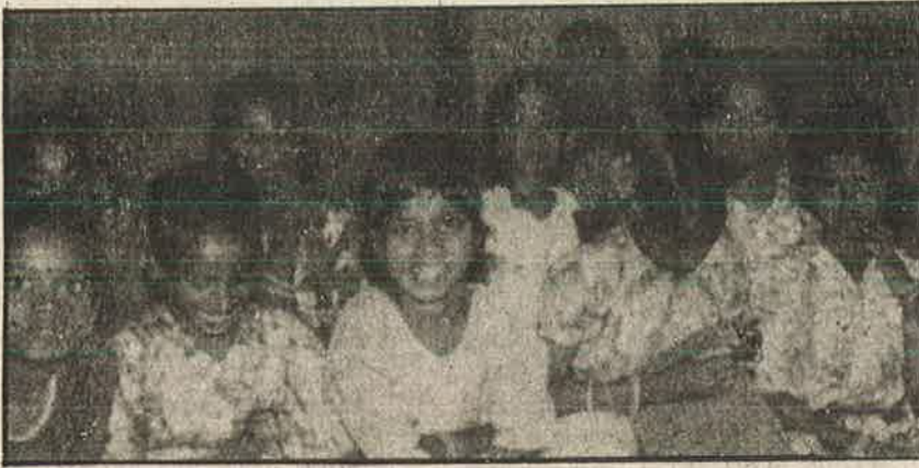
மீட்கப்பட்ட சிறுமிகள்: கேள்விக் குறியான எதிர்காலம்

டிமை கண்காணிப்பு கமிட்டிகள்; இப்படிப்பட்ட பிரச்சினைகளே (கொத்தடிமை) இல்லாதபொழுது, இவை போன்ற கமிட்டிகள் தேவையற்றவை; மேலும் இப்பிரச்சினை உண்மையிலேயே முதலாளிக்கும் தொழிலாளிக்கும் இடையிலான உள் விவகாரமாகும். கணவன் - மனைவிக்கு இடையே ஏற்படும் பிணக்குகளைப்போல இதனைக் கையாள வேண்டும்" எனக் கொச்சைப்படுத்திக் கருத்துக் கூறியுள்ளார்.