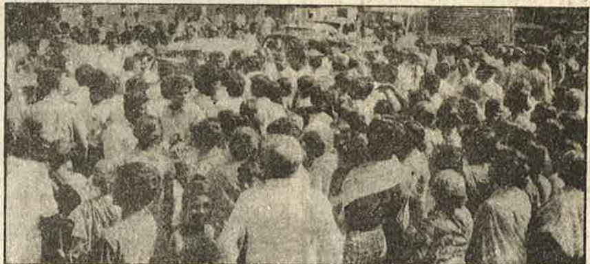
தமிழக அமைச்சர்களைக் கேள்விகளால் திணறடிக்கும் தூத்துக்குடி நகர மக்கள்