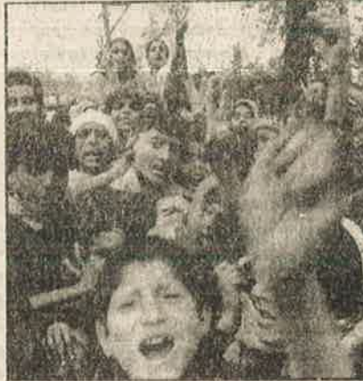
சோழூரில் தேர்தலை எதிர்த்து ஆர்ப்பாட்டம் செய்யும் சிறுவர்கள்

மேலும் "எங்கள் ஒட்டுக்களைப் பெற்று இங்கு அமைதியைக் கொண்டு வந்துவிடலாம் என அரசாங்கம் நினைக்கலாம். ஆனால் நாங்கள் கேட்பது எங்களுக்கு சுதந்திரம் ஒன்றைத்தான்" என்று கூறினார். அவருடனிடம்