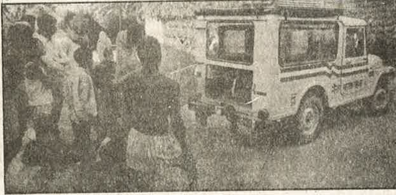
காங்கிரசு கட்சியின் வீடியோ வாகனப் பிரச்சாரம்

வீடியோ திரைப்படங்கள் மட்டுமின்றி, பல்வேறு பாடல் ஒலிப்பேழைகளைக் கொண்டு காங்கிரசுப் பெருச்சாளிகள் கிராமப்புறங்களில் பிரச்சாரம் செய்தனர். ஜி. டி.வி. தொடரில் வரும் ஒரு பிரபலமான பாடல் மெட்டில், பாபர்ம குதி இடிப்புக்குப் பின் இந்து - முஸ்லிம்