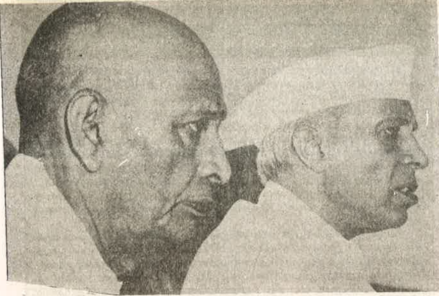
படேல் - நேரு கோஷ்டிச் சண்டையில் நேருவின் ஊழல்கள் அம்பலமாயின

சண்டைகளுக்காகக் கோடாகப் பயன்படுத்தப்பட்டது. அதற்கான ஆதாரங்களும் உள்ளன.