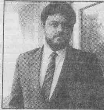
ஹிமாஞ்ச ரத்: தேர்தல் முழக்க வியாபாரி

துத் தருவதுதான் இவரது தொழில்! உயர் தொழில் நுட்பங்களைக் கொண்ட இவரது அலுவலகத்தில் 10,000 ஜனரஞ்சக முழக்கங்களும், 3000 தேர்தல் பிரச்சார உரைகளும் "தயார் நிலையில்" உள்ளன. கட்சி வேட்பாளர்கள் தமக்குத் தேவையானதைத் தேர்ந்தெடுத்துக்