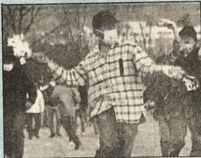
வீரப்போரில் தென்கொரிய மாணவர்கள்

தமது சொத்துக்களை ரொக்கப் பணமாக மாற்றி வைத்துக் கொள்ளலாம் என அரசு அறிவித்த பின் கைமாரிய பண மதிப்பு 1993-ஆம் ஆண்டில் 1000 கோடி டாலர். 1994-ஆம் ஆண்டில் இது 1600 கோடி டாலரானது. 95