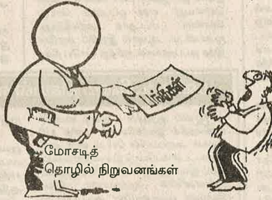
மோசடித் தொழில் நிறுவனங்கள்

மதுரை வங்கி, கராட் வங்கி, நெடுங் காடி வங்கி, பம்பாய் பெருநகர் கூட்டு