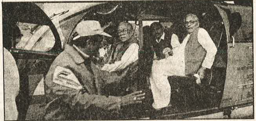
போலிக் கம்யூனிஸ்டு முதல்வர் ஜோதிபாக்: வறுமையை ஒழிக்க ஹெலிகாப்டர் பயணம்.