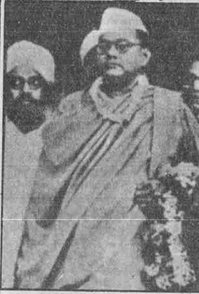
நேதாஜியின் பணபலம் வங்க முதலாளிகளிடம் இருந்து வந்தது

"சட்டப் பேரவை சம்பந்தப்பட்ட ஊழல்கள் தனது கவனத்துக்கு வரும் போதெல்லாம் மேதகு வைஸ்ராய்க்கு விட்டன் பிரபு தெரிவித்துள்ளார். அவை: 1. மந்திரிகளின் சம்பளத் தீர்மானத்துக்கு எதிராக ஒட்டுப் போடுவதில் இருந்து ஒதுங்கி இருப்பதற்காக சட்டப் பேரவையின் முகமதிய உறுப்பினர்களுக்கு இலஞ்சம் தர முன் வந்தது. 2. அதன்படி சுயராஜ்ஜியக் கட்சிக்கு ஆதரவாக ஒட்டுப்போட்ட சட்டப் பேரவை உறுப்பினர்