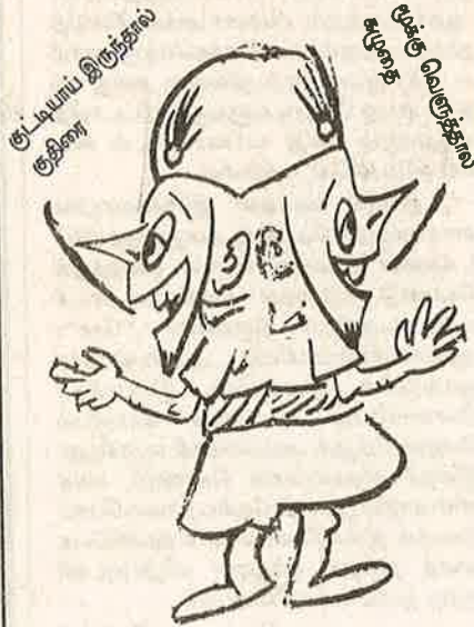
குட்டியாய் இருந்தால் குதினை

இதற்கு முன்பு, திருச்சியில் நடந்த தி.மு.க. மாநாட்டில் அக்கட்சித் தலைவர் கருணாநிதி, காஷ்மீரைப் போல மற்ற மாநிலங்களுக்கும் சுயாட்சி உரிமை அளிக்க வேண்டும் என்று பேசியதை எதிர்த்து, "ஐயோ மீண்டும் பிரிவினை வாதம்! யாழ்ப்பாணத்தின் கதிதான் தமிழகத்துக்கு ஏற்படும்!" என்று துள்ளக் இதழில் (7.2.96) அட்டைப் படத்தோடு தலையங்கம் தீட்டி, அவரினார், இப்போது தி.மு.க. - மூப்பனார் காங்கிரசு கூட்டணி ஏற்பட்டதும் அது பற்றி அவர் வாயே திறக்கவில்லை. திருவாளர் "சோ"-வின் கொள்கைப்படி, "பிரிவினைவாதக் கட்சியான தி.மு.க.வுடன் 'தேசிய'க் கட்சியான காங்கிரசு கூட்டுச் சேர்வது எப்படி நியாயமாகும்? தனது கொள்கைக்கே எதிரான கூட்டணியை