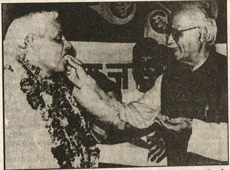
பாசிச ஆட்சிக்கு பாதை போட பாரதீய ஜனதா கொண்டாட்டம்

மொழி, பிராந்திய ரீதியில் பன்முகப்பட்ட அமைப்பும் ஏற்றதாழ்வான வளர்ச்சியும் அதன் பிரதிபலிப்பாக நாடாளுமன்ற தொங்கு நிலையும் ஆளும் வர்க்கங்களுக்கு சமூகரீதியிலும் அரசியல் ரீதியிலும் தீவிர தலைவலியை உருவாக்கி இருக்கிறது. இவை பொருளாதாரத் துறையிலும் ஒரு நிலையற்ற போக்கையும் நெருக்கடியையும் ஏற்படுத்துகிறது.