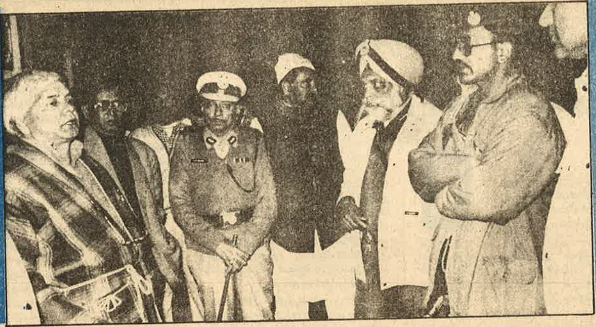
தாக்குதலின் பின் நக்சல்பாரிகளைக் கொன்றொழிக்க அரசு இயந்திரம் நடத்தும் சதி ஆலோசனை