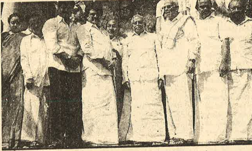
எம்.ஜி.ஆர். முன்னணி: உதிர்ந்த ரோமங்கள் இணைந்த சவரி முடி