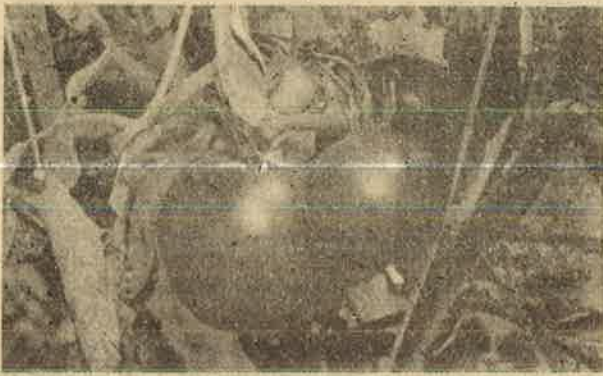
உயிரியல் கூறுகளை மாற்றி அமெரிக்கா உரிமை கொண்டாடும் தக்காளிகள்

1992-ம் ஆண்டில் பிரேசில் நாட்டுத்தலைநகரில் நடந்த சர்வதேச சுற்றுச்சூழல் பாதுகாப்பு மாநாட்டில், "மரபியற் கூறு மாற்றம் பெற்ற உயிரிகள்" (Genetically Modified Organism) என்பதற்குப் பதிலாக "வழக்கிலுள்ள திரிந்த உயிரிகள்" (Living Modified Organism) என்ற பதத்தை பயன்படுத்த வேண்டும் என அமெரிக்கா நிர்வகித்தது. இதன் மூலம், "மரபியல் கூறு விஞ்ஞான அடிப்படையில் உருவாக்கப்பட்ட உயிரினங்களுக்கும், இயற்கையாகப் பரிணமித்த உயிரினங்களுக்கும் எவ்வித வேறுபாடும் கிடையாது; இதனால் இச்செயற்கை உயிரிகளை வர்த்தக ரீதியாகப் பயன்படுத்துவதற்கு எவ்விதச் சுற்றுச்சூழல் பாதுகாப்பு விதிகளையும் உருவாக்கத் தேவை