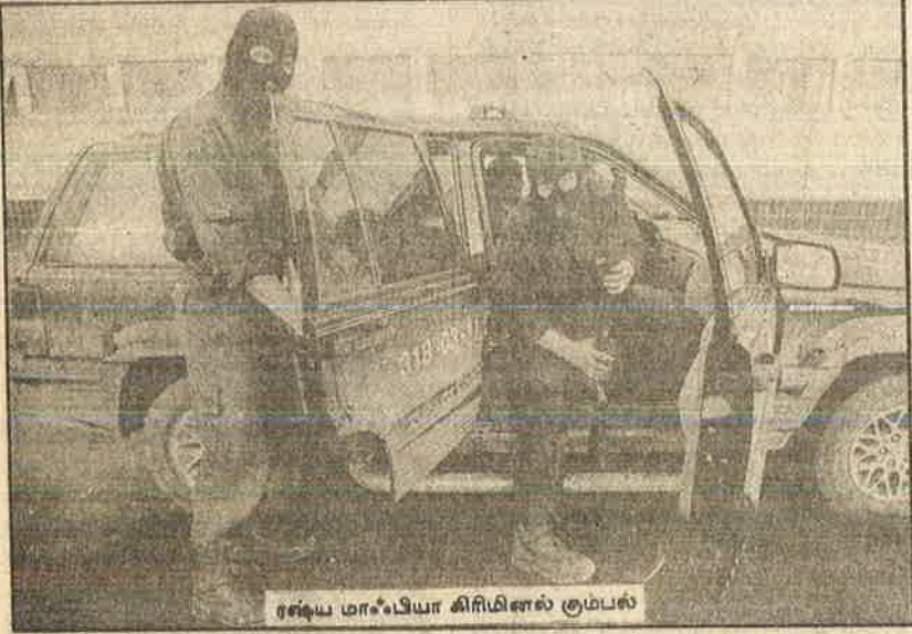
ரஷ்ய மாஃபியா கிரிமினல் கும்பல்

அவை அவையாக மேற்கு நோக்கி ஓடி வருவார்கள் என்று யாருமே எதிர்பார்க்கவில்லை" என்கிறது அந்த ஏடு. ஜெர்மனியில் உள்ள 2,00,000 விப்சாரிகளில் 40,000 பேர் கிழக்கில் இருந்து வந்தவர்கள். 14 நாள் "விசா" பெற்றுக் கொண்டு வாரந்தோறும் விமானம் நிறைய துபாய் வந்திறங்கும் ருசியப் பெண்கள் விப்சாரத் தொழில் செய்து விட்டு வண்ண வானொளி போன்ற நுகர்பொருட்களோடு நாடு திரும்புகின்றனர். பாலுறவுக் காட்சிகள் நடத்தும் மேற்கத்திய நகர இரவு விடுதிகளில் முன்பு ஒரு சதவீதமே கிழக்கு ஐரோப்பியப் பெண்கள் இருந்தனர். முன்றாண்டுகளில் அவர்களே 50 சதவீதத்தினராகப் பெருகினர்.