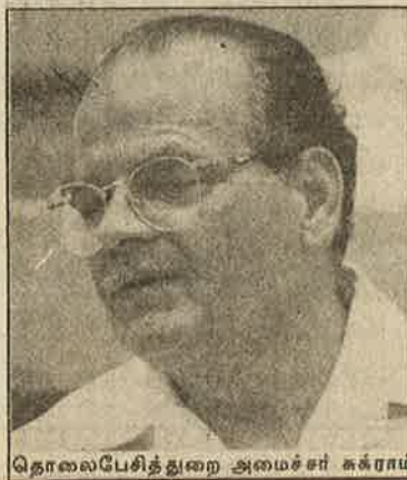
தொலைபேசித் துறை அமைச்சர் சுக்ராம்