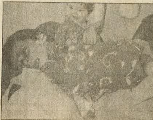
மரணப் படுக்கையில் ஈராக்கிய குழந்தை

ஈழத்தின் மீது சந்திரிகா அரசு பொருளாதாரத் தடையுத்தரவை விதித்து நடைமுறைப்படுத்தி வருகிறது. இதன் காரணமாக ஈழ மக்களுக்கும் போராளிகளுக்கும் உணவு மற்றும் பெட்ரோல், டீசல் போன்ற எரிபொருட்களும் கிடைப்பதில்லை. தமிழின உணர்வு கொண்ட மீனவர்கள் சிலர் இந்த எரிபொருட்களையும், பவவகை மருந்துப் பொருட்களையும் கடல் வழியே எடுத்துச் சென்று உதவி வருகின்றனர். சந்திரிகா அரசுக்கு மறைமுகமாக உதவும் நோக்கத்தோடு, இந்தப் பொருட்களை ஈழத்திற்கு எடுத்துச் செல்வதைத் தடுப்பதற்காக இராமநாதபுரம் கடல் பகுதியில் மிதவை சோதனைச் சாவடியை அமைக்கவுள்ளது, இந்தியக் கடற்படை.