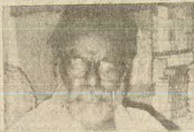
எது தொழில் முன்னெற்றத்தில் கலனம் செலுத்த வேண்டும்.

☆ 40 வருடங்களுக்கு முன் ரெட்டியார் பட்டி பள்ளிக்கூடத்தில் கையேந்தி தண்ணீர் குடித்த நானும், என் சமூகமும் முன்னேறக் காரணம் பெறுமை. தேவர்களுள், பள்ளர்களும் மோதலைக் கையிட்டு, அவர்க