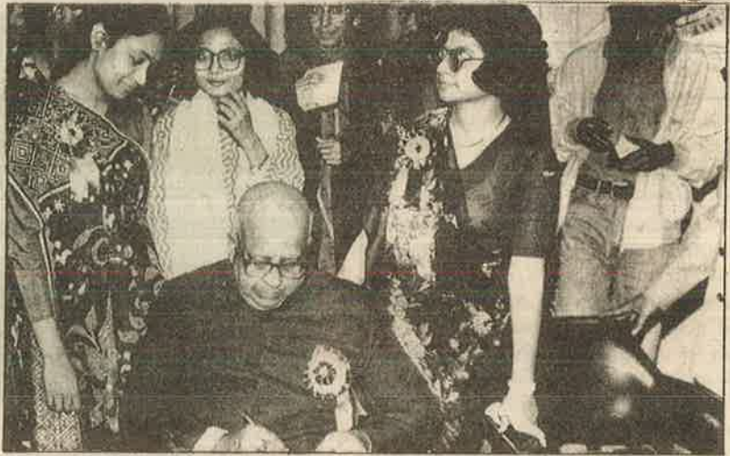
சேஷனிடம் கையெழுத்து வாங்கும் ரசிகைகள்

அதேபோல ஒருமுறை அலுவலகத்திற்குள்ளே நுழைந்த சேஷன், ஒரு பெண் ஊழியர் தனது இரு உறவினர்களுடன்