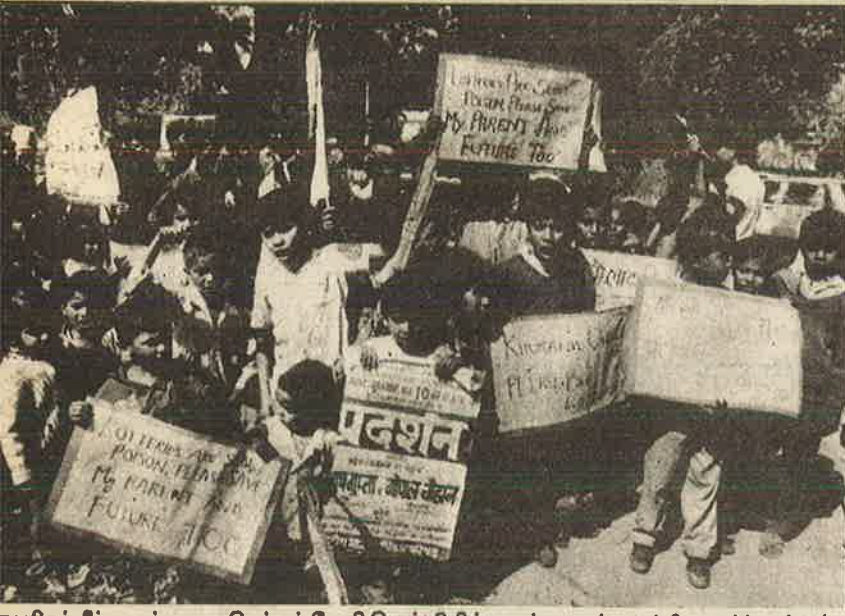
பரிசுச் சீட்டைத் தடை செய்யக் கோரி டெல்லியில் குழந்தைகள் நடத்திய ஆர்ப்பாட்டம்