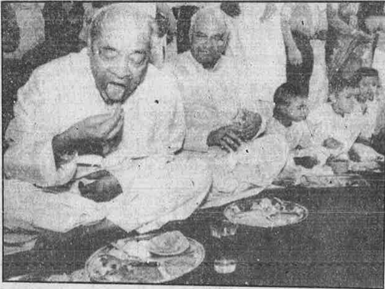
கவர்ச்சித் திட்டங்களைத் தொடங்கி "போஸ்" கொடுக்கிறார் ராவ், மன்மோகன் சிங்கோ "நிதியில்லை" எனக் கை விரிக்கிறார்.

மக்களின் வாங்கும் சக்தி குறைந்து விட்டதாக நீலிக் கண்ணீர் வடித்த மைய அரசு, மறுபுறம் அத்தியாவசிய உணவுப் பண்டங்களின் விலையை உயர்த்தி மக்களைப் பட்டினி படுகுழிக்குள் தள்ளி வருகிறது. கடந்த நாட்காண்டுகளில் பொது விநியோகத் திட்டத்தின் கீழ் வழங்கப் பட்டு வந்த அரிசி கிலோ ஒன்றுக்கு ரூ. 5.37 ஆகவும், கோதுமை ரூ. 4.32 ஆகவும் விலை உயர்ந்துள்ளன. இவ்விலை உயர்வு காரணமாகப் பொது விநியோகத் திட்டத்திற்கும் வெளிச்சந்தைக்கும் இடையே இருந்து வந்த இடைவெளி இவ்வாறு ஒழிக்கப்பட்டது. அதேபொழுதில் ஒட்டுப் பொறுக்குவதற்காக அறிவிக்கப்பட்ட சீரமைக்கப்பட்ட பொது விநியோகத் திட்டமும், ஆந்திர மலிவு விலை அரிசி திட்டமும் வர்த்தகச் சூதாடிகளின் - ஊழல் அதிகாரிகளின் கூட்டுக் கொள்கைக்குத்தான் வழியேற்படுத்தித் தந்துள்ளது.