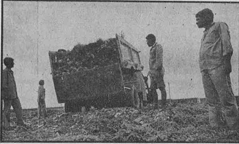
குப்பை அகற்றுவதும் தனியாருக்கு துப்புறவு தொழிலாளர்கள் வேலைக்கு ஆபத்து.

மக்களிடம் ஏராளமான வரிகள் மூலமும் அதை வருடந்தோறும் கூட்டுவதன் மூலமும், தனியாருக்கு விட்டு கொள்ளையடிப்பது மூலமும் மாநகராட்சி பெறும் வருமானம் கணிசமான அளவிற்கு அதிகாரவர்க்கத்திற்கே விரயமாகிறது. ஆனால் தொழிலாளர்கள் மீது பழி போடுவதுதான் நடக்கிறது. தனியாருக்கு விடாமல் மேற்கண்ட பணிகளை நகராட்சியே செய்தால் புதிய தொழிலாளர்களுக்கு ஊதியம், ப்ரெசுப்படி இதர சலுகைகள் கொடுக்க வேண்டி வந்து அதிகம் செலவாகிறது என்கிறார்கள். தனியாருக்கு விட்டதன் மூலம் பம்பாய் மாநகராட்சி 43% செலவை மிச்சப்படுத்தியுள்ளதாம். சென்னை மாநகராட்சி மொத்த செலவில் 40 சதவிகிதம் சேமிக்கிறதாம்.