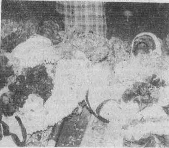
சென்னை துப்பாக்கிச் சூட்டில் பலியான தாழ்த்தப்பட்டவர்கள்.

மேல்சாதி வெறியர்கள் இத்தகைய அதிகார வர்க்க - ஆளும் கும்பல் உதவியுடன் தொடுக்கும் தாக்குதலிலிருந்து தாழ்த்தப்பட்ட மக்களைப் பாதுகாக்க அவர்களின் பிரதிநிதிகளால் முடியவில்லை. தாழ்த்தப்பட்ட சாதி சங்கத்