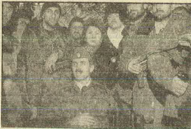
குரோஸ்னியில் பத்திரிகையாளர்களுக்கு சகாக்களுடன் பேட்டியளிக்கும் செசன்யா தலைவர் துதாயேவ்.