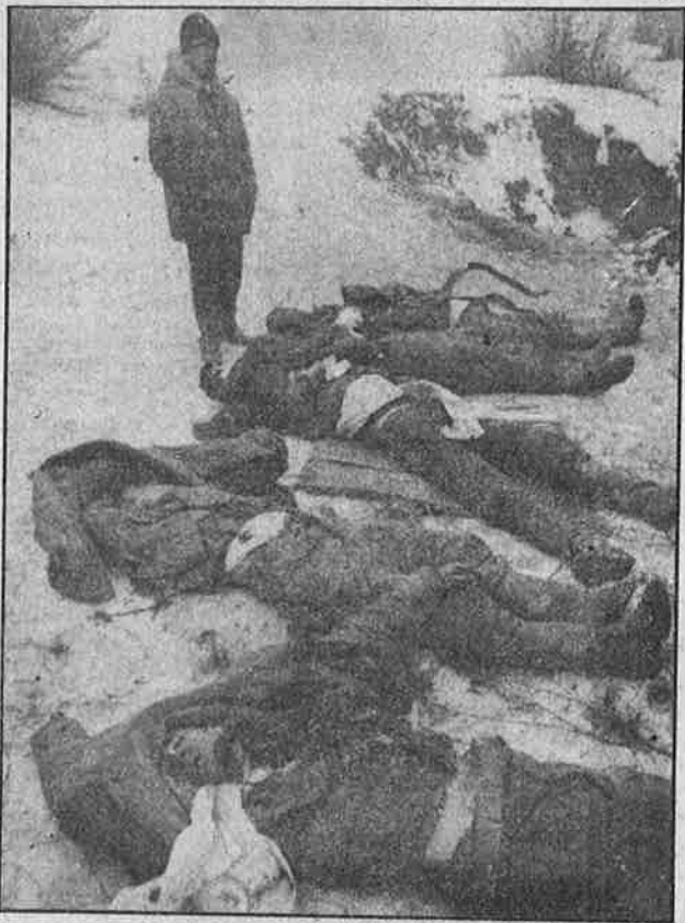
தமது ஈணுப்ப படையினர் சடலத்தை வானொளியில் பார்த்த ருசிய மக்கள் வெறுப்பும் ஆத்திரமடைந்தனர்.

ஆக, முன்னாள் சோசலிச நாடுகளில் அரசியல் ரீதியில் கம்யூனிசத்தை வீழ்த்த தேசியத்தையும், ஜனநாயகத்தையும் நிலைநாட்டப் போவதாக ஏகாதிபத்தியங்களும் அவற்றின் உள்நாட்டு பங்காளிகளும் அடித்த சவடால்கள் எல்லாம் வேறு மாதிரிதான் முடிந்துள்ளது. அங்கெல்லாம் தூக்கியெறியப்பட்ட போலிக் கம்யூனிஸ்டுகளும், கிரிமினல் மஃபியா கும்பல்களும் தான் அதிகாரத்தைக் கூறுபோட்டுக் கொண்டுள்ளனர். ருமேனியா, பல்சேனியா, அல்பேனியா, போலந்து என்று கிழக்கு ஐரோப்பிய மற்றும் யுரேசிய நாடுகளின் கதையும் இதுதான். பொருளாதார ரீதியில் கூட ஒழுங்கமைக்கப்பட்ட கூட்டுப்பங்கு தொழில்