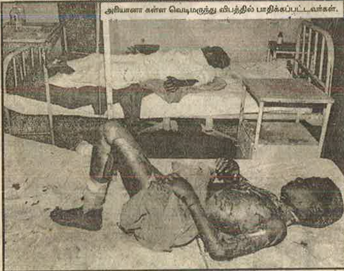
அரியானா உள்ள வெடிமருந்து விபத்தில் பாதிக்கப்பட்டவர்கள்.

மதவெறியைக் கிளறிவிட்டு தேச ஒற்றுமையைச் சாதிக்கக் கிளம்பியுள்ள இந்துவெறி பாசிஸ்டுகளைப் போலவே, ரஷியாவின் பாசிச எதிர்க்கட்சித் தலைவரான ஜிரினோவ்ஸ்கி, சாராயத்தின் மூலம் தேச ஒற்றுமையைக் கட்ட கிளம்பியுள்ளார். ரஷியாவின் வோட்கா சாராய ஆலையைக் கைப்பற்றியுள்ள இவர், சாராய புட்டிகளில் தனது பெயரையும் உருவத்தையும் பொறித்து, வரும் டிசம்பரில் நடைபெறவுள்ள தேர்தலைக் குறிவைத்து "தேச ஒற்றுமையின் சின்னம்" என்ற அடைமொழியுடன் நாளொன்றக்கு 5 லட்சம் புட்டிகளுக்கும் மேலாக இச்சாராயத்தை மலிவு விலையில் விற்பனை செய்து வருகிறார். மதம், இனம், பால், வயது வேறுபாடுகளைக் கடந்து 'குடி'மக்களை ஒன்றிணைப்பது வோட்காதான் என்று பெருமையோடு கூறுகிறார் இப் பாசிசத் தலைவர். எப்படியிருக்கிறது, பாசிசத் தலைவரின் சாராய தேசியம்?