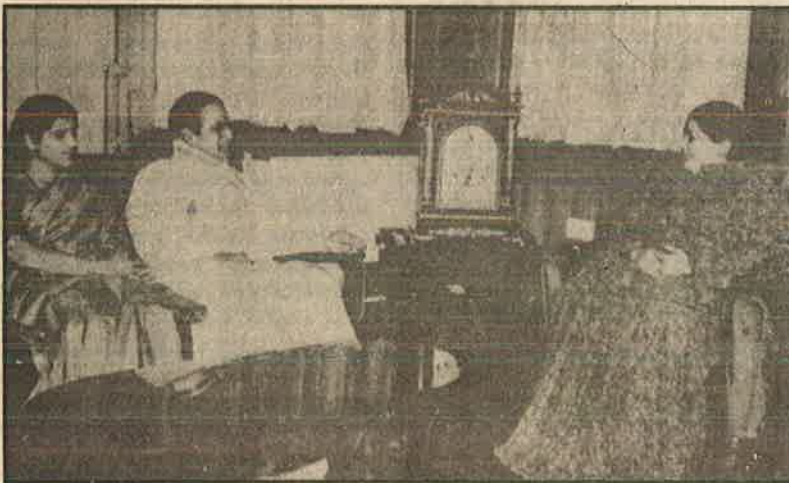
ஜெயாவிடம் கூட்டணிக்கான பேச்சுவார்த்தை நடத்தும் என்.டி.ஆர்.

இதேபோல், வகுப்புவாத எதிர்ப்பு - மதச்சார்பின்மை என்பது தேசிய முன்னணியின் முக்கிய கொள்கை. பாசிச ஜெயாலலிதாவோ, டெல்லியில் நடந்த அனைத்துக் கட்சி கூட்டத்தில் இந்துவெறியர்கள் அயோத்தியில் கரசேவை நடத்த வெளிப்படையாக ஆதரித்தவர். மருதியை இடித்த இந்துவெறியர்களின் கடப்பாறை சேவைக்கு தமது கட்சிக் குண்