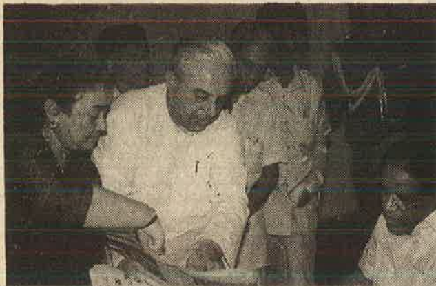
சந்திரலேகா, சாமி, சென்னை, - 'ஜெ'. எதிர்ப்பணி

சுப்ரமணிய சாமியின் அரசியல் வாழ்க்கை, ஜெயலலிதாவினுடையதைப் போலவே, இரகசிய - மர்மங்களும், சதி - சூழ்ச்சிகளும், கேடான குறுக்கு வழிகளும் நிறைந்தவைதாம். மக்கள்