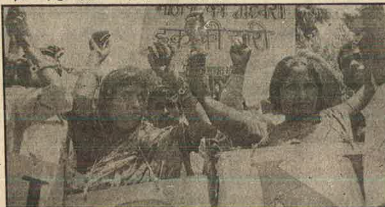
தடாவிற்கு மாற்றில்லாத புதிய சட்டத்திற்கு எதிராக டில்லியில் போராட்டம்

குற்றம் சாட்டப்பட்டவர்தான் தன்னை நிரப்பாதி என்று நிரூபிக்க வேண்டும் என்பதிலே போலீசு நரப்பிலுள்ள ரகசிய சாட்சிகள் பற்றிய விதிகளே எந்த மாற்றமும் செய்யப்படவில்லை. இதில் ஒரு அயோக்கியத்தனமான சிறிய மாற்றம் மட்டுமே செய்திருக்கிறார்கள். தடாவில் குற்றவாளிக்கு எதிரான போலீசு சாட்சிகளை நீதிமன்றத்தில் கொண்டு வருவதற்கோ, அவரைப் பற்றிய பெயர், முகவரி, அடையாளம், குறிப்புகளை வெளியிடுவதற்கோ அவசியமில்லை. ஆனால் புதிய சட்டத்திலே இச்சாட்சிகளுக்கு எவ்வித ஆபத்தும் குற்றவாளியால் வராது என போலீசு ஒத்துக்கொண்டால் மட்டுமே நீதிமன்றத்தில் கொண்டு வரவும் அவரை குறுக்கு விசாரணை செய்யவும் அனுமதி உண்டு.