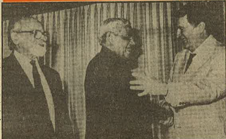
ஜிரி நோவ்ஸ்கியை வரவேற்று விருந்தளிக்கும் வாஜ்பாய்

அண்டை நாடுகளான பாசிஸ்தான், வங்க தேசம் ஆகியவற்றின் சுதந்திரத்தையும் இறையாண்மையையும் கேள்விக்குள்ளாக்கிய அவரது மேலாதிக்க வெறியை எதிர்க்கவுமில்லை. தமது பாசிசப் பங்காளி என்பதால் மௌனம் சாதிப்பதன் மூலம் இவற்றை நியாயப்படுத்துகின்றனர். உலகெங்கும் அம்பலப்பட்டு வரும் பாசிசப் பைத்தியக்காரனுக்கு தமது கோவணத்தை அவிழ்த்து தலைப்பாகை கட்டி கௌரவிக்கும் இந்தியப் பாசிஸ்டுகள் அம்மனமாகி நிற்கின்றனர்.