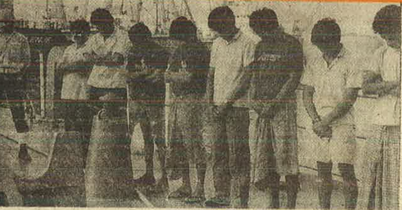
இந்திய அரசு அத்துமீறி சென்று கப்பலை தாக்கிப் பிடித்த விடுதலைப் புலிகள்

பத்திரிகைகள், பார்ப்பன - பாசில்குடிகள், அறிவுஜீவி துறையினர் எல்லோரும் சிறை நிர்வாக முறைகேடுகள் - ஊழல்களை மையப்படுத்தி குற்றம் சுமத்தினர். ஆட்டோசங்கர் தப்பித்தபின் ஆய்வு செய்த இஸ்மாயில் அறிக்கை சுட்டிக்காட்டிய சிறை சீர்திருத்த நடவடிக்கைகள் அமுலாக்கப்படாததுதான் குற்றம் என்றனர். கைதிகளுக்கு சிறையில் உள்ள சலுகைகளையும் சிறை அதிகாரிகள் - காவலர்களின் ஊழல்களால் நடந்த/நடக்கும் முறைகேடுகளையும் பட்டியல் போட்டுக் காட்டினர். இவைகளை கண்டு