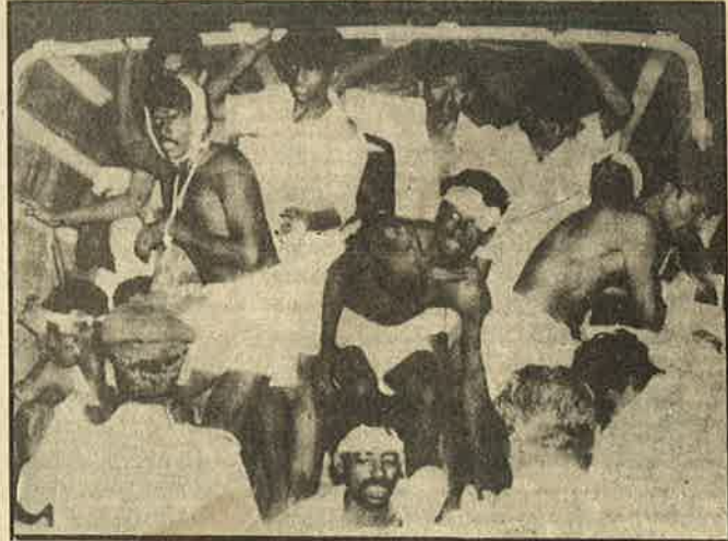
மதுரை சிறைக் கைதிகள்; போலீசின் காட்டுமிராண்டித்தனம்

கிரிமினல் கைதிகள் கஞ்சா, அபின், பீடி, சிகரெட் என இருந்த உல்லாசமான வாழ்க்கைக்கு பாதிப்பு வந்ததாலேயே பிற கைதிகளையும் தூண்டிவிட்டு ரகளை செய்வதாகக் கூறி தமது பாசிச ஒடுக்கு முறையை சிறை நிர்வாகமும் ஜெயா கும்பலும் நியாயப்படுத்த முனைகின்றன. ஆனால் போதைப் பொருட்களை சிறைக்குள் விற்க அனுமதித்துக் கொள்ளையடிப்பது சிறை அதிகார வர்க்க கும்பல்தான் என்பது அனைவருக்கும் தெரியும். ஏன் அண்மையில் சென்னையில் கைதிக