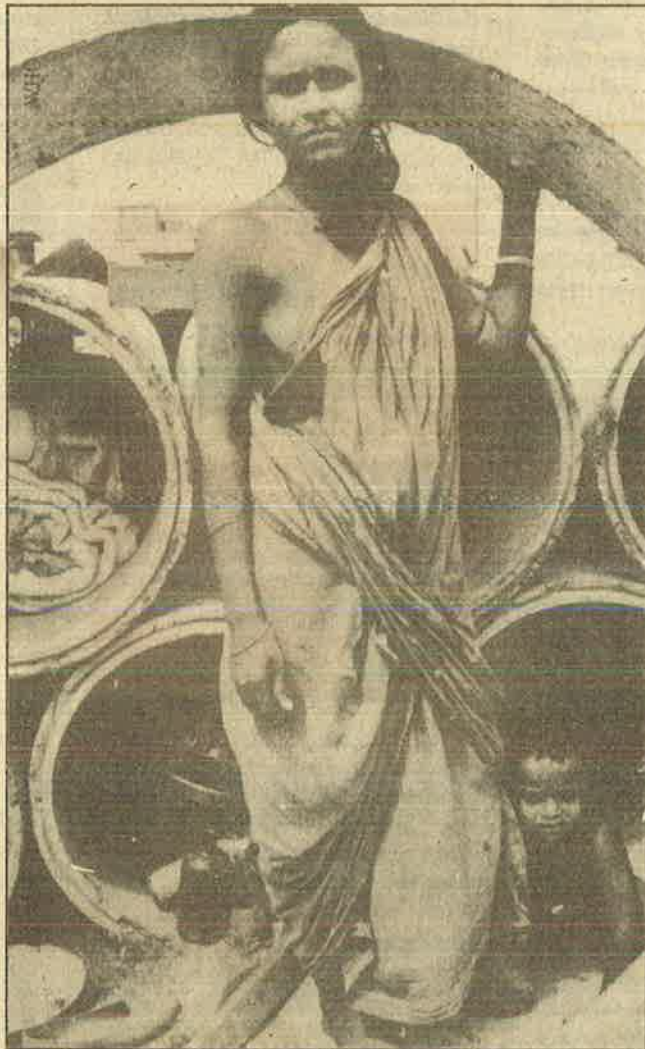
வீட்டற்ற இந்திய குடும்பம்; கேடுகெட்ட அரசு திட்டங்களின் விளைவு

● 70 நாடுகளில் வாழும் 30 கோடி பூர்வகுடி மக்கள் கடுமையான பாரபட்சத்தையும் வன்முறையையும் அடிக்கடி சந்திக்கிறார்கள்.