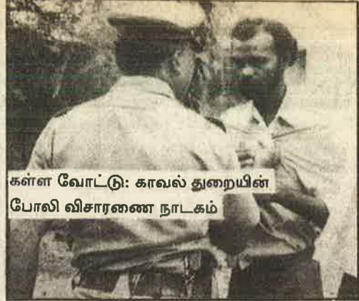
கள்ள வோட்டு: காவல் துறையின் போலி விசாரணை நாடகம்

தன்னை எதிர்ப்பவர்கள் யாராக இருந்தாலும் தாக்குகிற தைரியம், தனது முதல்வர் பதவியால் மட்டும் ஜெயலலிதாவுக்கு கிடைத்ததல்ல; அதையும் தக்கவைப்பதற்கு கிரிமினல் வலைப்பின்னலோடும், கவர்ச்சி அரசியல் மூலதனத்துடனும் கட்டியமைக்கப்பட்டிருக்கும் அ.தி.மு.க. என்ற அமைப்பு கையிலிருக்கிற தைரியம்தான்.