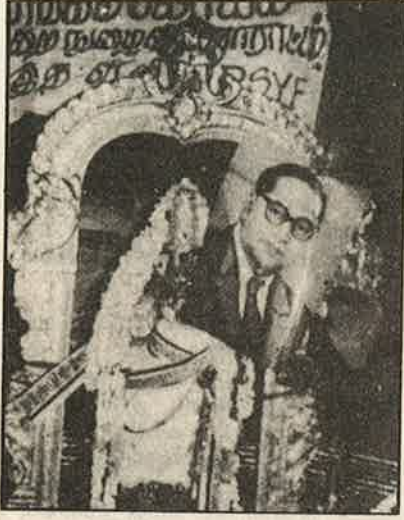
மே 24 '93 அன்று சீறிரங்கம் கோயில் கருவறையில் அம்பேத்கார் படத்துடன் ம.க.இ.கவினர்

கூடந்த வருடம் மே 24-ம் தேதி திருச்சி - திருவரங்கம் கருவறை நுழைவுப் போராட்டம் மக்கள் கலை இலக்கியக் கழகம் மற்றும் அதன் தோழமை அமைப்புகளான பு.மா.இ.மு., வி.வி.மு. ஆகிய அமைப்பினரால் இணைந்து நடத்தப்பட்டது. அது சனா தன - பார்ப்பனீய - இந்து மத சாதிய ஆதிக்கத்திற்கு கொடுக்கப்பட்ட பல மான அடியாகவும் இத்தகையப் போராட்டத்தைத் தொடர தொடக்கமாகவும் வெற்றியாகவும் அமைந்தது. ஒரண்டுக்குப்பின் இந்நாளை நினைவு கூறும் முகமாக பிரச்சார இயக்கம் திருச்சியில் மேற்கொள்ளப்பட்டது. ஆயிரக்கணக்கான பிரசுரங்கள், சுவரொட்டிகள் மூலமும் திருவரங்கம், திருவானைக்காவல் பகுதிகளில் வீடுவீடாகவும் சென்று பிரச்சாரம் செய்தனர். இப்பகுதிகளில் 3 நாட்கள் கலைநிகழ்ச்சியோடு தெருமுனைப் பிரச்சாரம் செய்யப்பட்டது. பொதுக்கூட்டத்திற்கு போலீசு அனுமதி மறுத்துவிட்டது. எனினும் வீடுவீடாகச் சென்று ம.க.இ.க., பு.மா.இ.மு. தோழர்கள் செய்த பிரச்சாரம் ஆயிரக்கணக்கான மக்களிடமிருந்து ஆதரவைப் பெற்றது. குளிர்பானம், நிதியளித்து ஆதரித்ததோடு பலர் இவ்வியக்கத்தில் தம்மையும் இணைத்துக் கொள்ள முன்வந்தனர். பல தி.க., தி.மு.க.-வினர் உற்சாகமாக வரவேற்று "நீங்கள்தான் சரியானவர்கள்" என்று வாழ்த்திப் பேசினர்.