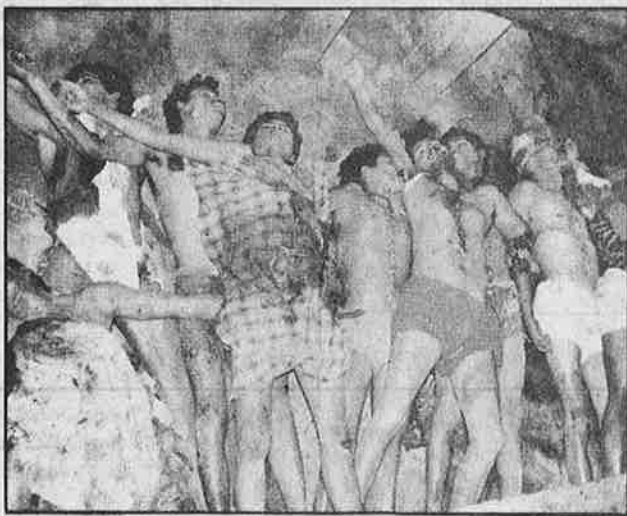
போலீசாரால் சுட்டுக் கொல்லப்பட்ட மாவோயிசு கம்யூனிச மையத்தினர்

புகுந்து தாக்கியுள்ளது. கர்ப்பவதியான இளம் பெண்ணைத் தூக்கிச் சென்று மானபங்கப்படுத்தியும் மயக்கமுறாமளவு அடித்துக் காயப்படுத்தியும் இருக்கிறது. தடுக்க வந்த போலீசாரையும் தாக்கியும் இரு சக்கர வாகனங்களை சேதப்படுத்தியும் வெறியாட்டம் போட்டுள்ளது. தங்கள் கேட்டனின் வாரிசுகள் மிதிவண்டியில் இருந்து கீழே விழுந்ததால், குறுக்கே வந்த இரு லம்பாடி சிறுவர்களை அடித்திருக்கிறான் கேப்டன் வீட்டு காவலாளி. இதைத் தட்டிக் கேட்டதற்குத்தான் இந்த வெறியாட்டம். கடந்த முன்று மாதங்களுக்குள் அந்நகரில் ராணுவத்தினர் பொது மக்களைத் தாக்குவது இது 3-வது முறையாகும். ●