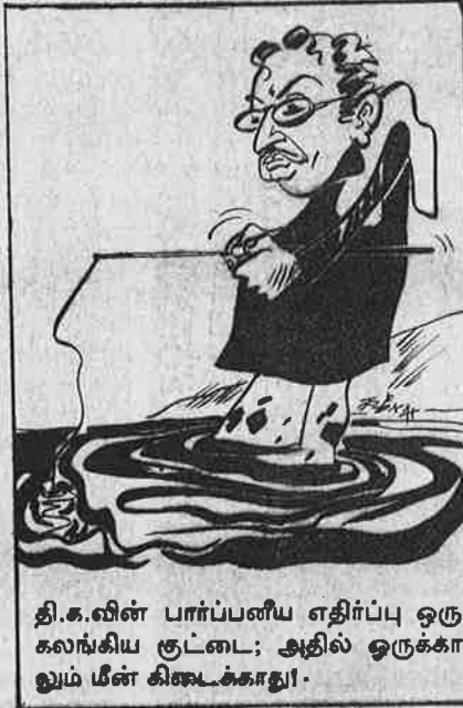
தி.க.வின் பார்ப்பனீய எதிர்ப்பு ஒரு கலங்கிய குட்டை; அதில் ஒருக்காலும் மீன் கிடைக்காது!

"பார்ப்பனராகப் பிறந்த அனைவருமே நம்பிக்கை துரோகம் செய்து விடுவார்கள். அடுத்துக் கெடுக்கும் நரித்தனமும் சூழ்ச்சியும் அவர்களது ரத்தத்திலேயே ஊறியவை. இதற்கு விதிவிலக்கே கிடையாது" - என்பதுதான் வீரமணி போன்றவர்களின் வாதம். ஆனால், திராவிடர் கழகத்தின் அனுபவமும் அணுகுமுறையுமே அதற்கு மாறானது என்பதற்கு சான்றுகள் கூறமுடியும் என்று புதிய ஜனநாயகம் எழுதியுள்ளது.