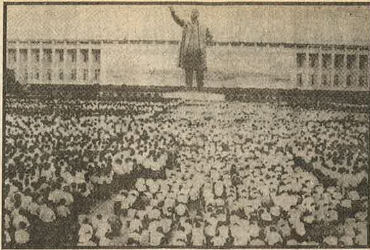
கீம் இல் சுங்கின் சிலையின் முன் இறுதி அஞ்சலி செலுத்தும் வடகொரிய மக்கள்

யையும் ஆட்சியையும் சீரழிக்கத் தொடங்கியது. பின்னாளில், சோவியத் கம்யூனிஸ்ட் கட்சியைத் திரிபுவாதக் கட்சியாக வரையறுத்த போதிலும், சோவியத் ஒன்றியத்தை சோசலிச நாடாகவே கீம் இல் சுங்கும் அவரது கட்சியினரும் மதிப்பீடு செய்தனர். தொடர்ந்து அதன் இராணுவ, பொருளாதார, அரசு தந்திரத் துறை ஆதரவைச் சார்ந்து நின்றது. இதே காலகட்டத்தில் கொரியாவின் அண்டை நாடான சோசலிச சீனாவில், தோழர் மாவோவின் சிந்தனை மார்க்சிய - வெனினிசயத்திற்கும்