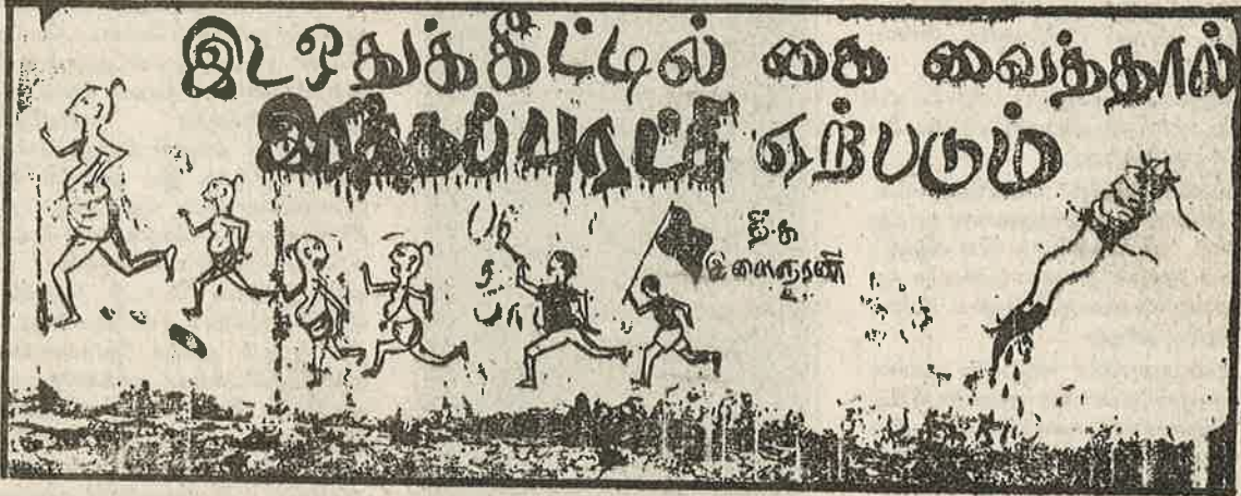
தி.க.வின் சுவரெழுத்து விளம்பரம்; கருவறை நுழைவுப் போராட்டம் வன்முறை என்றால் இது என்ன அஹிம்சையா?

முதலாவதாக, பார்ப்பன எதிர்ப்பு என்பது ஏதோ வீரமணி கும்பல் மொத்த குத்தகை எடுத்துக் கொண்டதுபோல அதில் மற்றவர்கள் ஆதரவை ஏற்பதும், ஒதுக்குவதும் இவர்கள் முடிவு செய்வதைப் போலவும் பேசும் வெட்கக் கேட்டைப் பாருங்கள்! மற்றவர்கள் யாரும் தமது பார்ப்பன எதிர்ப்பை ஒதுக்க வேண்டாம், ஏற்றுக்