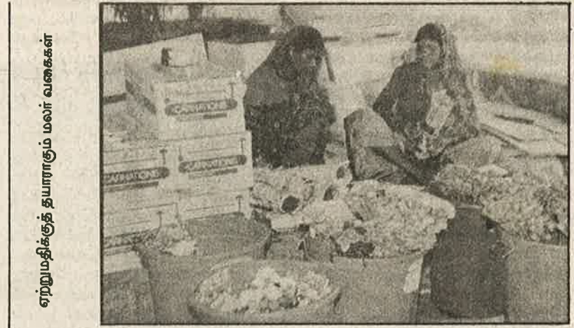
ஏற்றுமதிக்குத் தயாராகும் மலர் வகைகள்

ஏற்றுமதி முக்கியத்துவம் வாய்ந்ததாகக் கருதப்படும் எண்ணெய் வித்துகளைப் பயிரிடும் சிறு விவசாயிகளின் எண்ணிக்கை நாடு முழுவதும் 5 1/2 லட்சத்துக்கும் அதிகம். தமிழ்நாட்டின்