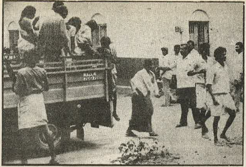
'கற்பழித்த' கயவர்களை அடையாளங் காட்டச் செல்லும் சின்னாம்பதி பழங்குடி மக்கள்

கூடுகளில் சாதாரண மரத்திலிருந்து சந்தன மரம் வரை பெரிய அளவிற்கு கடத்தி விற்பதை ஓர் தொழிலாகவே நடத்தி வரும் வனத்துறை அதிகாரிகள் தமது 'தொழில்' எதிர்ப்பாளர்களை கைது செய்து கொலை செய்வதோ, கற்பழிப்பதோ சாதாரணம். அவ்வது "கேஸ்"