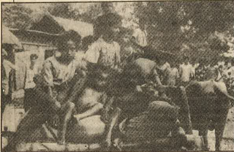
தலைமுறைக்கு முன்பு குடியேறிய வங்காளிகளை (அன்றைய கிழக்கு பாகிஸ்தானிலிருந்து பிழைப்புக் காக வந்தவர்களை) கடந்த ஜூலை மத்தியில் பார

போடோ தீவிரவாதிகளின் இனவெறித் தாக்குதலுக்கு அஞ்சி அகதிகளாகத் தப்பியோடும் வங்காளிகள்.