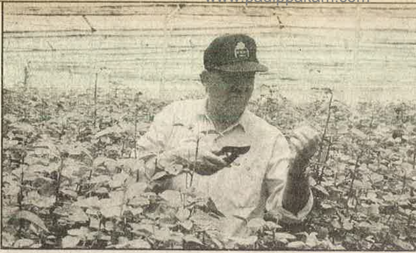
நவீன கூரைகளின் கீழ் பயிர் செய்யப்படும் ரோஜா தண்டுகள்.

பிடியை மேலும் இறுக்கும். மறுபுறம் உள் ளர் சந்தைக்குப் பயிரிடும் விவசாயிகள் பயிர்கள் பூச்சியினால் தாக்கப்படும் பொழுது, நிறுவனங்களைப் போல உள்ளீடு பொருட்களுக்கு செலவு செய்ய வச தியற்றது. நொடித்துப் போவர் மேலும், ஏற்கனவே உணவுப் பொருள் உற்பத்தி செய்யும் விவசாயிகள் நொடித்துப் போவது அதிகமாவதால், அவர்கள் இந் நிறுவனங்களால் கவரப்பட்டு பயிரை மாற்றிக் கொள்ளவோ அல்லது நிலத்தை அவர்களிடம் விற்றுவிடவோ வாய்ப்பு கள் உள்ளது. விளைச்சல்திறனைக் கூட்ட அதிகரித்த அளவில் பயன்படுத்தப்படும் உரம் - பூச்சிமருந்தினால்நிலம் உவராதி, சுற்றுப்புற சூழலும் மாசுபட்டு போகும்.