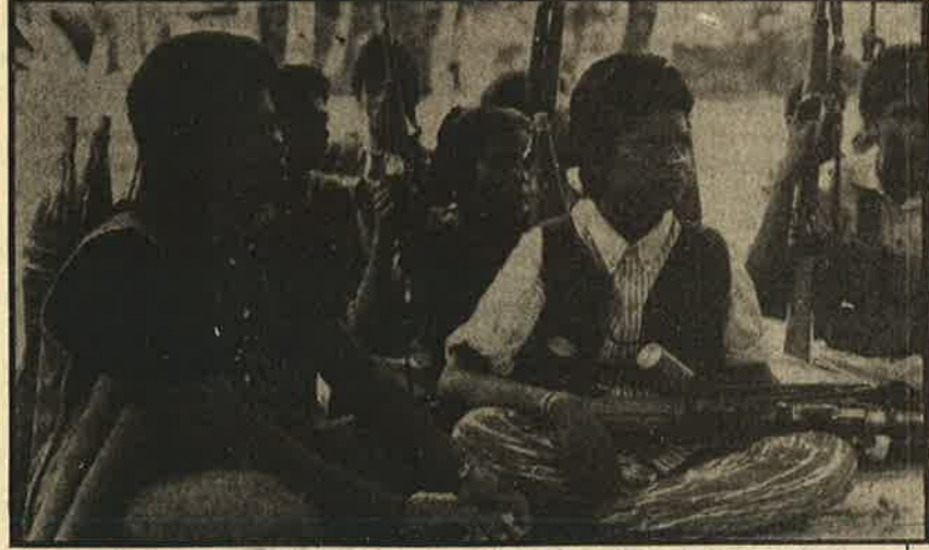
சமூகப்போரில் ஏறக்குறைய ஒரு தலைமுறையே பலியிடப்பட்டு, அடுத்த தலைமுறையின் சிறார்களை முன்னிறுத்தப்பட்டுள்ளனர்.

நீண்டகால கொரிஸ்லாப் போர் என்பதால் வெற்றி நிச்சயம் என்கிற நம்பிக்கை