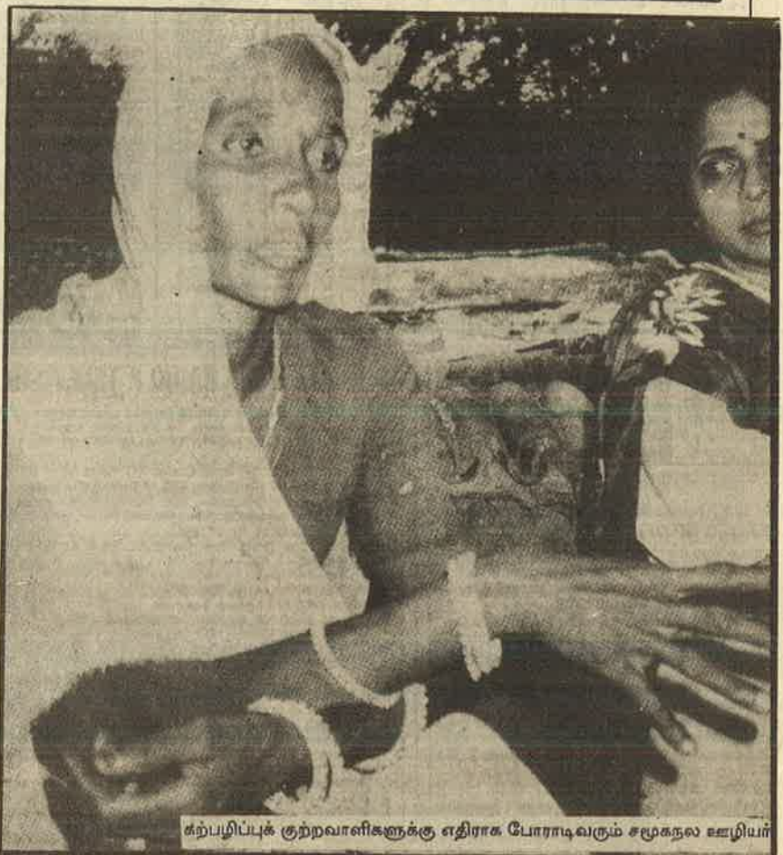
கற்பழிப்புக் குற்றவாளிகளுக்கு எதிராக போராடிவரும் சமூகநல ஊழியர்

அதிகார வர்க்கமும் ஆதிக்க சக்திகளும் சமூகநலப் பெண் ஊழியர்களின் வாழ்வைப் பறித்து இருளில் தள்ளி வருகின்றன.