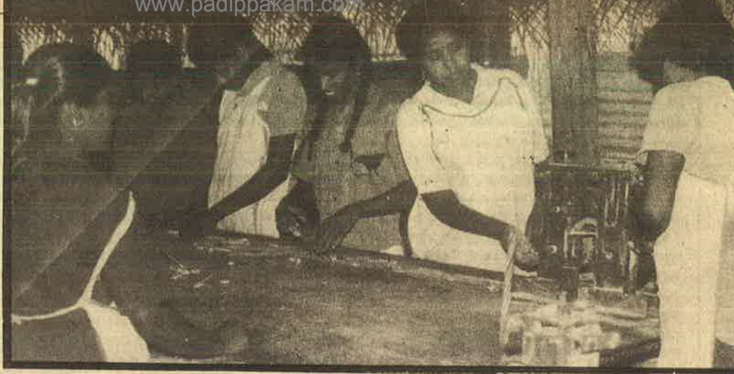
புலிகளின் நேரடிக் கட்டுப்பாட்டின் கீழ், இராணுவத் தேவைக்கான தொழிலுற்பத்தியில் ஈடுபடும் பெண்கள்; புலிகளின் இராணுவ அதிகார வர்க்க 'சோசலிச' உற்பத்தி முறை.

ஆனால் விடுதலைப் போரின் வெற்றிக்குச் சில நிபந்தனைகள் உள்ளன. புலிகள் அதிகாரத்தைக் கைப்பற்றியுள்ள யாழ்ப்பாணத்தில் பாசிச சர்வாதிகார - இராணுவ அதிகார வர்க்கப் பாணியிலேயே ஆட்சி நடக்கிறது. ஜனநாயக சக்திகளாக மக்களிடம் அதிகாரத்தைப் பகிர்ந்துகொள்ளும் முயற்சியே கிடையாது. சிங்கள இராணுவத்தின் பொருளாதார முற்றுகையை முறியடிக்கும் வகையில் ஈழத்தில் சுயமான பொருளாதார - தொழில் முயற்சிகளில் மக்கள் ஈடுபட்டிருப்பதாக புலிகளின் பத்திரிகைகள் எழுதுகின்றன; புலி ஆதரவாளர்களும் பீற்றிக் கொள்கிறார்கள். ஆனால் ஈழ மக்களின் கூட்டுறவுப் பொருளாதாரத்துக்