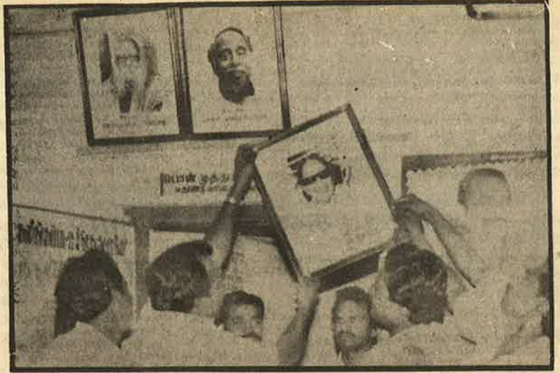
மதுரை புறநகர் தி.மு.க. அலுவலகத்தில் கருணாநிதி படத்தை அசுற்றும் வை.கோ. ஆதரவாளர்கள்; பிளவின் எதிரொலி.

அதற்கு முன்பு ஜெயா ஆதரவு ஏடுகளான 'சோ'வின் 'துக்ளக்'கும், இந்துவும் நடத்திய கருத்துக் கணிப்பின்படி தமிழக சட்டமன்றத்துக்கு தேர்தல்கள் நடந்தால் தி.மு.க. அமோக வெற்றி பெறவும், கருணாநிதி முதல்வராகவும் பிரகாசமான வாய்ப்பிருப்பதாகக் காட்டியது. இதற்கு முக்கிய காரணம் காங்கிரசு - ஜெயா கூட்டு முறிவு மட்டுமல்ல, ஜெயலலிதாவின் லஞ்ச - ஊழல் உல்வாச - ஊதாரி வாழ்க்கை, போலீசு -