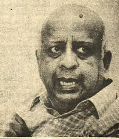
தன் வரம்பற்ற அதிகாரத்தை சேஷன் எந்த நோக்கத்திற்கு பயன்படுத்துகிறார் என்பது தான் கேள்வி

இந்த அமைப்புகள் யாவும் சம அளவில் அதிகாரம் கொண்டவை என்று கூறப்பட்டாலும், உண்மையில் நடைமுறையில் அதிகாரத்தை ஏந்திச் சுழற்றுவது அதிகாரவர்க்க - போலீசு - ராணுவ அமைப்புகள் தான். போடப்படும் சட்டங்களை அமுலாக்குவதும் அவ்வது கிடப்பில் போடுவதும் நீதிமன்றத் தீர்ப்புகளை நிறைவேற்றுவதும் அவ்வது சூப்பையில் வீசுவதும் அதிகாரவர்க்கத்தின் கையில்தான் உள்ளது. நாடாளுமன்ற ஜனநாயக மரபுப்படியும், இந்திய அரசியல் சட்டப்படியும் தற்போதைய விவகாரத்தில் தலைமைத் தேர்தல் கமிஷனர் சேஷனுக்குத்தான் அதிகாரமுள்ளது என்பது உண்மைதான். உச்சநீதிமன்றமும் ஆகஸ்ட் 10-ந் தேதியன்று அளித்த தீர்ப்பில், பம்பாய், கல்கத்தா, சென்னை உயர்நீதிமன்றங்களின் இடைக்கால உத்திரவுகள்