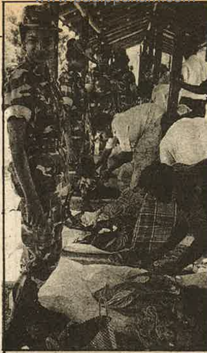
வடமாகாணங்களில் புலிகள் கட்டுப்பாட்டு பகுதிக்குள் செல்லும் மக்கள், ராணுவத்தின் கடுமையான சோதனைக்குப் பிறகே நகர முடியும்.

செஞ்சிலுவைச் சங்கம் மற்றும் தனிப்பட்ட நபர்கள், வியாபாரிகள் கொண்டு வரும் அத்தியாவசியப் பொருட்களை கணிசமான அளவு அரசு அதிகாரிகளும் புலிகளும் குறைந்த விலைக்குப் பிடுங்கிக் கொள்வதாலும் பொருள் தட்டுப்பாடு - விலைவாசியற்றம் நீடிக்கிறது. அண்மையில் கொழும்பில் இருந்து 45 பேர் மண் மண்ணெண்ணெய் கொண்டு வந்த ஒரு வியாபாரியிடம் கொழும்பு கொள்விலையில் 30 பேர்களை புலிகள் வலுக்கட்டாயமாக