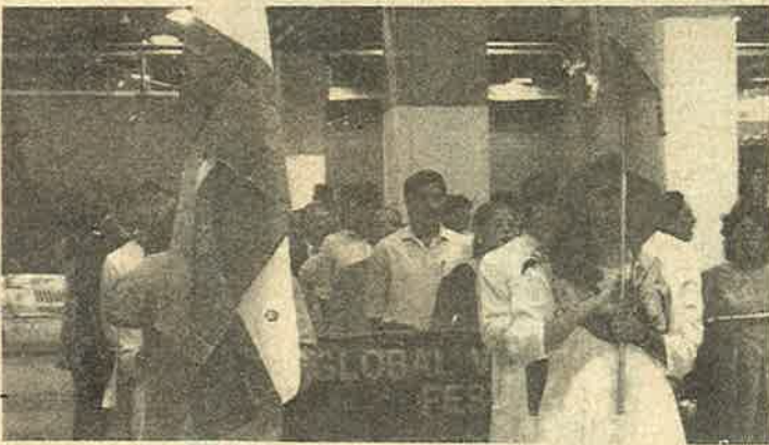
விசுவ இந்து பரிஷத் 'அமெரிக்க கிளை'யினர் 'உலக மாநாடு ஊர்வலத்திற்காக எடுக்கும் பயிற்சி.