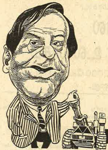
இத்தாலிய கம்பெனியின் பிரதிநிதி குவாட்ரோச்சி

போபர்ஸ் கொள்ளை தொடர்பாக கவில் நீதிமன்றத் தீர்ப்பு வெளியான உடனேயே, கொள்ளையை மீண்டும் மூடிமறைக்கவும் குற்றவாளிகளைத் தப்பியோடச் செய்வதிலுமே காங்கிரசு துரோகிகள் குறியாக இருந்தார்கள். "எங்கள் அன்புத் தலைவரும் தியாகியுமான ராஜீவ் காந்தியின்