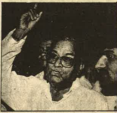
டாண்டிக் கொள்ளைகளை எதிர்க்கவோ எந்த கட்சிக்கும் அருகதையில்லை என்பது தெளிவு.

இதுமட்டுமல்ல காங்கிரசு, பா.ஜ.க. உட்பட எந்த கட்சிக்கும் தேர்தலை சந்தித்து அறுதி பெரும்பான்மையுபெறவேண்டும் என்ற