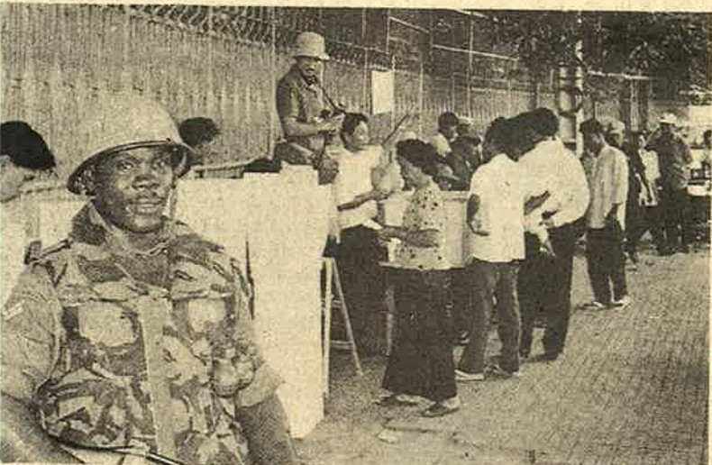
கம்போடியாவில் போலி ஜனநாயகத் தேர்தலையும் ஐ.நா. படைகளே நடத்தின.

● கம்பூச்சியாவில் சோவியத் ஆதரவு பொம்மை அரசுக்கு எதிராக போராளிகள் நடத்திவரும் விடுதலைப் போராட்டத்தை முடிவுக்குக் கொண்டு வரவும், மோசடித் தேர்தல் நடத்தி தமது விகவாச அரசை நிலைநாட்டவும் ஏகாதிபத்தியங்கள் கம்பூச்சிய விவகாரத்தில் தலையிடத் தொடங்கின. ஜனநாயகத்தையும் அமைதியையும்