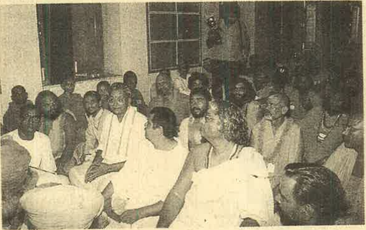
சாதுக்கள், சந்தியாசிகள், மகந்துகள், மடாதிபதிகள் மத்தியில் வி.இ.ப.: பொதுச் செயலர் அசோக் சிங்கால்

பெண்களை தமது மதவெறிக்குத் திரட்டுவதற்காக "மாதரி மண்டல்" என்னும் வயோதிகப் பெண்கள் அமைப்பும் உள்ளது. "ராஷ்டிரீய கவயம் சேவிகா சங்க" எனப்படும் பெண்களுக்கான ஆர்.எஸ்.எஸ். இதை இயக்குகிறது. இதன்மூலம் சிவ்வர் - சிறுமிகளுக்குப் பள்ளிகள் நடத்தப்படுகின்றன. மருத்துவ விடுதிகள், ஓய்வூதிய நேரத்தொழில் பயிற்சிகள் நடத்தப்படுகின்றன.