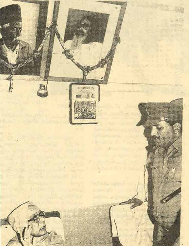
யாளவுக்கே தடை செய்யப்பட்ட ஆர்.எஸ்.எஸ். தலைவர் தேவரசிடம் பணிவாக அரசு ஆணையை ஒப்படைக்கிறது போலீசு.

மேற்கண்ட துணை அமைப்புகள், துறைப் பணிகள் மூலமும் பூசாரிகளின் ஒரு வலைப் பின்னலையும், தனது கட்டுப்பாட் டில் கோவில்களைக் கொண்டு வருவது, தானே கோவில்களை நிர்மாணிப்பதன் மூலமும் ஒரு பொதுவான கடவுளர்கள், சடங்குகள், திருவிழாக்களை ஏற்படுத்தி முஸ்லீம்களுக்கெதிராகப் போரிட்டு, இந்து