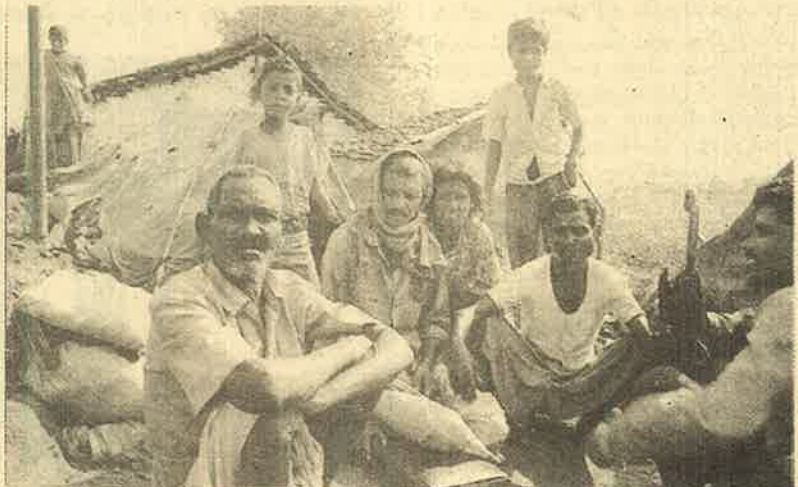
நர்மதா திட்டத்தால் வாழ்விழந்த விவசாயிகள் நகர்ப்புற சேரிகளில் உதிரிக் தொழிலாளர்களாக....

"ஒரு லட்சம் மக்களின் வாழ்வைப் பறிப்பதோடு அல்லாமல், 13,000 ஹெக்டேர் பரப்பளவுக்கு காடுகள் அழிக்கப்படுவதால் இத்திட்டம் முற்றாக மக்களுக்கே எதிரானது. காடுகள் அழிக்கப்படுவதால் சுற்றுச் சூழல் கடுமையாக பாதிக்கப்பட்டு, நிலநடுக்க அபாயமும் ஏற்படும். காடுகள் அழிவதால், நீர்ப் பிடிப்பு பகுதிகளில் மழையளவு குறைந்து போய், நர்மதை ஆறே கருங்கிவிடும். இதுதவிர, வெளியேற்றப்படும் மக்களுக்கு உரிய நிவாரண - புனர்