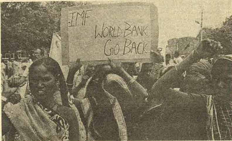
“ஐ.எம்.எஃப்., உலக வங்கியே ஒழிந்துபோ” என்று முழக்கமிடும் ஆதிவாசிப் பெண்கள்....

இதனால் ஆத்திரமடைந்து ஆட்சியாளர்கள், உள்நாட்டிலேயே நிதிதிரட்டி எப்பாடுபட்டேனும் இத்திட்டத்தை நிறைவேற்றியே தீருவோம் என்று கொக்கிக்கின்றனர். குஜராத்நிலம் நீர்ப்பாசன ஆண்கள் வரவு - செலவுத் திட்டத்தில் 80% தொகையை சர்தார் சரோவர் திட்டத்துக்கு ஒதுக்கீடு