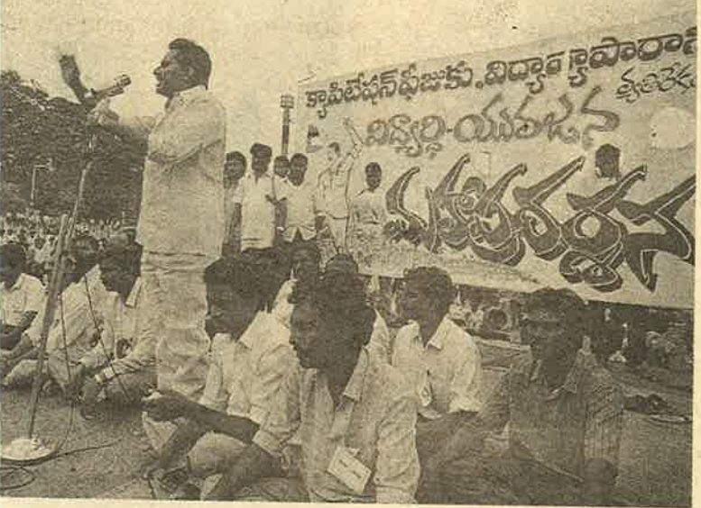
கல்லூரிகளில் கொள்ளைக்கெதிராக கொதித்தெழுந்துள்ள மாணவர் - னைஞர் கூட்டம்...

மாணவர்களுக்கு மறுபெயர் சுயநிதிக் கல்லூரிகள்