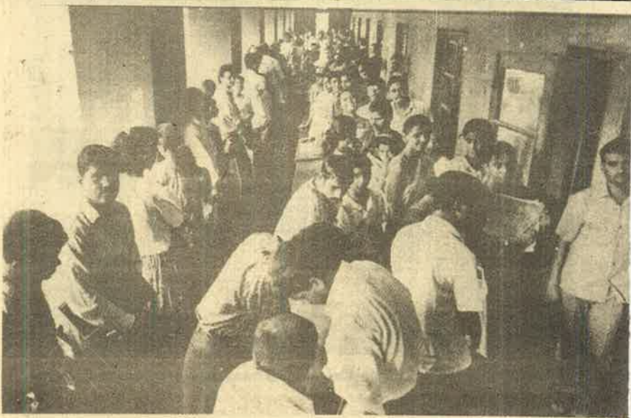
கல்லூரிகளில் அனுமதி கேட்டு காத்துக் கிடக்கும் கூட்டம்...

பதி மருத்துவ கல்விக்கு வருடக் கட்டணமாக ரூ. 1,71,500 நிர்ணயிக்கப்பட்டுள்ளது. பொறியியல் கல்விக்கு கல்லூரி அளித்துள்ள வசதிக்கேற்ப ரூ. 32,000 முதல் 72,000/- வரை. கர்நாடகாவிலே இக்கட்டணம் முறையே 55,000 மற்றும் 20,000 ஆகும். தமிழ்நாட்டில் 26,250 மற்றும் 45,500/- தனியார் கல்வி நிறுவனங்கள் கோருவதோ மருத்துவக் கல்விக்கு ரூபாய் இரண்டரை லட்சம், பொறியியலுக்கு எழுபது ரூபாய். அதே சமயம் பம்பாயிலிருந்து வெளிவரும் பொறியியல் பத்திரிகையொன்று, 'வருடத்தில் 200 மாணவர்க