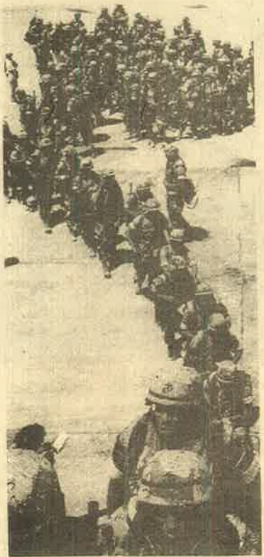
போஸ்னியா: அமைதிப்படையா? ஆக்கிரமிப்புப்படையா?

செர்பிய இனவெறித் தாக்குதலை முறியடிப்பது, பேர்ஸ்னியாவில் அமைதியை நிலைநாட்டுவது என்ற பெயரில் ஏகாதிபத்தியங்கள் தமது படைகளைக் குவித்து ஆக்