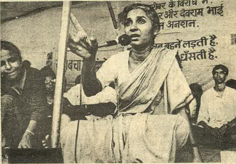
நர்மதா பேரழிவுத் திட்டத்திற்கெதிராக போர்க்கொடி எந்தியுள்ள போராளி மேதா பட்டர்...

வர்க்கப் போராட்டத்தைவிட, சுற்றுச்சூழல்தான் இன்றைய தலையாயப் பிரச்சினை; அது வர்க்கப் போராட்டம், அரசியல் போராட்டங்களுக்கு அப்பாற்பட்ட உலகளாவிய பிரச்சினை என்று இவர்கள் வாதிடுகிறார்கள். அடுத்தடுத்து எரியும் பிரச்சினைகளை நாடு எதிர்கொண்ட போதிலும் அவற்றுக்காக இத்தன்னார்வக் குழுக்கள் போராட முன்வரவில்லை. நர்மதா போராட்ட இயக்கத்தை ஏகாதிபத்திய எதிர்ப்புப் போராட்டமாக வளர்த்தெடுக்கவும் இவர்கள் தயாராக இல்லை. சுற்றுச்சூழல் பாதுகாப்பு, பாதிக்கப்பட்ட மக்களுக்கு நிவாரணம் என்கிற வரம்போடு, குறுகிய பொருளாதாரவாதப் போராட்டங்களையே இவர்கள் தீவிரமாக நடத்தி வருகிறார்கள்.