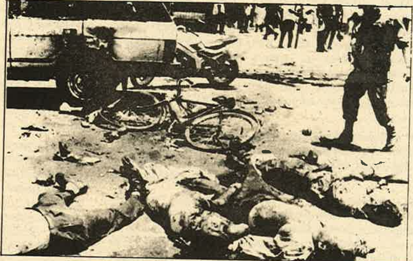
இலங்கையில் மே தின நிகழ்ச்சியில் மனித வெடிகுண்டுக்கு பலியான உடல்கள்.

யிட இருந்த பிரபல நடிகரும், சிரிமாவோ பண்டாரநாயகாவின் மருமகனுமான விஜயகுமாரனதுங்கே துப்பாக்கியாளர்களால் சுட்டுக் கொல்லப்பட்டார். அதேபோல இன்னொரு போட்டி வேட்டாளராக மாறி எதிர்க் கட்சிகள் சார்பாக போட்டியிட இருந்த இலங்கை இராணுவத் தளபதி கெம் படுவா உட்பட 12 அதிபர் இராணுவத் தளபதிகள் கண்ணி வெடியில் சிக்கி ஒரேயடியாக மாண்டு போயினர். அதே போல ஒரு காலத்தில் பிரேமதாசா சக்பாடிகளாக இருந்து, அதிருப்தியுற்று அவரது மந்திரி சபையில் இருந்து விலகி, பிரேமதாசாவை பதவி நீக்கம் செய்ய முயன்று தோல்வியுற்றனர் காமினி திசாநாயகே, பிரேமச்சந்திரா, லலித் அதுலத் முதலி ஆகியோர். அவர்களில் அடுத்த அதிபர் தேர்தலில் போட்டியிட இருந்த லலித் அதுலத் முதலி, பிரேமதாசா கொலைக்கு எட்டு நாட்கள் முன்னதாக ஒரு தேர்தல் மேடையில் வைத்து பகிரங்கமாகவும் துணிசுரமாகவும் சுட்டுக் கொல்லப்பட்டார். இந்தக் கொலைகளில் சூத்திரதாரி பிரேமதாசாதான் எனச் சந்தே