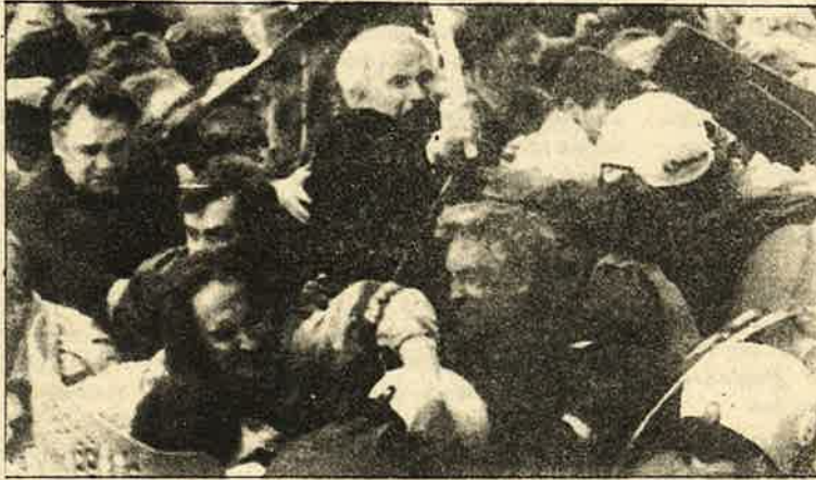
மே தினம் பேரணியைத் தடுத்து நிறுத்திய போலீஸாருடன் மோதும் ருஷ்யத் தொழிலாளர்கள் - உரிமைக்கான போராட்டம்.

★ கொடிய பஞ்சத்தால் பாதிக்கப்பட்ட பகுதியிலிருப்போருக்கு ஒரு நபருக்கு ஒரு நாளைக்கு ரூ.22/- வீதம் செலவழிப்பதாக அரசின் புள்ளி விவரங்கள் கூறுகின்றன. சென்றமுறை பட்டினிச் சாவுகள் ஏற்பட்டதிலிருந்தே, ஒரிஸ்ஸா மாநிலம் காளகந்திக் தென்நே தனியாக ஒரு திட்டத்தைத் தயாரித்திருந்தது அரசு. இதுவரை கடந்த 15 வருடங்களாக அப்பகுதியில் பஞ்சத்தை நீக்க 200 கொடி செலவிடப்பட்டுள்ளதாகக் கூறப்படுகிறது. இருப்பினும் காளகந்தியில் மிகச் சமீபத்தில் பட்டினியால் 14 பேர் இறந்து போயுள்ளனர். பீகாரின் பஞ்சத்தால் பீடிக்கப்பட்ட பகுதிகளுக்கு 80 கோடி ஒதுக்கப்பட்டுள்ளதாக செய்திகள் கூறினாலும், இதுவரை 60 பேர் இறந்து போயுள்ளனர். பி.ஜே.பி. ஆட்சியிலிருந்து பொழுதே அதன் மறுப்பையும் மீறி ம.பி.-யில் பஞ்ச நிவாரண நடவடிக்கைகள் எடுத்ததாக ராவ் அரசு கூறியது. ஆனால் கடந்த மாதங்களில் மட்டும் 1,200 பேர் பட்டினியால் இறந்து போயுள்ளனர். இங்கு ஒரு நாளைக்கு சராசரியாக 10 பேர் இறந்து போவதாக செய்திகள் வருகின்றன. தற்பொழுது உ.பி.-யின் வாரணாசி பகுதிக்கும் பட்டினிச் சாவுகள் பரவ ஆரம்பித்துள்ளது. ராஜீவ் காலத்திலிருந்தே காளகந்தியில் பட்டினிச் சாவுகள் தொடர்கதையாகிப் போயின; இப்பொழுது இக் கொடுமை நாட்டின் வடபகுதியின் முக்கியமான மூன்று மாநிலங்களிலும் பரவத் தொடங்கி விட்டது. இவையாவும் அரசு அளித்ததாகக் கூறும் உதவித் தொகையும், நிவாரணமும் அதன் கோப்புகளிலேயே முடங்கிப் போயுள்ளன என்பதைத்தான் நிரூபிக்கின்றன.