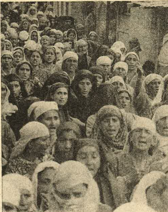
அரசு பயங்கரவாத வெறியாட்டத்துக்கு தமது உறவினர்களைப் பறிகொடுத்த காஷ்மீரி பெண்களின் ஆர்ப்பாட்டம்.