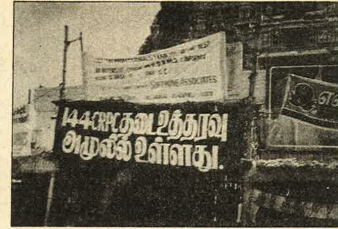
சிறீரங்கம் கோயிலில் 144 தடையை அறிவிக்கும் போலீசின் பதாகை; பீதியின் உச்சத்தில் போலீசு.

கருவறை நுழைவுப்போராட்ட தினத்தன்று அதை எதிர்த்து போரியலுக்குள்ளே கூட்டுவழிபாடு நடத்தப் போவதாக இந்து