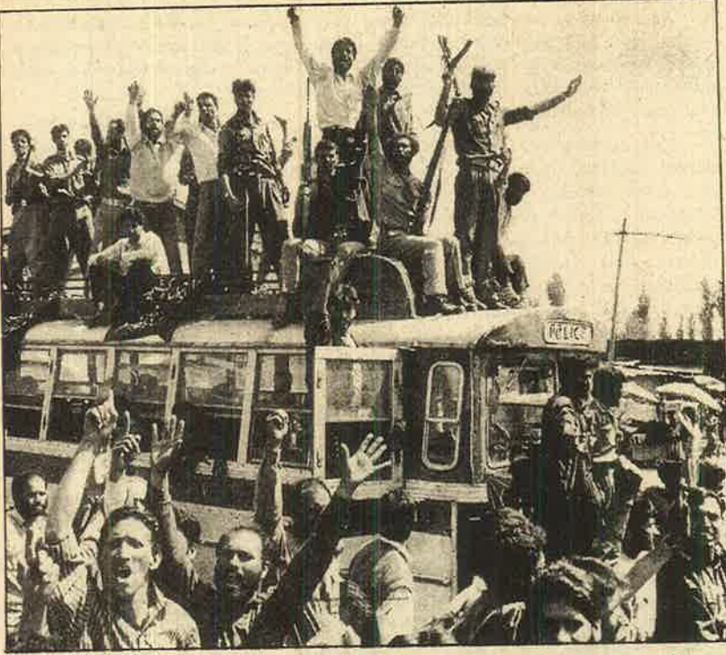
அரசு பயங்கரவாதப் படுகொலையை எதிர்த்து காஷ்மீர் போலீஸினின் போர்க்கோலம்.

வெறி பாசிசத் தலைவரான முரளி மனோகர் ஜோஷி தனது 'ஏக்தா' யாத்திரையை முடித்து பாதுகாப்புப் படையினர் புடைசூழ இங்குதான் 'இந்திய தேசிய'க் கொடியை ஏற்றினார். காஷ்மீரின் இதயமான வால்செளக் பகுதி இன்று சுடுகாடாகக் காட்சியளிக்கிறது.