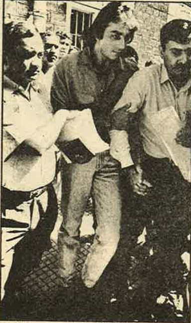
"தா" சட்டத்தின் கீழ் கைது செய்யப்பட்ட நடிகர் சஞ்சய்தத்