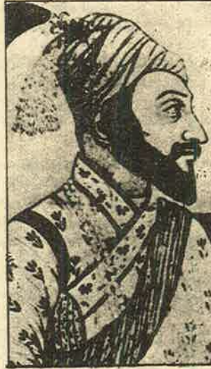
சிவாஜி; ஆர்.எஸ்.எஸ். வெறியர்களின் வீர நாயகன்!

(அனைவருக்கும் அழிவை விளைவிக்கும்) அகிளாபத்தா' என்று டாக்டர்ஜி வியந்தார். பாரதத்தில் இந்துக்களே தேசம், இந்துத்துவமே நாட்டு - அரசு சித்தாந்தமாக இருக்க முடியும் என்பது நிரூபணமானது. தேசிய அரசியல் கட்டுமானத்தின் மீது எழுதப்பட்டுள்ள விதியைக் காண்பதற்கு கற்பனாவாதிகள் மறுத்து நாடகமாடிய அதேசமயம் யதார்த்தவாதியான டாக்டர்ஜி ஹெட்கேவார் பகற்களவுகளில் மூழ்கிப்போக மறுத்தார். உண்மை வெளியில் வந்தது. இந்துஸ்தானத்தை இந்துக்கள் மட்டுமே விடுவிக்க முடியும்; இந்துக் கலாச்சாரத்தை அவர்கள் மட்டுமே காத்திட முடியும். இந்து பலம் மட்டுமே நாட்டைக் காத்திட முடியும். இந்த உண்மையின் தாக்கத்தில் இருந்து தப்ப வழியே கிடையாது. சொந்த - தனிப்பட்ட ஒழுக்கம் மற்றும் தாய் நாட்டின் மீது முழுப் பற்று ஆகியவற்றைக் கொண்ட