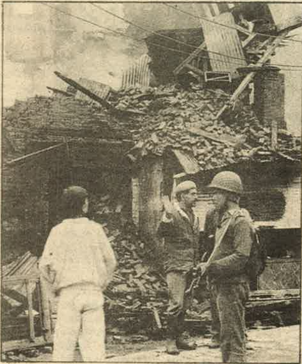
அரசு பயங்கரவாதத் தீயில் எரிந்து சுடுகாடாகிக் கிடக்கும் வால் செளக் பகுதி.