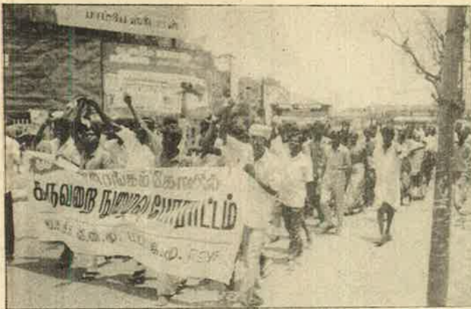
பார்ப்பன ஆதிக்கத்தை எதிர்த்த இடிமுழக்கங்களூடன் 'சூத்திரர்களும்' 'பஞ்சமர்களும்' அவை அலையாக திரண்ட காட்சி.

எல்லா வழிகளையும் அடைத்துவிட்டோம் என்ற கணிப்பில் ஒருபுறமும், மறுபுறம் எப்படியும் வந்து ஏதாவது செய்துவிடுவார்களோ என்ற பீதியுமாய் நின்ற போலீசு அதிகாரிகளுக்குச் சவாலாய் தோழர்கள் திட்டமிட்ட ஒழுங்கோடு வந்து சேர்ந்தார்கள். பீதியடைந்த போலீசு, தோழர்களை உடனே மடக்கி கைது செய்து; வேனில் ஏற்றியது. அப்போதே பெரும்பகுதி தோழர்கள் கைதாகினர். தோழர்கள் கம்பீரமாக முழக்கங்கள் கொடுத்தார்கள். அடுத்த ஓரிரு மணி நேரத்துக்குள் சத்திரம் பேருந்து நிலையம், மையப் பேருந்து நிலையம், சிநீரங்கம் என்று திருச்சியில் பல திசைகளிலிருந்தும் எமது அமைப்புகளின் பதாகைகள், கொடிகள் பிரிக்கப்பட்டு ஊர்வலங்கள் திடீர் திடீரென தொடங்கி நடத்தப்பட்டன. விண்ணதிர முழக்கங்களோடு ஒன்றன்பின் ஒன்