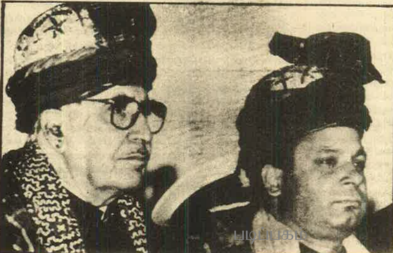
கூடி குலாவிய நேரத்தில் இஷாக்கான், நவாஸ் ஷெரீப்

பாக். ராணுவ - அதிகாரவர்க்க கும்பலின் விசுவாசியாக நவாஸ் ஷெரீப் செயல்பட்ட போதிலும், அவர் ஆட்சியைத் தூக்கியெறிவதற்கு காரணம் இல்லாமல் இல்லை. தமது ஆட்சியைத் தக்கவைத்துக் கொள்ளும் சுயநலன் காரணமாக, ராணுவக் கும்பலின் விருப்பத்துக்கு மாறாக அதிகார வர்க்கத்திலும் ராணுவ தலைமைப் பொறுப்பிலும் தனது விசுவாசிகளை அவர் நியமிக்கத் தொடங்கினார். இதனால் அதிபர் இஷாக்கானும் அவருக்குப் பின்புலமாக உள்ள ராணுவக் கும்பலும் எரிச்சலைந்தனர். அதிபருக்கும் நவாஸ் ஷெரீப்புக்குமிடையே முரண்பாடும் அதிகாரப் போட்டியும் தீவிரமடையத் தொடங்கியது. குறிப்பாக, 1992-ல் ராணுவத் தலைமைத் தளபதியாக நவாஸ் தெரிவு செய்தவரை நியமிக்காமல், தனக்கு விசுவாசமான ஜான்ஜூவாவை நியமித்தார் இஷாக்கான். 1993-ல்