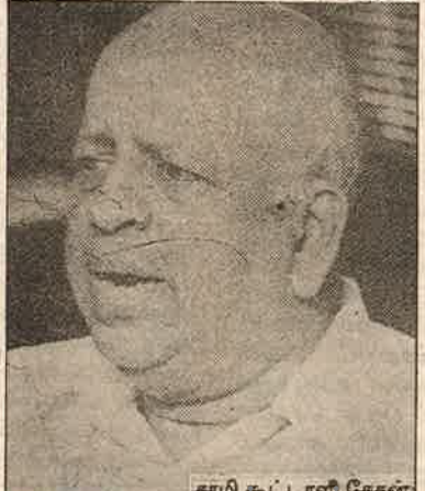
சாமி கூட்டாளி சேசன்

தாங்கள் உருவாக்கிய அமைப்பு விதிமுறைகளையும் கடைபிடிக்காமல் காலில் போட்டு மிதிக்கிறார்கள் என்பதுதான் எல்லா சம்பவங்களிலும் நடக்கிறது. இந்த அத்துமீறலை ஒழுங்கீனத்தை மக்கள் உரைமுடியாத வண்ணம் இவர்கள் கிளப்பும் அதிகார மோதல் சர்ச்சை திசை திருப்பி விடுகிறது. இதே