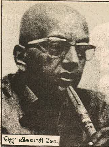
'ஜெ' விசுவாசி சோ.

இக்கும்பல், சட்டமன்றமா? நீதிமன்றமா? எது உயர் அதிகாரம் படைத்தது என்ற சர்ச்சையைப் போலவே உயர் அதிகாரம் படைத்தது. தேர்தல் கமிஷனா? நீதிமன்றமா? என்கிற சர்ச்சையையும் கிளப்பி வருகிறது. ஜெயலலிதா தேர்தல் கமிஷனை மதிக்காமல் நீதிமன்றத்திற்குப் போய் இடைக்காலத் தடை வாங்கியதும், தேர்தல் கமிஷன் எம்.எல்.ஏ. பதவி செல்லாது என தீர்ப்பளித்தாலும் அதற்கு எதிராக உச்ச நீதிமன்றம் செல்வேன் என்று ஜெயலலிதா அறிவித்ததும் இச்சர்ச்சைக்கு அடித்தளமாகியுள்ளது. உயர்நீதிமன்றத்தின் இடைக்காலத் தடையை தேர்தல் கமிஷன் மதிக்குமா என்ற கேள்வியையும் தேர்தல் கமிஷன் முடிவை மீறி ஜெயலலிதா உச்சநீதிமன்றம்