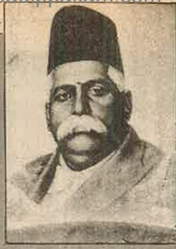
ஆர்.எஸ்.எஸ். நிறுவனா கெட்கேவார்

இந்துக்கள் மட்டுமே இந்த மண்ணின் மைந்தர்கள், தேச பக்தர்கள், இந்துத்துவம் மட்டுமே உண்மையான "இந்தியத் தேசியம்" என்று ஆர். எஸ்.எஸ். கூறுவது பித்தலாட்டம்; கட்டுக்கதை.