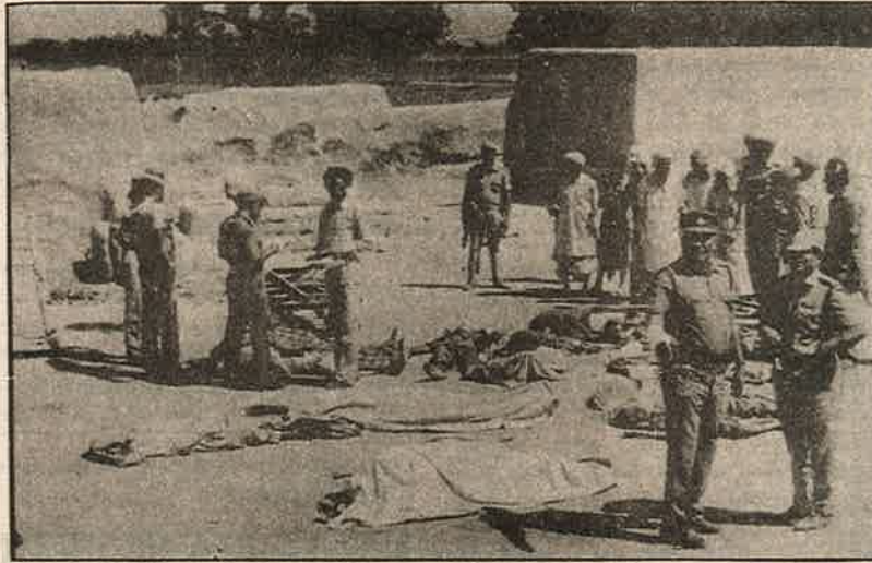
சீக்கிய தீவிரவாதிகளால் கொல்லப்பட்ட அப்பாவி இந்துக்கள்; காலிஸ்தான் களவின் நரவேட்டை.

அடுத்ததாக, மாநில சுயாட்சி, பஞ்சாபி மொழிபேசும் மக்கள் பெரும்பான்மையாக வாழும் பகுதிகளை பஞ்சாபுடன் இணைப்பது, நிதி நீர் பங்கீட்டின் மாநிலத்தின் நியாயவுரிமையைப் பெறுவது ஆகிய பஞ்சாப் மக்களின் நியாயமான கோரிக்கைகளைக் கொண்டிருந்த போதிலும், சீக்கிய தீவிரவாதிகள் மத ரீதியிலான “காலிஸ்தான்” எனும் தனிநாடு அடைவதையே லட்சியமாகக் கொண்டிருந்தனர். அதாவது தோழர்கள் வெலினும், ஸ்டாலினும் ஆக மிகப் பிற்போக்கானதாகச் சாடி நிராகரித்த அனைத்து இஸ்லாமியவாதம், அனைத்து பூதவாதம் போன்றே காலிஸ்தானமும் மத ரீதியிலானது; படுபிற்போக்கானது. இது