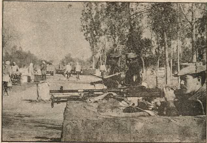
பஞ்சாப் வீதிகளில் இன்றும் தயார் நிலையில் துணை ராணுவப்படை; துப்பாக்கி முனையில் 'அமைதி'.

"கடந்த ஏப்ரல் மாத மத்தியில் நடந்த 'பைசாகி' பண்டிகை முன்புபோல பயபீதியுடன் இறுக்கமான சூழ்நிலையில் அல்லாமல், மக்களின் முகங்களில் மகிழ்ச்சி ததும்ப கொண்டாடனர். பஞ்சாபியர்கள் தமது பாரம்பரிய 'பங்கரா' நடனத்தை உற்சாகத்தோடு ஆடிப் பாடினர். இவ்வாண்டின் முதல் மூன்று மாதங்களில் தீவிரவாதிகளால் சுட்டுக் கொல்லப்பட்டோரின் எண்ணிக்கை 21 பேர்தான். இதில்கூட