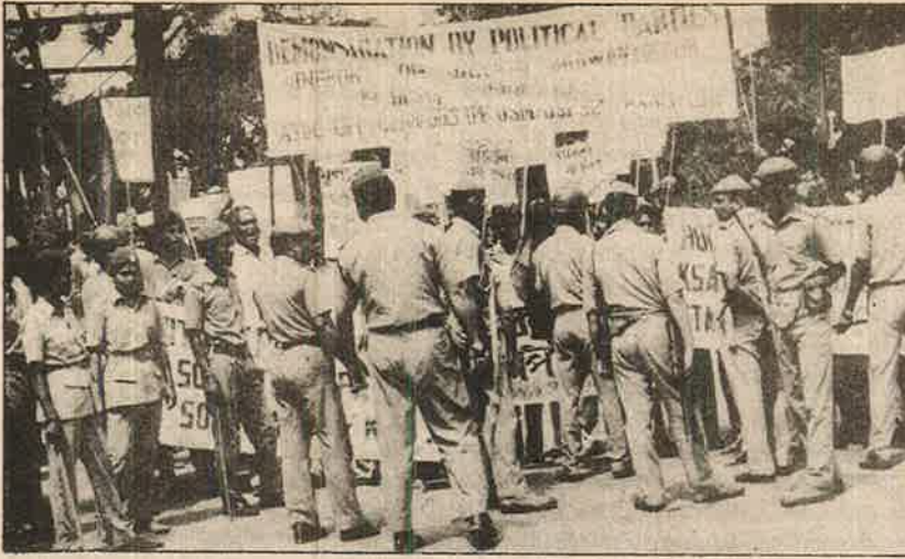
அசாமில் ராணுவத்தின் அட்ரூழியங்களுக்கு எதிராக மக்கள் ஆர்ப்பாட்டம்.

மக்களின் நியாயமான தேசிய இன கோரிக்கைகளுக்காக சக்திவாய்ந்த மக்கள் திரள் அரசியல் போராட்டங்களை கட்டியெழுப்பாமல், பயங்கரவாத சக்திக்குள் வீழ்ந்தனர். வலுவான மக்கள் திரள் போராட்டங்களைக் கட்டியமைத்துப் போராடுவதற்குப் பதிலாக, இரகசிய பயங்கரவாத இராணுவ அமைப்புகளையே கட்டியமைத்தனர். போதாக்குறைக்கு ஐக்கியப்பட்ட தலைமையின்றி அதிலேயும் பிளவுகள்; போட்டிக் குழுக்கள். அரசு பயங்கரவாதத்துக்குப் பழிக்குப் பழிவாங்கும் நடவடிக்கைகளை சீக்கிய பயங்கரவாதிகளால் மேற்கொள்ளப்பட்ட செயல்களும் கூட. பின்னாளில் சீக்கிய மக்களுக்கே எதிரானவையாகத் திரும்பின. கட்டாய நன்கொடை, புகலிடம் கோருவது 'துரோகிகள்' என்று முத்திரை குத்தி சீக்கியர்களையே கொன்றொழிப்பது. அரசு பயங்கர வாதத்தை எதிர்க்கும் அதே சமயம் சீக்கிய மதவெறி பயங்கரவாத அட்ரூழியங்களை விமர்சிக்கும் பத்திரிகையாளர்கள். அரசியல் கட்சியினர், மனித உரிமை இயக்கத்தினரைக்கூட கொன்றொழிப்பது என சீக்கிய பயங்கரவாதிகள் வெறியாட்டம் போட்டனர்.