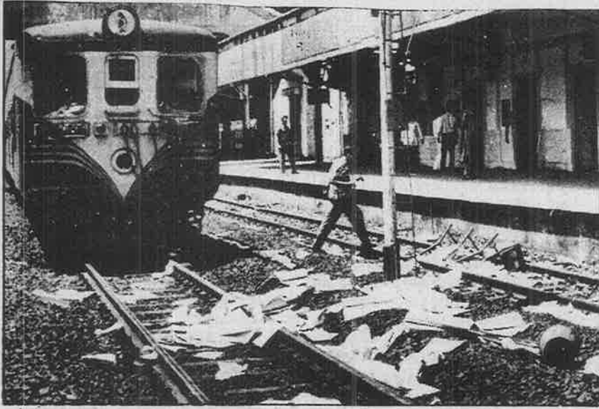
ரயில்வே கட்டண உயர்வை எதிர்த்து சென்னை நகர மக்களின் போர்க்குணம்.

வறுமை-பட்டினிச் சாவுகளைத் தடுக்க ஜவஹர் வேலை வாய்ப்புத் திட்டத்தைத் தவிர வேறு எந்த திட்டமும் இல்லை. இதற்கும் கடந்த ஆண்டு அளவுக்கே நிதி ஒதுக்கீடு செய்யப்பட்டுள்ளது. முந்தைய ஆண்டை விட பணவீக்கமும் விலைவாசியும் அதிகரித்துவிட்ட நிலையில் இந்த ஒதுக்கீடு கடந்த ஆண்டைவிட மிகக் குறைவானதாகும். இதேபோல் கிராமப்புற கல்வி பற்றியும் பட்டெட்டில் எதுவுமில்லை. கல்விக்கான ஒதுக்கீடு 12.5% குறைக்கப் பட்டுள்ளது.