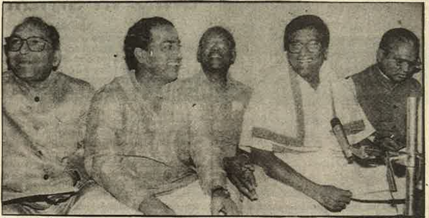
காங்கிரசுக்கு ஆதரவாக கட்சியை உடைத்த தெலுங்கு தேச எம்.பி.க்கள்: அரசியல் விபச்சாரம்.

இப்படி எதிர்ந்தரப்பில் இருந்து கணிசமான பேரே இழுத்துக் கொண்டதால் நரசிம்மராவ் ஆட்சி நிலைத்தது. ஆனால் இதற்காக நரசிம்மராவ் செய்த சகுனித்தனங்கள் கொஞ்சமல்ல. சிவசேனா எம்.பி.களை கவனித்துக் கொள்ள சரத்பவார்; ஜார்க்கந்த முக்தி மோர்ச்சா எம்.பி.க்களை சரிக்கட்ட