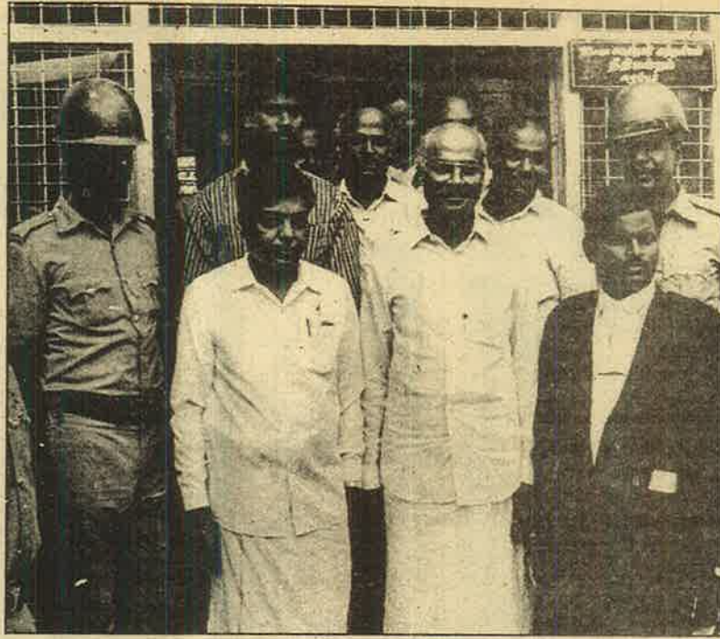
கைதாகி விடுதலையான பா.ம.க. தலைவர்கள்; திட்டமிட்டு நடந்த கைது, நீதிபதி மூலமே அம்பலமாகி மூக்குடைபட்டது ஜெ கும்பல்.

இந்த அடிப்படையில் மக்கள் கலை இலக்கியக் கழகம், புரட்சிகர மாணவர் — இளைஞர் முன்னணி, விவசாயிகள் விடுதலை முன்னணி போன்ற புரட்சிகர அமைப்புகள் பிரச்சாரம் மேற்கொண்டன. ராமதாசு மற்றும் மாநாட்டில் கலந்துகொண்ட பேச்சாளர்களைக் கைது செய்ததைக் கண்டித்தும், அவர்கள் மீது போடப்பட்ட வழக்குகளை திரும்பப்பெறக் கோரியும், தன்னுரிமை தேசத்துரோகமல்ல; அடிப்படை ஜனநாயக உரிமையே; தன்னுரிமைக்கு தளராத போராடுவோம் என்றும் அவ்வமைப்புகளின் சுவரொட்டிகளில் வாசகங்கள் காணப்பட்டன. 'தமிழினத் தலைவர்', 'தமிழர் தளபதி', 'போலி கம்யூனிஸ்டுகள் மற்றும் வி.பி.சிவ் இதில் என்ன நிலைப்பாடு எடுத்தார்கள், எப்