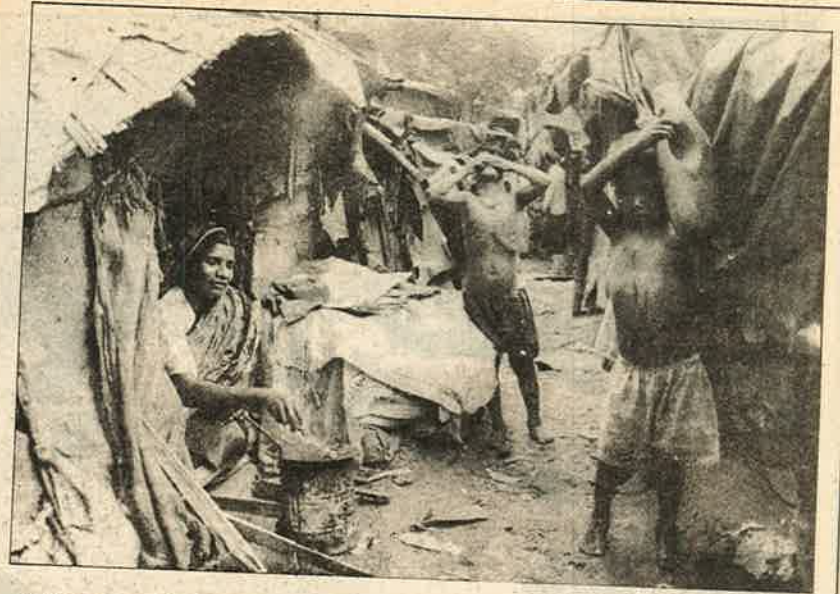
அடிப்படை வசதிகளின்றி டெல்லி சேரிப் பகுதியில் அுவதிப்படும் வங்கதேச அகதிகள். பாரதீய ஜனதாவின் பார்வையில் 'நாட்டை உளவு பார்க்கும் சதிகாரர்கள்'.

கடந்த பத்தாண்டுகளில் வங்கதேச அகதிகள் பீகார், உ.பி. டெல்லி, குஜராத், மகாராஷ்டிரா ஆகிய மாநிலங்களில் பிழைப்பைத் தேடி குடியேறியுள்ளனர். இவர்களில் பெரும்பாலோர் புறநகர் சேரிப் பகுதியில் அல்லற்படும் கூலித் தொழிலாளிகளாவர். மற்றவர்கள் பிச்சை எடுப்பது, ரூபை பொறுக்குவது முதலானவற்றின் மூலம் எப்படியோ வாழ்க்கையை ஓட்டுகின்றனர். இன்றைய நிலையில் ஏறத்தாழ 50 லட்சம் வங்கதேச அகதிகள் இந்தியாவில் குவிந்துள்ளனர். அதிகாரபூர்வ எண்ணிக்கை தெரியாத நிலையில் சில கட்சிகளும், அமைப்புகளும் அகதிகளின் எண்ணிக்கை ஏறத்தாழ ஒன்றரை கோடிப் பேராக இருக்கும் என்று கூறுகின்றன.