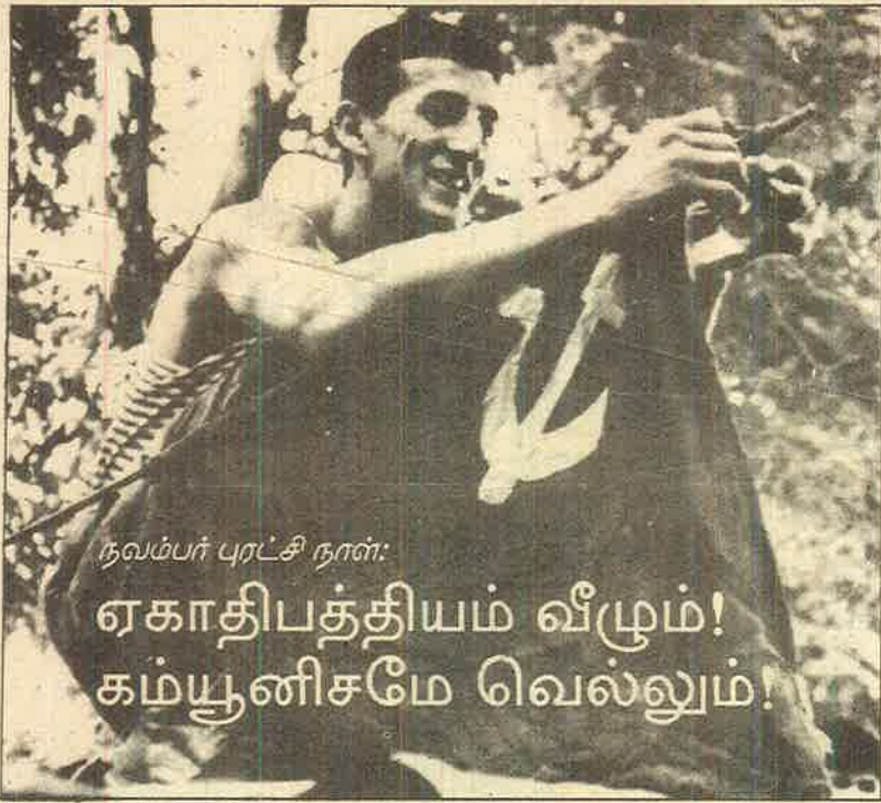
நவம்பர் புரட்சி நான்:

ஏகாதிபத்தியம் வீழும்! கம்யூனிசமே வெல்லும்!