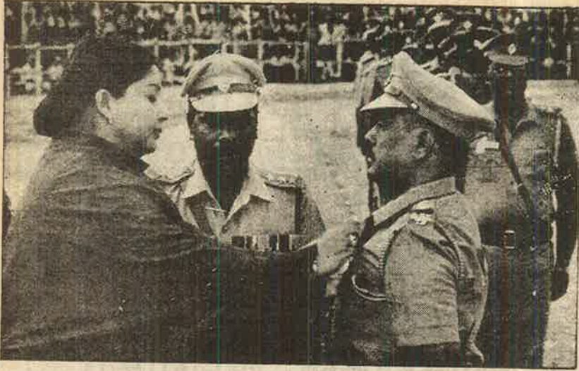
ஜெயலலிதா கொடுக்கும் பதக்கங்களும் பாராட்டுக்களும் தமிழகப் போலீசின் கிரியினல் நடவடிக்கைகளுக்கு 'டானிக்'