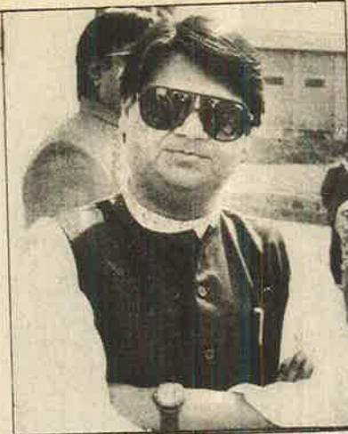
மோசடி மகாராஜா: விமானப் போக்குவரத்து மந்திரி மாதவரால் சிந்தியா

தனியார்மயமாக்குவது, முதலீட்டு விலக்கம் என்கிற பெயரில் பல பொதுத்துறை நிறுவனங்களின் பங்குகளையும் ஒரு சில பங்குச் சந்தைக் தரகர்களும், அரசு -