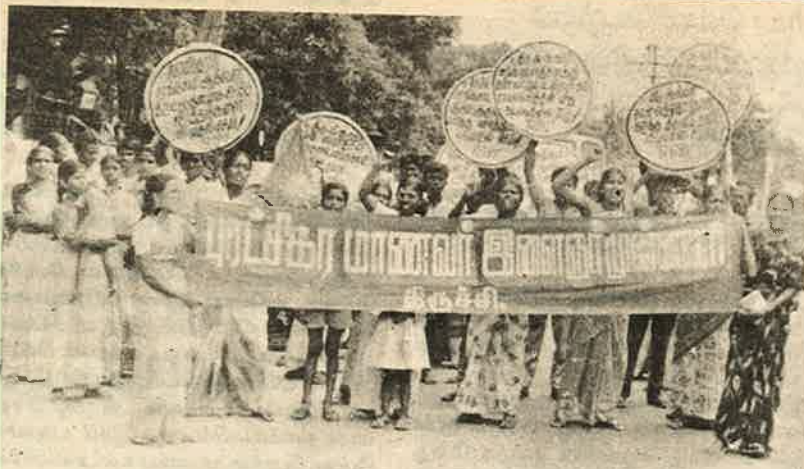
பகுதி கொள்ளையர்களுக்கு எதிராக பு.மா.இ.மு.-வினர் ஆர்ப்பாட்டம்