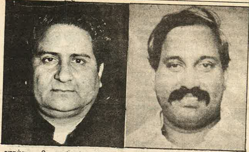
அரசுத்துறை நிறுவனங்களின் நிதியை எடுத்து பங்குச் சந்தையில் சூதாடி ஏப்பம்விட்ட, மத்திய எரிசக்தித்துறை மந்திரி கல்பனாத்ராய்; இரசாயன மற்றும் உர மந்திரி சிந்தாமோகன்.

எரி சக்தித் துறை அதிகாரிகளும் மந் கல்பனாத்ராயும் அறிந்தே இதைச் செய் கள். "சும்மா உபரி"யாக கிடந்த கையை லாபம் ஈட்டும் நோக்கத்துடன் டு செய்ததாக இப்போது இவர்கள் கூறு ர்கள். உண்மை என்னவென்றால் பங் ந்தை சூதாட்டம் உச்ச நிலையில் இருந் து பங்குச் சந்தையில் 624 சதவீதம் ம் ஈட்டும் வாய்ப்பிருந்தது. அதிகபட் 20 சதவீதம் வட்டி தருவதாகக் கூறி புத்த துறை நிதியை எடுத்து 624 சதவீதம் ம் தரக்கூடிய பங்குச் சந்தையில் போட் கள். இந்த யிகையான லாபம் தரக்கர்கள், - அரசு அதிகாரிகள் முதல் மந்திரிகள் பங்கு போட்டுக் கொண்டார்கள். பங் ந்தை - வங்கி மோசடி அம்பலமான பங்குகளின் மதிப்பு திடீர் வீழ்ச்சி ந்தது. தங்களுக்குப் பெரும் நட்டம் வதைத் தடுப்பதற்காக தரக்கர்களுக்கு மாக நிதி தேவைப்பட்டது. ஆகவே து துறை நிறுவனங்களுக்கு 32 சதவீ ரை வட்டி கொடுப்பதாகக் கூறி வங்கி நிறுவன பங்கு முதலீட்டும் போட்டுப்படி கள். இதற்காகவும் வங்கி — அரசு ரிகள், மந்திரிக்கு கமிஷன் தரப்பட் தனால் பங்குச் சந்தை - வங்கி மோச அம்பலமாகிய பிறரும்கூட, முதலீட் காக திரும்பாது என்று தெரிந்ததும்