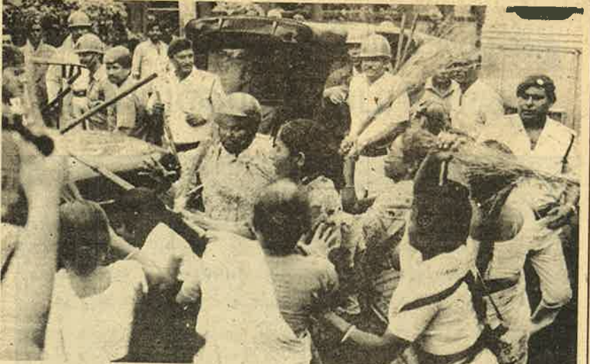
கும்பல் கற்பழிப்பில் ஈடுபட்ட காக்கிச் சட்டை கயவாளிகளுக்கு துடப்பக்கடையால் தரும் அடி. கல்கத்தா மகளிர் அமைப்பினர் நடத்திய நூதன போராட்டம்.