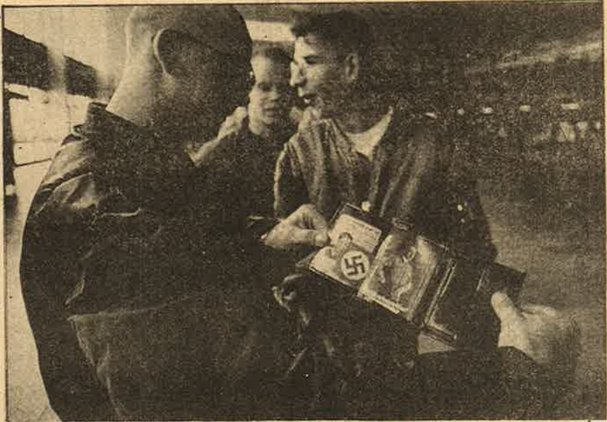
இனவெறி கலாச்சாரம்: மொட்டையடித்துக் கொண்டு தனது “மணிபர்ஸ்”சுக்குள் சுவஸ்திக் சின்னத்துடன் இடலர் படத்தை வைத்து பூஜிக்கும் நவீன நாஜி.

நிறவெறியாட்டம் கோரத்தான்டவமாரும் தென்னாப்பிரிக்காவில் ஏற்கனவே ஏ.பி.பி.பி. (A.W.B.) என்ற பெயரில் இயங்கி வரும் நவீன நாஜிகள் இப்போது புதிய வேகத்துடன் தமது பலத்தைப் பெருக்கிக்கொண்டு கருப்பின மக்களை நாடேயே கடையாடி வருகின்றனர். “அதிபர்டி கிளார்க் கருப்பின மக்களுக்கு சலுகை என்ற பெயரில் அதிகாரத்தையே தாரைவார்த்துக் கொடுத்து விட்டார். இனிமேலும் இதை அனுமதிக்க முடியாது” என்று வெள்ளை நிறவெறி போயர்கள் எச்சரிக்கின்றனர். இந்நூற்றாண்டின் துவக்கத்தில் மஜூபா, மாடெர்ஸ்போண்டின் நகர்களில் கறுப்பின மக்களை துடிக்கத் துடிக்கக் கொன்றொழித்ததைப் போல மீண்டும் ஒரு ரத்த ஆறு விரைவில் உருவாக்கப்படும்; வெள்ளையர் பிராந்தியங்களில் கறுப்பின அடிமைகளுக்கு இடமில்லை; கறுப்பர்கள் ஒருக்காலும் ஆப்பிரிக்காவை ஆளமுடியாது என்று கோக்கரிக்கிறார் நவீன நாஜிக் கட்சியின் தலைவரான யூஜின் டெர்ரிபிளான்ட். கறுப்பர்கள் மட்டுமல்ல; கறுப்பர்களைத் திரும்பும் செய்யும் வெள்ளையர்களும் எங்கள் எதிரிகள்; தூய்மையான வெள்ளை போயர்கள்தான் ஆளத்தகுதி படைத்தவர்கள் என்று கூறும் நவீன நாஜிகள் ஏறத்தாழ 70,000-க்கும் மேற்பட்டோரைக் கொண்ட வலுவான குண்டர் படையை கட்டியமைத்துள்ளனர்.