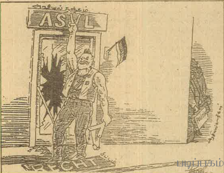
நவீன நாஜிகளின் அட்டுழியங்களைக் கண்டு பயந்து பதறிக் கொள்ளும் ஆறாம் வர்க்க அரசியல்வாதிகள். ஜெர்மானிய பத்திரிகையில் வெளியான கருத்துப் படம்.

அரசியல் தஞ்சம் கோரி அகதிகளாக ஓடிவந்த சிறுபான்மை மக்கள் மீது இன வெறி பிடித்த நவீன நாஜிக் குழுக்கள் நடத்தும் தாக்குதல்கள் அண்மைக் காலமாக தீவிரமடைந்துள்ளன. இடலரின் காலத்தில் இரத்தம் குடித்த ஜெர்மானியத் தெருக்கள் மீண்டும் இரத்தம் குடிக்கின்றன. இடலரின் பாசிச ஆட்சியில் 'லாகர்'களுக்குள் யூதர்களை அடைத்து விஷவாயுவைச் செலுத்திக் கொன்றனர். இன்று இடலரின் வாரிசுகள் தஞ்சம் கோரி வந்த மக்களின் குடியிருப்புகளுக்கு குண்டு வீசுகின்றனர். ஜெர்மானிய தெருக்களில் அந்நிய நாட்டு அகதிகள் சுதந்திரமாக நடமாட முடிவதில்லை. தங்கள் பெயர்களை வீட்டுக் கதவுகளிலிருந்து கிழித்