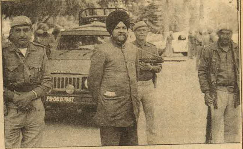
குண்டு துளைக்காத கோட்டு அணிந்து போலீசார் புடகுழ ஒட்டு வேட்டையாடிய பஞ்சாப் வேட்பாளர் - துப்பாக்கி ஜனநாயகம்.

'தேசிய'க் கட்சிகள் இப்படி கள்ளக் கூட்டு சேர்ந்து கொண்டாலும், தீவிரவாதிகள் விடுத்துள்ள தேர்தல் புறக்கணிப்பு அறைகூவலின் காரணமாக நகர்ப்புறங்களில், 20-30 சதவீத வாக்குகளே பதிவாகியது; கிராமப் புறங்களில் 2 முதல் 10 சதவீத வாக்குகளை பதிவாயிற்று. அண்மையில் தீவிரவாதிகளால் சில ஆசிரியர்கள் கட்டுக் கொல்லப்பட்டதால் அரசின் தேர்தல் பணிகளைச் செய்ய ஆசிரியர்கள் மறுத்துவிட்டனர். இடேபோல அரசு ஊழியர்களில் ஒரு டி.பி.ஓ. ஒரு தேர்தல் பணிகளில் ஈடுபட்டார்.