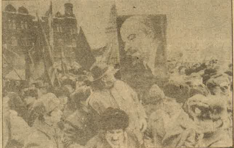
பேரணி நடத்த கட்டணமா? - ரஷிய முதலாளித்துவ சாவாதிக்காரிகளை எதிர்த்து செங்கொடி ஏந்தி தோழர் லெனினைது உருவப்படங்களுடன் மாஸ்கோவில் ஆர்ப்பாட்டம்.

ரஷியாவில் நிலவும் கடுமையான விவையேற்றத்தையும் உணவுப் பஞ்சத்தையும் எதிர்த்து அந்நாட்டு மக்கள் தொடர்ச்சியாக கண்டன ஆர்ப்பாட்டங்களை நடத்தி வருகின்றனர். இதைக் கண்டு அரண்டு போயுள்ள ஆளும் எல்ட்சின் கும்பல், போராட்டங்களை ஒடுக்க புதிய உத்தியை வகுத்துள்ளது. இதன்படி, ஊர்வலமோ ஆர்ப்பாட்டமோ நடத்த வேண்டுமானால் போலீஸ் பாதுகாப்பு மற்றும் போக்குவரத்து கீர்குலைவு ஆகியவற்றுக்கு ஆளும் செலவை ஆர்ப்பாட்டம் நடத்தும் அமைப்பினர் அரசுக்கு செலுத்த வேண்டும் என்று உத்திரவு போட்டுள்ளது. ஏகாதிபத்தியவாதிகள் எல்ட்சினை "முற்போக்கான ஜனநாயகவாதி" என்று புகழ்ந்து தள்ளுவதற்கான காரணம் இப்போது புரிகிறதல்லவா? அவர்களின் அகராதியில் கண்டனப் பேரணி நடத்தக்கூட கட்டணம் வசூலிப்பதுதான் ஜனநாயகம்!