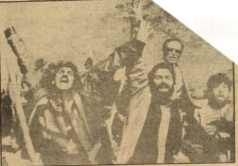
எல்லைக் கோட்டைக் கடக்கும் போராட்டத்தில் காஷ்மீர் விடுதலை முன்னணியின் எழுச்சிக் கோலம், கண்ணாடி அணிந்திருப்பவர் கா.வி.மு. தலைவர் அமானுல்லா கான்.

இதன் காரணமாகவே இந்தியா மட்டுமின்றி பாகிஸ்தானும் கா.வி. முன்னணியை சுடுமையாக எதிர்த்து அடக்குகிறது. அதேசமயம் காஷ்மீரை பாகிஸ்தானுடன் இணைக்கக் கோரும் "ஹிஸ்டுல்", "அல்லா பலிகள்" முதலான முஸ்லிம் மதவாத போராளிக் குழுக்களை ஆதரித்து ஆயுத உதவியும் பயிற்சியும் அளித்து வருகிறது. காஷ்மீர் மக்களின் போராட்டத்தை தனது இந்திய எதிர்ப்பு நோக்கங்களுக்கு ஒரு கருவியாகப் பயன்படுத்திக் கொள்கிறதே தவிர, உண்மையில் காஷ்மீர் மக்களின் சுயநிர்ணய உரிமையை அது ஒருபோதும் அங்கீகரித்ததில்லை. தற்போதைய காஷ்மீர் மக்களின் போராட்டத்தை ஆதரித்து நாடு தழுவிய அளவில் பாக். அரசே கடையடைப்பு நடத்திய போதிலும் போர் நிறுத்த எல்லைக் கோட்டைக் கடக்க முயற்சித்த கா.வி. முன்னணியினர் மீது துப்பாக்கிச் சூடு நடத்தி 10 பேரைக் கொன்றும் பலரைப் படுகாயப்படுத்தியும் அடக்குமுறையை ஏவியது.