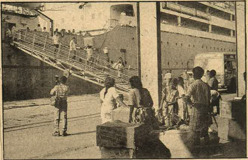
வெளியேற்றப்படும் ஈழ அகதிகள்: இந்திய மேலாதிக்கத்துக்கு பலியாடுகனா?

அரிசி போடுறாங்கள். இந்த ஊர் பண்டி (பன்றி) கூட தின்னாம முகத்தை களிக்கும். வேற வழியில்லாம திண்டு தொலைப்போம். எப்பயாவது வெள்ளையா அரிசி போட்டா 'இண்டைக்குத் தான் பொன்னி அரிசி போட்டிருக்கினம்'