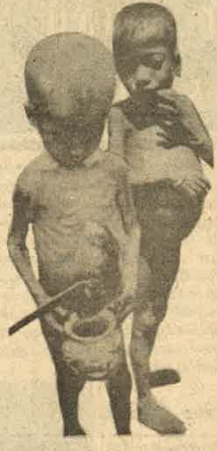
இந்தியாவே கொள்ளையடிக்கப்பட்டு விட்டது; எஞ்சியிருக்கும் சொத்து இக்கூட்டிலிருக்கும் உயிர்கள்தான்!

கடந்த மாதம் தாய்லாந்து நாட்டுத் தலைநகரான பாங்காக்கில் நடைபெற்ற உலக வங்கி இயக்குனர்களின் கூட்டத்தில் நிதி மந்திரி மன்மோகன் சிங்கும் கலந்து கொண்டார். இக்கூட்டத்தில், நலிவடைந்த அரசுத்துறை ஆலைகளை மூடவேண்டும்; அரசுத்துறை நிறுவனங்களின் பங்குகளை தனியாருக்கு விற்கவேண்டும்; அன்னிய வங்கிகள் இந்தியாவில் தடையின்றி செயல்பட அனுமதிக்க வேண்டும் என்று நிபந்தனைகள் விதிக்கப்பட்டன. இவற்றை விசுவாசமாக ஏற்றுக் கொண்ட நிதி மந்திரி, மந்திரி சபையைக் கூட கலந்தாலோசிக்காமல் இந்