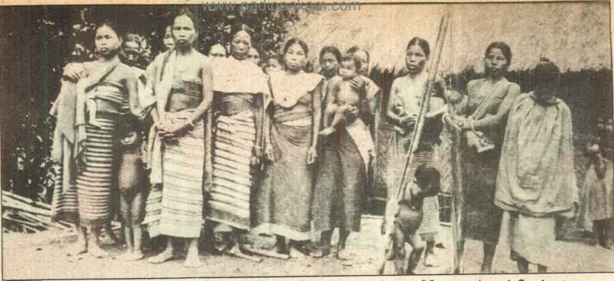
அசாம் துணை ராணுவப் படையின் பாலியல் வன்முறைககு பலியான திரிபுரா பழங்குடிப் பெண்கள்