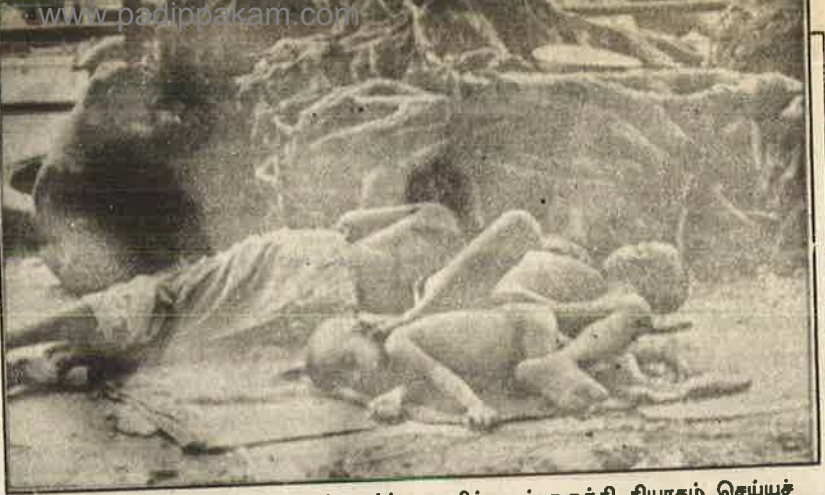
வறுமை உழலும் இம்மக்களைப் பார்த்து வயிற்றைச் சுருக்கி தியாகம் செய்யச் சொல்கிறது ஆளும் கும்பல்.

உணவு, மருந்துவம், முதலானவற்றுக்கான மானியங்கள் குறைக்கப்படுவதால், ரேஷன் கடைகளின் மூலம் வழங்கப்படும் உணவுப் பொருட்களின் அளவு குறைக்கப்படும். அரசு மருத்துவ மனைகளில் தனிச்சிறப்பான மருந்துப் பொருட்கள் இல்லாமல், பொதுவான வலி நிவாரணி மாத்திரைகளே அனைத்து நோய்களுக்கும் சர்வரோக நிவாரணியாக வழங்கப்படும். இதர மானியங்கள் வெட்டப்படுவதால், சாலை, குடிநீர், கழிப்பிட வசதி முதலான அடிப்படை வசதிகள் புறக்கணிக்கப்படும். அதே சமயம் இவை தனியார் முதலாளிகளின் பொறுப்பு