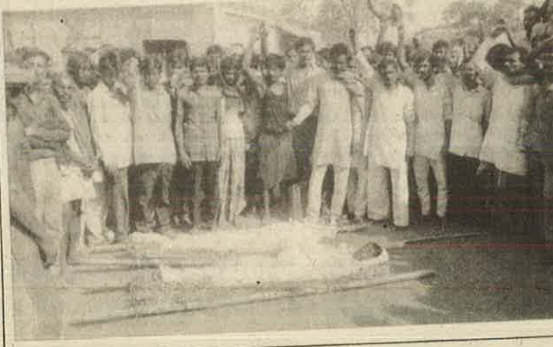
தாழ்த்தப்பட்டோர் கொலைக்கு எதிராக இந்திய மக்கள் முன்னணியினர் ஆர்ப்பாட்டம்.

கடந்த ஜூன் மாதம் 4ம் தேதிய மல்பாரியா கிராமத்தில் புகுந்த ராஜபு சாதிவெறியர்களின் குரிய ஒளி சே