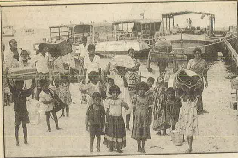
உயிர் பிழைக்கக் கடல்கடந்து ஓடிவரும் அகதிகளை மீண்டும் கொலையாளிகள் டமே ஒப்படைக்க முயல்கிறது இந்திய அரசு.