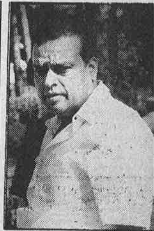
விஜய்மல்லைய்யா, சாராய உடையார் - ஜெயலலிதா ஆட்சியின் புரவலர்கள்.

அடக்கு முறையைக் கட்டவிழ்த்து விட்டுள்ளார். முக்கியமாக ராஜீவ் கொலை விசாரணை இதற்கான முந்திரையாகப் பயன்படுத்தப்படுகிறது.