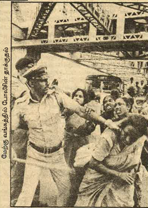
மேற்கு வங்கத்தில் போலீஸின் தாக்குதல்