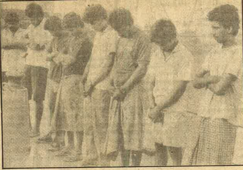
ஆழ்கடலில் இந்தியக் கடற்படையிடம் சிக்கிய புலிகள் இயக்கத்தினர்.