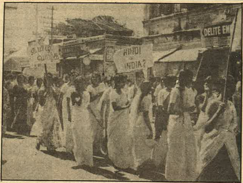
பார்ப்பன பாசிச ஜெயலலிதா கும்பலுக்கு எதிராக மீண்டும் தமிழகத்தில் போராட்டம் எழுச்சி பெறும்.

எனவே இந்தக் கட்சிகளில் உள்ள பார்ப்பனாட்சியைக் இளைஞர்கள் ஒன்று புரட்டுகிற அமைப்புகள், இயக்கங்களின் தலைமையில் திரண்டு பார்ப்பன - பாசிச ஜெயலலிதா கும்பலை எதிர்த்துப் போராட வேண்