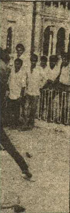
போலிக் தாக்குதலுக்குள்ளான தமிழக மாணவர்கள்