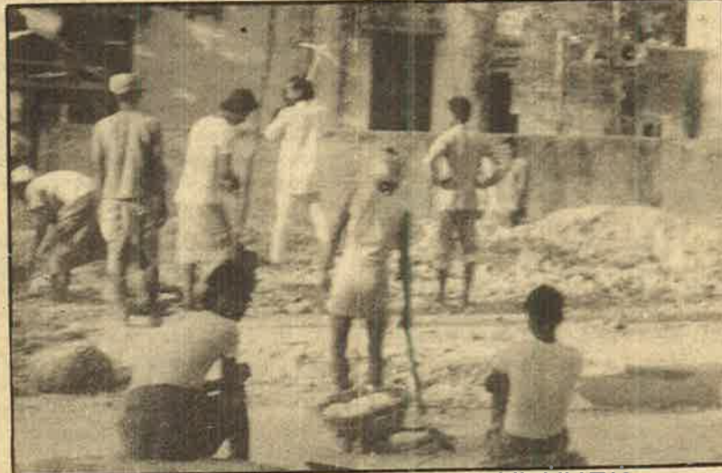
இந்து கோயில்களை இடித்து, தடயங்களை அழிக்கும் கடப்பாறை சேவையில் இந்துவெறியர்கள்.

- இவையெல்லாம் காட்டுவதென்ன? மதவெறியர்களுக்கு மதக் கோட்பாடுகளி லேயே நம்பிக்கையோ அக்கறையோ கிடையாது. மதவெறியும் இனவெறியும் முழுக்க முழுக்க குறிப்பிட்ட அரசியல் பொருளா தார சூழ்நிலைகளிலிருந்து எழுவதாகும். ஆளும் வர்க்கங்கள் தமது அரசியல் பொரு ளாதார நோக்கங்களுக்காக மக்களை அணிக திரட்டுவதற்கான சாதனமாகவும், வர்க்க