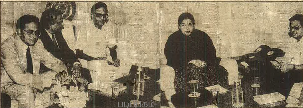
தொழிலதிபர்கள் - முதலாளிகளுடன் கூடிக் குலவும் ஜெயலலிதா; ஏழை மக்களின் 'காவல் தெய்வமாம்'!

எதிரிகளை ஒழித்துக்கட்டி மாமூல் நிலைமை திரும்பாதவரை தேர்தல்களோ, ஜனநாயக - குடியரிமைகளோ கிடையாது; யாருடனும் பேச்சு வார்த்தைகளோ, எந்த வகையிலான சமரசமோ கிடையாது என்று திடவடியாக மறுக்கின்றனர். இந்த நிலைமைகளையே காட்டிப் பீதியூட்டியும் இந்துத்து, "தேசிய" வெறியூட்டியும் ஆட்சியைப் பிடிப்பதையும் தமது அரசியலாக்கி விட்டார்கள். கடந்த 10, 15 ஆண்டுகளில் நாட்டின் பல பகுதிகளிலும் காங்கிரசு, பாரதீய ஜனதா பாசிச இந்துத்து வெறியர்கள் ஏற்படுத்தியுள்ள இந்த நிலைமைகளைத் தமிழ்நாட்டில் ஒரு சில மாதங்களிலேயே பார்ப்பன - பாசிச ஜெயலலிதா கும்பல் உருவாக்கிவிட்டது. பஞ்சாபில் அகாலி கட்சிகள், காஷ்மீரில் ஐந்து கட்சிகள் கூட்டணி, அசா