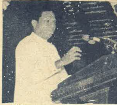
இந்திய எதிர்ப்பாளரான பிரேமதாசா

எனவே சாரக் கூட்டமைப்பில் இந்திய மேலாதிக்க எதிர்ப்பு நிலை பலம் பெறுவதற்குள் அதை முளையிலேயே கிள்ளியெறிய இந்தியா பல்வேறு சதிகளில் இறங்கியது. சாரக் மாநாடு நடைபெறும்போது இக்கூட்டமைப்பில் அங்கம் வகிக்கும் 7 நாடுகளின் தலைமைப் பொறுப்பிலுள்ள அதிபர்களும், பிரதமர்களும் மன்னர்களும் தவறாமல் பங்கேற வேண்டும் என்பது விதி. இதை சாதகமாகக் கொண்டு, மாநாட்டில் பூடான் மன்னர் பங்கேற்க கூடாது என இந்தியா இரகசியமாக மிரட்டியது. தான் வெளிநாட்டுக்குச் செல்லும் நேரத்தில் தேசவிரோத சத்திகள்