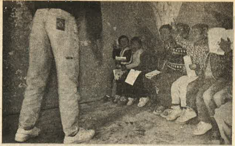
'இன்அபதா' இயக்கச் சிறுவர்கள்; தேச விடுதலை வீரர்கள்.