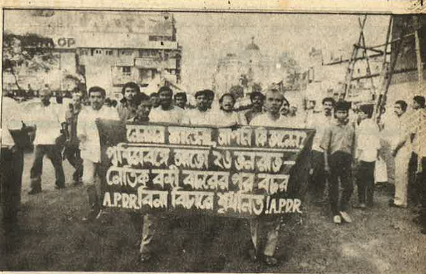
மே.வங்க போலீசு ராஜ்ஜியத்தை எதிர்த்து ஆர்ப்பாட்டம்; நக்சல்பாரி அரசியல் கைதிகளை விடுவிக்கக் கோரி போராட்டம்.

வாய்க்கொழுப்போடு பேசினார் 'மார்க்சிஸ்டு' முதல்வர் நாயனார். வகுப்பு வாதத்தை எதிர்ப்பதாகக் கூறும் போலிகளின் ஆட்சியில் இந்துவெறி ஆர்.எஸ்.எஸ். - பாரதீய ஜனதா அச்சுறுத்தும் சக்தியாக வளர்ந்து விட்டது. பெருமுதலாளிகளின் ஆதிக்கத்தை எதிர்ப்பதாகக் கூறிய 'மார்க்சிஸ்டுகள்' இப்போது டாட்டா - பிரீவா - அம்பாணி - தாப்பர் முதலான தரகுப் பெருமுதலாளிகளை சிவப்புக் கம்பளம் விரித்து வரவேற்கின்றனர். மே.வங்கத்தைப் போலவே கேரளாவிலும் விலையேற்றத்தையும், புதியவரி களையும் மக்கள் மீது திணித்தனர். எல்லா வற்றையும் விட புதிய சாராயக் கொள்கையை வகுத்து, சாராய முதலாளிகளின் கூட்டாளிகளாக மாறியது 'இடதுசாரி'களின் ஆட்சி. ஊருக்கு உபதேசம் செய்யும் 'மார்க்சிஸ்டு' தலைவர்கள் தமது மகன் திருமணத்துக்கு வரதட்சிணை வாங்குவது, ஐந்து நட்சத்திர கலாச்சார பாணியில் ஆடம்பரத் திருமணம் நடத்துவது, வெளிநாடுகளுக்கு அரசு செலவில் ஊதாரித்தனமாக உல்லாசப் பயணம் போவது என்பதாக கசப்போகத்தில் நீச்சலடித்தனர்.