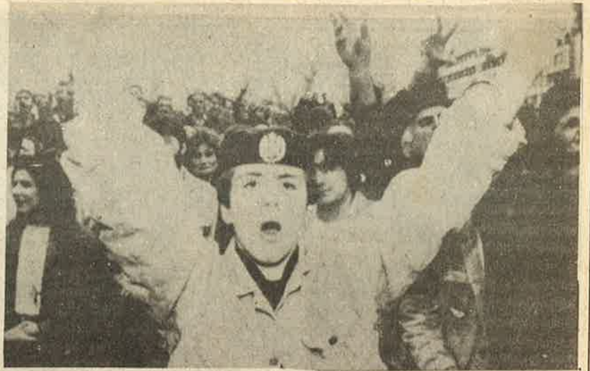
செர்பியக் குடியரசு மக்களின் 'சுதந்திர'த்திற்கான ஆர்ப்பாட்டம்.

எப்போதெல்லாம் அரசியல் பொருளாதார நெருக்கடிகள் முற்றினவோ அப்போதெல்லாம் தேசிய இன முரண்பாடுகளும் கூர்மையடைந்திருக்கின்றன என்பதையே யூகோஸ்லாவியாவின் வரலாறு காட்டுகிறது. 2.3 கோடி மக்கள் தொகையுள்ள நாட்டின் அந்நியக் கடன் 34,200 கோடி ரூபாய். இதன் விளைவாக சமீபகாலங்களில் பணவீக்கம் 2000% த்தை எட்டி