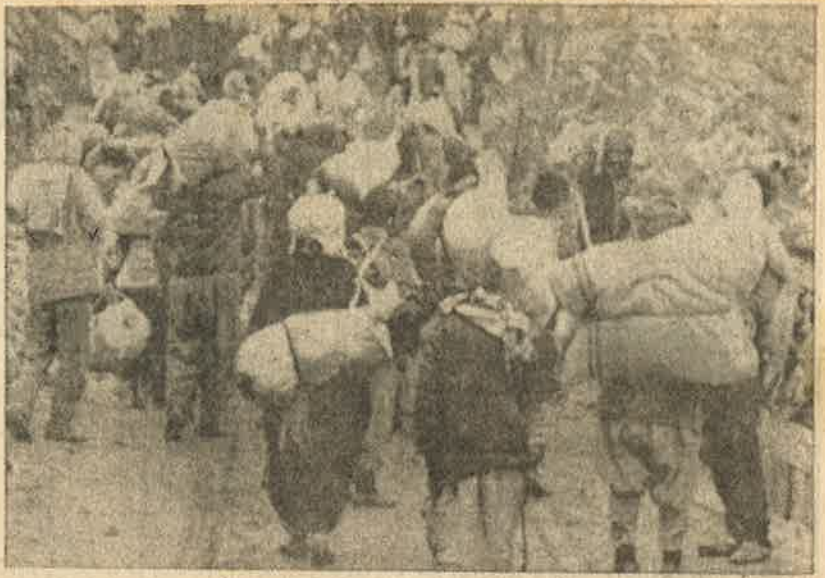
குர்திஷ் அகதிகள்; சதாம் உசேன் அரசின் கோர தாக்குதலுக்கு ஆளானவர்கள்.

துருக்கியைப் போலன்றி, ஈரான் சிரியா ஆகிய நாடுகளில் வாழும் குர்திஷ் மக்களுக்கு ஈராக்கில் உள்ளதைப் போல பெயரளவிலான உரிமைகள் வழங்கப்பட்டுள்ளன. இருப்பினும் எண்ணிக்கையில் மிகக் குறைவாக இருப்பதால் அவர்கள் ஐக்கியப்பட்டு போராட்டங்களை நடத்த முடிவதில்லை. இந்நாடுகளை விட ரஷ்யாவின் காசுஸ் பிராந்தியத்தில் வாழும் குர்திஷ் மக்கள் ஒப்பீட்டளவில் கூடுதலாக சலுகைகளையும் உரிமைகளையும் பெற்றுள்ளார்கள்.