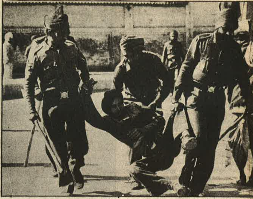
'அரசுக்கு எதிராகப் போராடுபவர்கள் அனைவரும் பயங்கரவாதிகள்!'

(1989 நவ ஆதாரம்: நாடாளுமன்ற அதி கார பூர்வ அறிக்கைகள்)