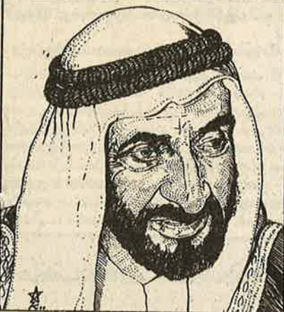
மோசடி வங்கியின் அதிபரும் அப்தாபி மன்னருமான டேக் சையத்.

பின்னர் காங்கிரசுக்காரர்கள் கூட்டம் நடத்தினாலும் அதில் "இவர்கள் இத்தகைய போக்குடையவர்கள்தான். ஆலையிலே இருக்கின்ற வேறுபல பிரச்சினைகளைப் பாருங்கள்" என்று கூறி ஆலை கேள்மன் புதிய சம்பள பிரச்சினை, பதிலி, பெர்மனென்ட், வேலை மாற்றிக் கொடுப்பது போன்றவற்றைப் பேசினார். தோழர்களின் உறுதியான தொடர் நடவடிக்கைக்கும் சரியான கருத்துக்கும் முகங்கொடுக்க முடியாமல் காங்கிரசுக்காரர்கள் இப்படி மறைமுகமாக பின்வாங்கி கொண்டு தங்களை யார் என்று இனங்காட்டிக் கொண்டனர்.