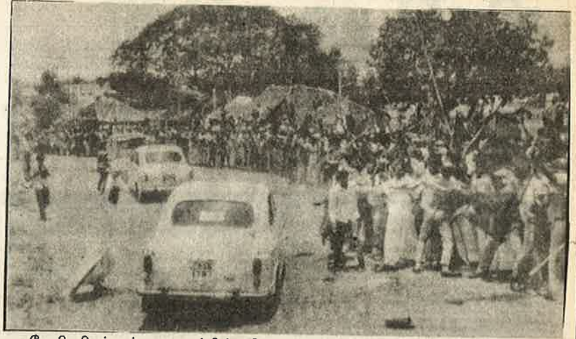
துரோகி சிதம்பரம் வாகனத்தின் மீது தாக்குதல்: காவிரி நீருக்கான உரிமைப் போரல்ல; அரசியல் ஆதாயத்துக்கான நாய்ச்சண்டை.

எனவே அதிகார செல்வாக்கு மிக்க சோனியா கோஷ்டியை ஆதரிப்பது, அதற்காக வாழப்பாடி கோஷ்டியைப் பயன்படுத்திக் கொள்வது, நரசிம்மராவ் - மூப்பனார்