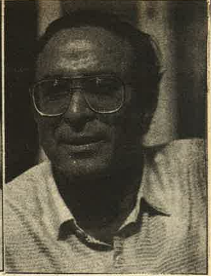
ஜெய்பால் ரெட்டி; வி.பி.சிங்கின் பிணியி.

உறுப்பினராகலாம்! பிறகென்ன... பத்தே நாளில் லட்சக்கணக்கான உறுப்பினர்களை சேர்த்துவிட்டு கட்சி தேர்தலை சந்திக்க தயாராக இருந்தனர் காங்கிரசு தலைவர்கள்! பிறகு ஒருவருக்கொருவர் குடுமியை பிடித்துக் கொண்டு தேர்தலை தள்ளி வைத்து விட்டனர்.