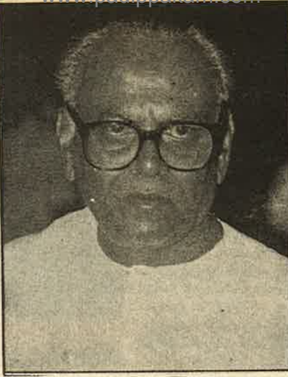
பொம்மை; தேவிலாவின் துருப்புசீட்டு

அரசியல் நாகரீகம், ஜனநாயக முதிர்ச்சி என்று பிலுக்கு தனம் செய்யும் வி.பி.சிங் கட்சியின் யோக்கியதை இதுதான். இந்தியாவின் தலைவிதியையே மாற்றிய மாபெரும் தலைவர்கள், கடுமையான சூழ்நிலையில் அனைவரையும் அரவணைத்து கட்சியை கட்டி ஆட்சியைப் பிடித்தவர்கள், தியாக சீலர்கள், நிதானம் மிகுந்தவர்கள், பொறுமை சாலிகள். அதே நேரத்தில் அசைந்து கொடுக்காத ஜனநாயக கொள்கை பிடிப்புள்ளவர்கள் என்று ஒப்பனையெல்லாம் களைந்து மூக்கு வெளுத்து போனார்கள். வெளி உலகுக்கு எப்போதாவது ஜனநாயக நாடகம் போட வேண்டி வரும்போது அதையும் தங்களை வழுக்கமான மஃபியர் கும்பல் பாணியிலேயே அரங்கேற்றுகின்றனர். ஒரு நாள் கூத்துக்கு மீசை வைக்கும் போது இப்படி சந்தி சிரித்து விடுகிறது மறுபுறம் 17 ஆண்டுகாலமாக உட்கட்சி தேர்தல் நடத்தாமலேயே அப்பட்டமாக கொடுங்கோல் மன்னர்கள் பாணியிலான கட்சி நடத்துகிறது காங்கிரசு அதன் கீழிருந்து அதிகாரத்தை கலைக்கும் அடிமைகளான வாழப்பாடி, மூப்பனார் கூட்டம் ஜனநாயகத்தை பற்றி வாய்கிழிய பேசுவதுதான். இந்திய 'ஜனநாயக'த்தின் சிறப்பம்சம்! எங்காவது பொது தேர்தலில் மண்ணை கவ்வினால் எதிர் கோஷ்டி முணுமுணுத்தால் அவர்களை மிரட்ட உட்கட்சி தேர்தலைப் பற்றி காங்கிரசு பேசும். '87 ஆம் ஆண்டு இப்படித்தான் உட்கட்சி தேர்தலுக்கு நாள் கூட குறித்து சவடால் அடித்தார் ராஜீவ் உடனே அதிகாரத்திலிருந்து மாநில தலைவர்கள் அனைவரும் வேட்பாளர் பட்டியலையே கட்சி உறுப்பினர்கள் எண்ணிக்கையில் சேர்த்து விட்ட, கதை வெளியில் வந்தது. 25 ரூபாயை கட்டினால் 25 பேர் மொத்தமாக யார் வேண்டுமானாலும் காங்கிரசு கட்சி