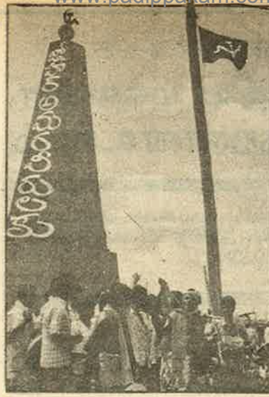
செங்கொடி விண்ணில் உயர, தியாகிகள் நினைவுத் தூண் அருகே வீரவணக்கம் செலுத்தும் விவசாயிகள்.