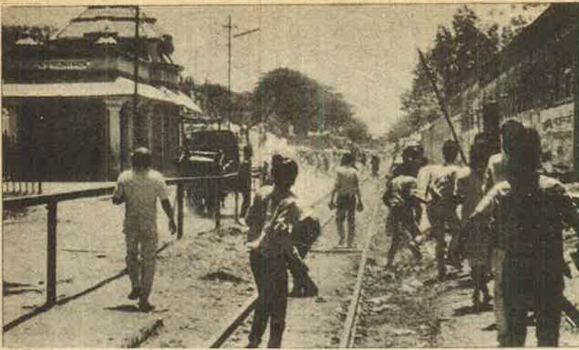
மதுரா நகரில் 'கிருஷ்ண ஜென்மபூமியை' விடுதலை செய்ய கலவரத்தில் இறங்கும் இந்து வெறியர்கள்.