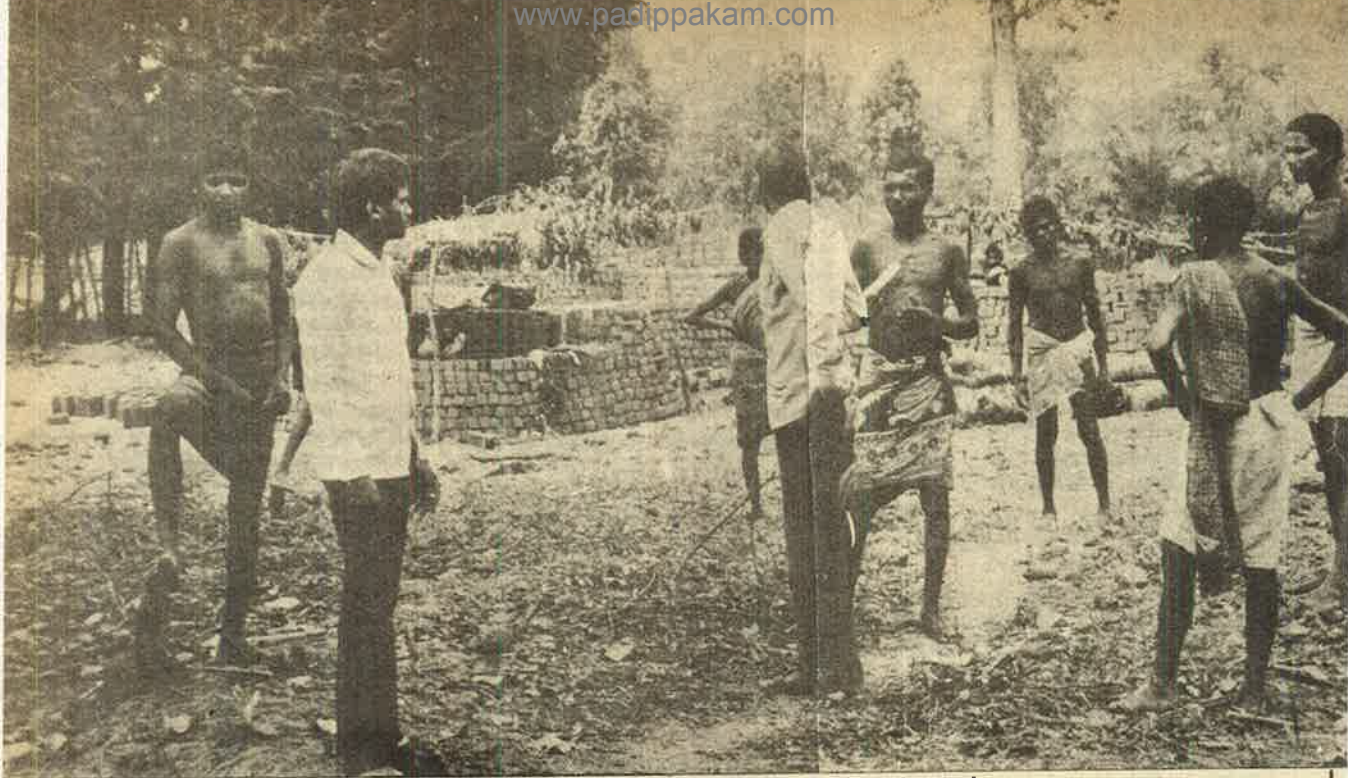
கார்கேலி கிராமம். சூடியேறிய அரசு அதிகாரிகளுக்கு வீடு கட்டும் பழங்குடிகள்; அதிகார வர்க்கம் முன்னேற்றத்திற்கு உதவவில்லை பெரும்சுமையாக அவர்களை அழுத்துகிறது.

திய ஆட்சியாளர்களும் அதையேதான் பின் பற்றுகிறார்கள். இரண்டு பேருக்கும் எந்த வொரு வித்தியாசமும் இல்லையென்பதையே இது நிரூபிக்கிறது" என்று தோலுரிக் கிறார்.