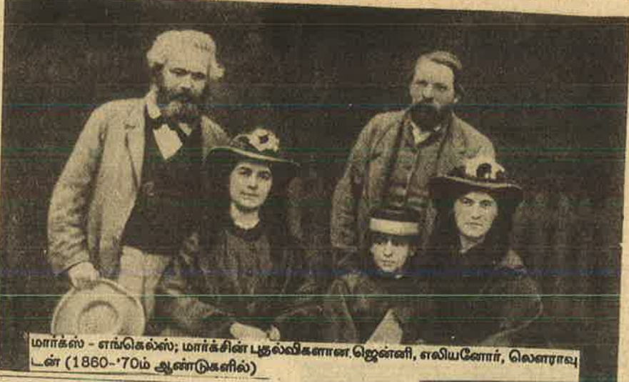
மார்க்ஸ் - எங்கெல்ஸ்; மார்க்சின் பூதல்விகளான ஜென்னி, எலியனோர், லெனாராவுடன் (1860-'70ம் ஆண்டுகளில்)

"1988 மே மாதத்திலேயே 'உண்மை' ஏட்டிற்கு ஒரு சவால் என்ற கட்டுரையை 'புதிய ஜனநாயகம்' எழுதியிருந்தும் இதுவரை பதில் எழுதவில்லை. இவ்வாறு உரிய அளவுக்கு உழைக்காமல் - அதுவும் சம்பளத்துக்கு வேலை செய்யும் - 'உண்மை' குழுவை பார்ப்பனத்தனமாக எழுதுகிறது என்று கூறலாமா?"