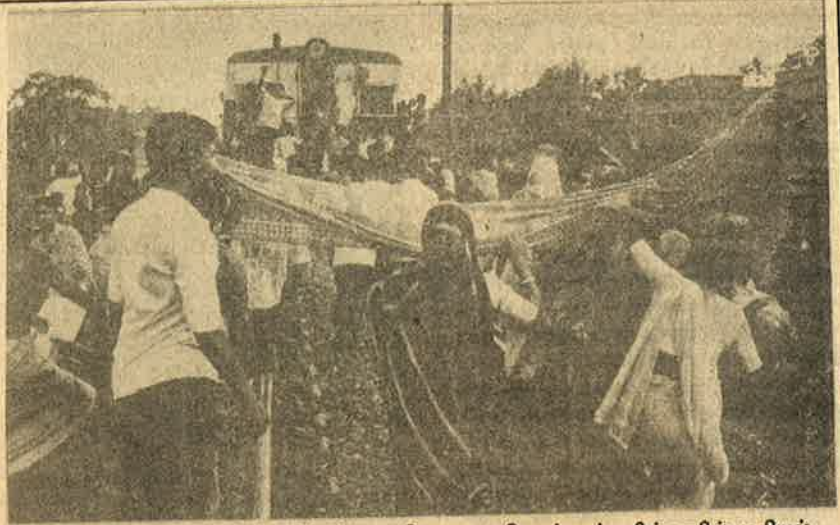
-பிராட்டியில் நடந்த கற்பழிப்புக்கு எதிராக பகுதிவாழ் மக்களின் ரயில் மறியல் போராட்டம். 'மார்க்சிஸ்டு' மாதர் சங்கம் இக்கற்பழிப்பு கொடுமைக்கு எதிராக வாய் திறக்கவில்லை.