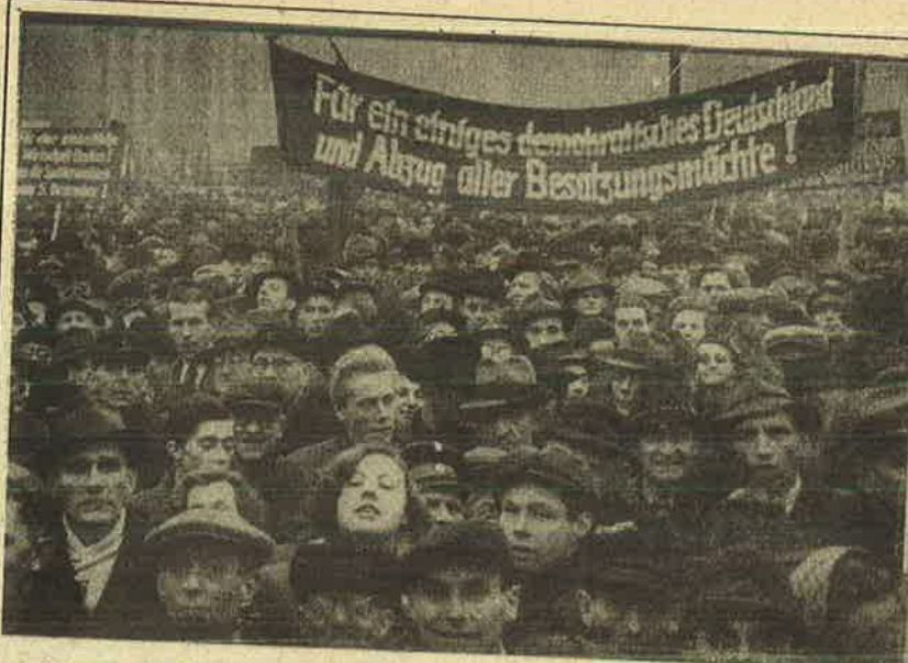
ஜூன் 1948ல் மேற்கு ஜெர்மனியில் புதிய நாணய முறையை ஏகாதிபத்தியவாதிகள் உருவாக்கியதை எதிர்த்து மேற்கு பெர்லின் நகரத் தொழிலாளர்களின் ஆர்ப்பாட்டம்.

வும் கொண்டு கம்யூனிஸ்டு கட்சியும், சமூக ஜனநாயகக் கட்சியும் ஐக்கிய சோசலிசக் கட்சி எனும் பெயரில் ஏப்ரல் '46 இல் ஒன்றிணைந்தன.