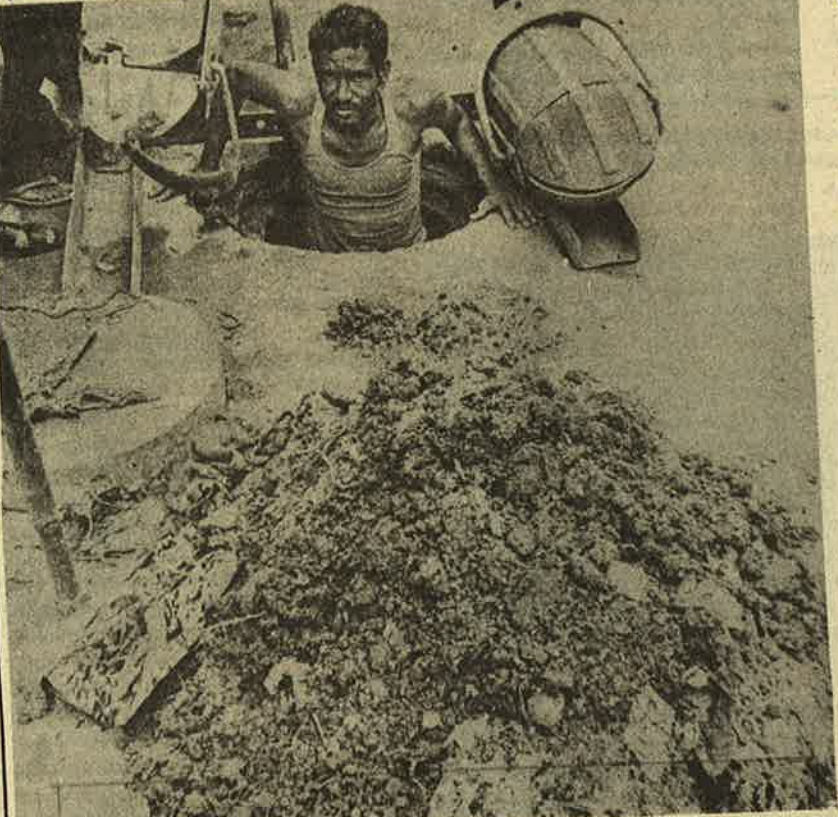
பாதுகாப்பு சாதனமின்றி பாதாள சாக்கடையில் இறங்கி அடைப்புகளை நீக்கும் நகரகத்தி தொழிலாளர்.