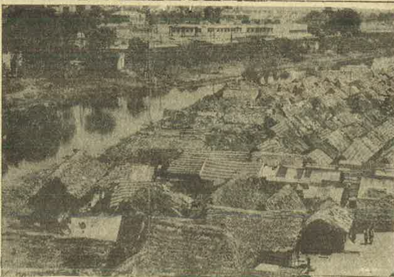
நகரசுத்தி தொழிலாளர்களின் நூக வாழ்க்கை.