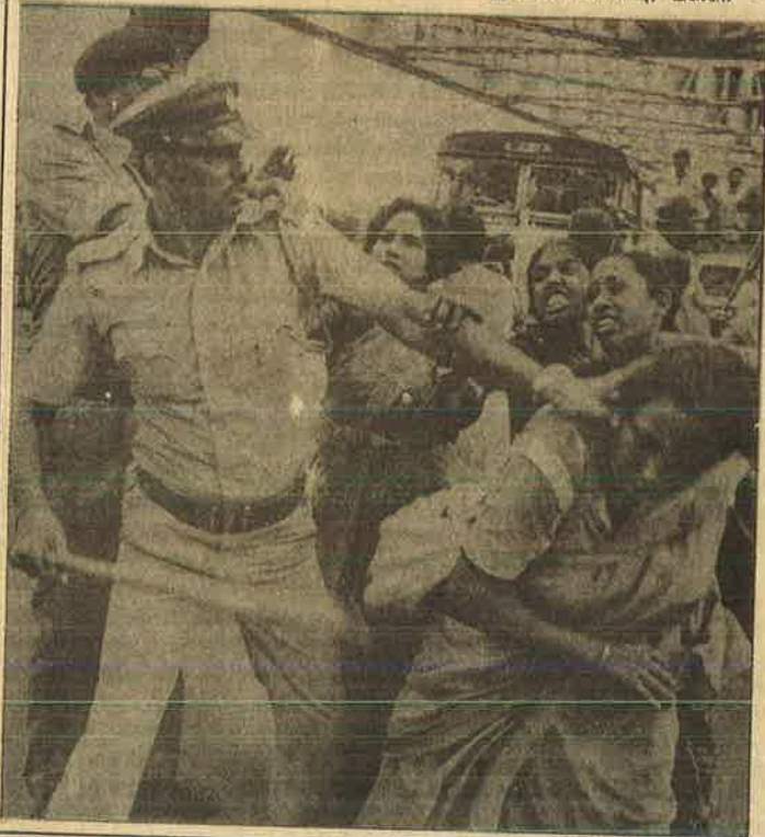
கல்கத்தாவில் பேருந்துக் கட்டண உயர்வை எதிர்த்துப் போராடுவோரின் மண்டையைப் பிளக்கும் போலீசு, உழைக்கும் மக்களுக்கான ஆட்சியா?

இதுவே இப்போது மே.வங்க வாலிபர் சங்கத்தின் புரட்சிகர நடவடிக்கையாகி விட்டது. ஆளும் 'இடதுசாரி' அரசை விமர்சிப்போரும், அதன் மக்கள் விரோத செயல்பாடுகளை அம்பலப்படுத்துவோரும் புரட்சியின் எதிரிகளாகத் தாக்கப்படுவதுதான் தொடர்கிறது. அதற்கேற்ப இளைஞர் அமைப்புகளின் தன்மையும் மாறி, புரட்சிகர உணர்வு கொண்ட இளைஞர்களுக்குப் பதிலாக குண்டர் படை பாசனாயகியினிடது.