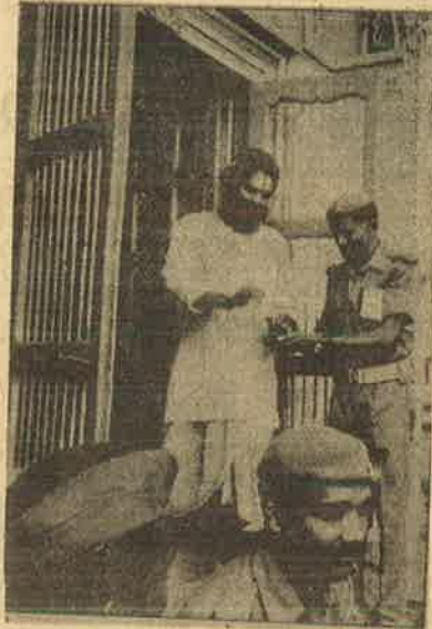
மகுதி மீது தாக்குதல் முடிந்த பிறகு, இந்து வெறிப் பண்டாரம் அளிக்கும் பிரசாரத்தை பயபத்தியுடன் வாங்கிக் கொள்ளும் போலீசு.

ஆனால் அப்போத்தியிலேயே பஞ்சகோசி சர்வதேச செய்தி நிறுவனம் என்கிற இந்து மதவெறியர்களின் அமைப்பு ஒலி - ஒளி அஞ்சல் மூலம் லண்டன், நியூயார்க் போன்ற நகரங்களில் உள்ள வானொளி, வானொளி செய்தி நிறுவனங்களுக்குத் தகவல் அனுப்பியது. மூன்று குவிமாடங்கள் தகர்க்கப்படுவதை பி.பி.சி. அறிவித்தது; அடுத்தநாள் படத்துடன் செய்திகள் வந்தன. இடிப்பு வேலையைத் தடுக்க முடியாமல் போனதற்கு வி.பி.சிங் - முலயாம்சிங் நிர்வாகத்தைக் கண்டிப்பதற்குப் பதில் செய்தி வெளியிட்ட, பத்திரிக்கைகள். மீதுதான் போலி கம்ப்யூனிஸ்டுகள் முதலானவர்கள் பாய்ந்தனர்.