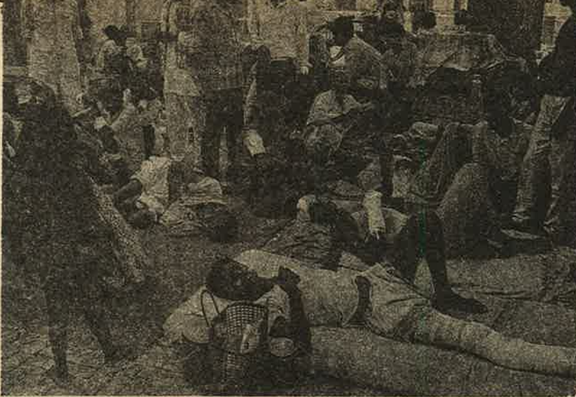
ஆக்ரா மருத்துவமனை; சாதிக் கலவரத்தில் பாதிக்கப்பட்ட மக்கள்.