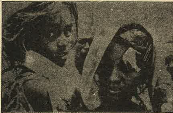
ராஜஸ்தான் மந்தாவரி கிராமம்; மேல்சாதி இந்துவெறியர்கள் கஞ்சார் பழங்குடிகளைத் தாக்கி ஏழு பேரை வெட்டிக் கொன்றனர். படத்தில் - பாதிக்கப்பட்டவர்கள்.

யர்கள் ஹோலி பண்டிகையின் களி வெறியாட்டத்தில் மூழ்கினர். தாழ்த்தப்பட்டவர்களை பறையடிக்கச் சொல்லி தாழ்த்தப்பட்ட குடும்பப் பெண்களை நிர்வாணமாக ஆடும் படி நிர்ப்பந்தித்தனர். அவர்கள் மறுக்கவே அடியாட்களை வைத்து உதைத்து அவமானப்படுத்தி ரசித்தனர். அதிகாரத்தை காண்பிக்க அவர்களின் குடிசைகளை கொளுத்தி பாத்திரங்கள், தானியங்களை அழித்தனர்.