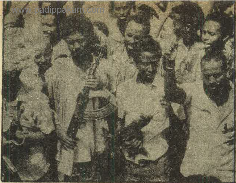
சோமாலியாவின் ராணுவ சர்வாதிகார ஆட்சிக்கெதிராக கிளர்ந்தெழும் தேசிய மக்கள் இயக்கப்படல்.

ஆப்பிரிக்காவில் இருந்து அடிக்கடி வரும் செய்திகள், தென் ஆப்பிரிக்க பாசிச அரசின் மிருகத்தனமான நிற - இன வெறிக் கொடுமைகள்; அல்லது ஆட்சிக் கவிழ்ப்புகள்; அல்லது பெருந்திரளான பட்டினிச் சாவுகள். உலகின் துயரமிகு மையமாகவும் அதேசமயம் எழுச்சி என்னும் வெடி மருந்துக் கிடங்காகவும் அந்த 'இருண்ட கண்டம்' இருப்பதையே இந்தச் செய்திகள் குறிக்கின்றன.