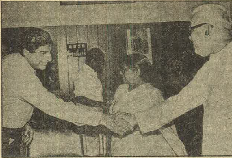
கொள்கைக்கு 'டாடா': தரகுப் பெருமுதலாளி டாட்டாவின் வாரிசு ரத்தன் டாடாவுடன் கைகுலுக்கும் 'மார்க்சிஸ்டு' முதல்வர் நாயனார்; அருகில் தொழிலமைச்சர் கே.ஆர்.கெளரி.