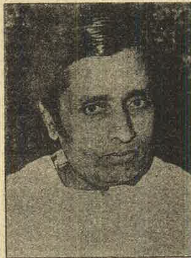
மத்தியப் பிரதேச மாநில முதல்வர் சந்தர்லால் பட்டவா.

போபால் விஷவாயு "விபத்தில்" பாதிக்கப்பட்டவர்களுக்கு 6 ஆண்டுகளுக்கு பிறகும் நீதி கிடைக்கவில்லை. அமெரிக்க ஏகாதிபத்திய பன்னாட்டு நிறுவனம் இழைத்த இந்த தேசிய அவமானத்திற்கு நியாயமான நீதிகேட்க தனது அதிகாரத்தை பயன்படுத்தவில்லை. மாறாக, ஏற்கனவே வாழ்க்கையும் உடல் நலத்தையும் இழந்த - விஷவாயுவால் பாதிக்கப்பட்ட மக்களை அவர்களின் குடிசைகளிலிருந்து விரட்டியது. ஏறக்குறைய 4000 ஏழை குடும்பங்களை நடுத்தெருவுக்கு தள்ளியது. முக்கிய சாலைகளையும் சந்தைகளையும் காங்கிரசுக் காரர்கள் ஆக்கிரமித்துக் கொண்டு குடிசைகளைக் கட்டி வாடகை வசூலிக்கிறார்கள் என்று கூறியது. வசிப்போர் பெரும்பாலும் ஏழை முஸ்லிம்கள். இவ்வாறு அடுத்தகூட