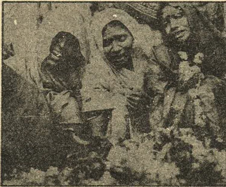
குஜராத்: கள்ளச்சாராய சாவு; குற்றவாளிகள் தண்டிக்கப்படவில்லை.

இதே போல், பீடி இலை பறிப்பதில் ஈடுபடும் 2 லட்சத்திற்கும் மேற்பட்ட பழங்குடிகளுக்கும் தாழ்த்தப்பட்டவர்களுக்கும் கூலி உயர்வு, சிறு தொழிலாளிகளுக்கு குறைந்தபட்ச விலையில் பீடி இலையும் வழங்குவதாக தேர்தல் வாக்குறுதி அளித்தது. ஆனால் ஆட்சிக்கு வந்த பிறகு கிடைத்துக் கொண்டிருந்த கூலிக்கும் வேட்டு வைத்தது. கூட்டுறவு நிறுவனங்கள் நேரடியாக பெற்றிருந்த பீடி இலை கொள்முதலை தனி