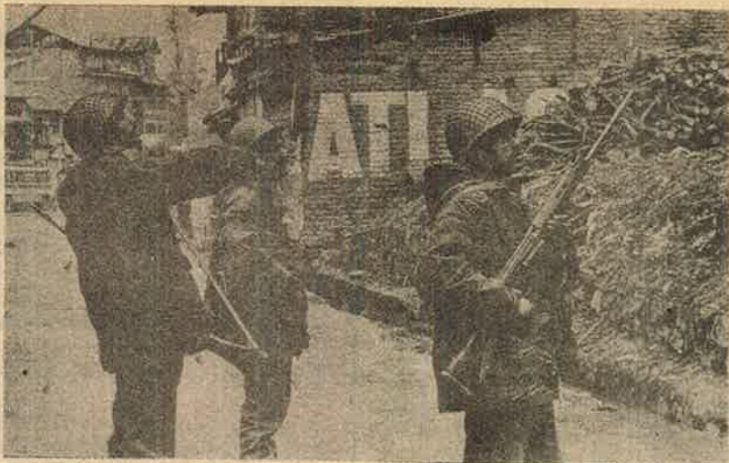
காஷ்மீர் நகர வீதிகளில் வேவு பார்க்கும் இந்திய ராணுவம். காலனியாதிக்கப் போராசை!

இச்செய்தி கேட்டு பேரதிர்ச்சி அடைந்த குடியரசுத் தலைவரும் பிரதமரும் இனிமேலும் பொறுத்துக் கொண்டிருக்க