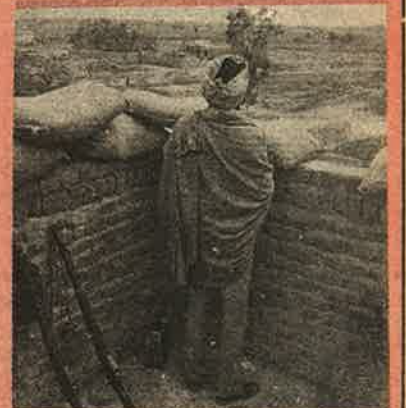
கிராமத்தில் ஆயுதம் ஏந்தி நிற்கும் அரசின்கையான். மதவாத, பயங்கரவாதத்தை எதிர்ப்பதாகக் கூறி கட்டவிழ்த்து விடப்படும் அரசு பயங்கரவாதம்.

வினரவில் தோதல் நடத்தி, பஞ்சாபை ஜனநாயக நீரோட்டத்தில் இணைப்போம் என்று வாக்குறுதி அளித்த தேசிய முன்னணி அரசு, இப்போது இந்து வெறியர்களுக்கு