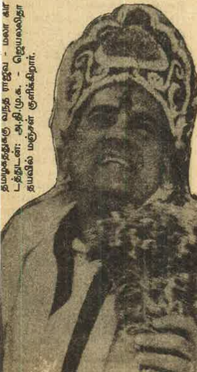
தமிழகத்துக்கு வந்த ராஜீவ் - மலர் கி டத்துடன்: அதி.மு.க. - ஜெயலலிதா தயவில் மஞ்சள் குளிக்கிறார்.