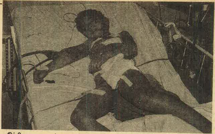
இந்திய அரசு பயங்கரவாதத்துக்கு இரையாகி உயிருக்குப் போராடும் காஷ்மீர் சிறுவன்.

இந்திய ராணுவம் காஷ்மீர் போலீசை சுட்டுக் கொன்றதை எதிர்த்து போலீசினர் கலகம்.