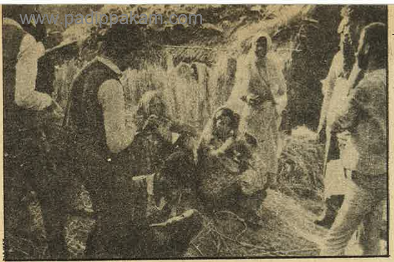
படுகொலைகளுக்குப் பிறகு பிதா கிராமம்.