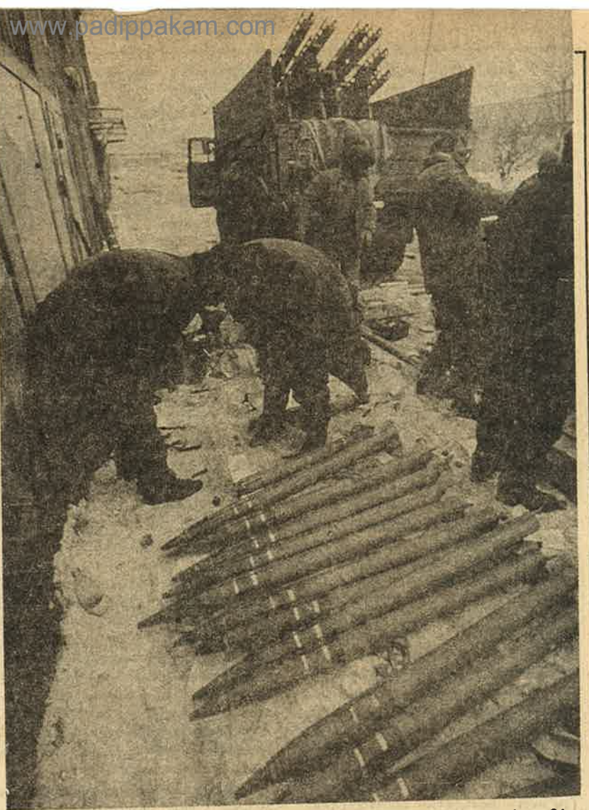
அஜர்பெய்ஜான் போராட்டத்தை ஒடுக்க எல்லையில் ஏவுகணைகளைக் குவிக்கும் ரஷிய ராணுவம். இதுவும் சோசலிசம் என்பதுதான். போலிகளின் நிலைப்பாடு.

இப்போது திடீரென முந்தைய ஆட்சியாளர்கள் சோசலிசப் பாதையில் இருந்து விலகிச் சென்றதாகக் குற்றம்சாட்டி, கிழக்கு ஐரோப்பிய மாற்றங்களை வரிந்து கட்டிக் கொண்டு ஆதரிக்கின்றனர். இதுநாள்வரை முந்தைய போலி சோசலிச ஆட்சியாளர்களையும் ஆட்சியையும் நியாயப்படுத்தியது தவறு என்று பொறுப்பேற்கும் நேர்மை கூட அவர்களிடம் அறவே இல்லை. இப்படிச் செய்வது மக்களையும் அணிகளையும்