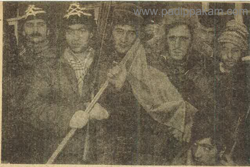
ரவியாவின் புதிய ஜாக்கனிடமிருந்து பிரிந்து போகும் உரிமைக்கான போராட்டத்தில் ஆயுதமேந்தி நிற்கும் அஜர்பெய்ஜான் போராட்டக்காரர்கள்.

ரஷ்யா மற்றும் கிழக்கு ஐரோப்பிய நாடுகளில் ஏற்பட்டுவரும் மாற்றங்கள் பற்றி இதுநாள் வரை கருத்து ஏதும் கூறாமல் ஊமைக் கோட்டான்களாக இருந்த போலிக் கம்யூனிஸ்டுகள், இப்போது வாப்திறந்து சந்தர்ப்பவாத முத்துக்களைக் கொட்டுகின்றனர். இம்மாற்றங்கள் குறித்து கட்சித் தலைவர்கள் - அணிகளிடையே குழப்பம் ஏற்பட்டு ஆளுக்கொரு வியாக்கியானத்தை அவிழ்த்து விட்டதாலும், பரிசாசம் செய்யும் முதலாளித்துவப் பத்திரிகைகளுக்குப் பதில் சொல்ல வேண்டிய நிர்பந்தம் ஏற்பட்டதாலும் போலிக் கம்யூனிஸ்டுகள் தத்தமது தலைமைக் கமிட்டிகளைக் கூட்டி தீர்மானங்களை வெளியிட்டுள்ளனர்.