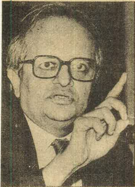
நிதிச் செயலாளர் பிமல் ஜலான்

களிலும் இப்படித் தமக்கு விசுவாசமான அதிகாரிகளைத் தேடி உயர்பதவிகளில் அமர்த்துகின்றனர். 1977ல் ஐனதாவும், 1980ல் மீண்டும் இந்திராவும் ஆட்சிக்கு வந்தபோது இதைவிடப் பெரும்மாற்றங்கள் செய்தனர். 1982ல் சஞ்சய்காந்தி சாவுக்குப் பிறகு ராஜீவ் வாரிசுப் பட்டம் கட்டிக் கொண்டதும் 90 அதிகாரிகளை மாற்றும்படி செய்தார்.