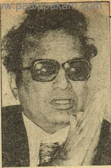
அரசு பயங்கரவாத 'இரும்பு மனிதர்' ஜக் மோகன்.

காஷ்மீர் மக்களின் போராட்டத்தை பாகிஸ்தான் ஆதரிப்பதோடு, பயங்கரவாதிகளுக்கு ஆயுத உதவியளிப்பதும் உண்மை தான். ஆனால் அண்டைநாட்டின் உள்விவகாரத்தில் தலையிட்டு சதி செய்வதாக பாகிஸ்தான் மீது குற்றம் சாட்டுவதற்கு இந்தியா அரசுக்கு எந்த அருகதையும் இல்லை. ஏனெனில் இந்திய ஆட்சியாளர்களே பாகிஸ்தானைத் துண்டாடி வங்கதேசத்தை உருவாக்கிய மாபெரும் சதிக் குற்றத்தைச் செய்துள்ளனர். பாகிஸ்தான் எதிர்ப்புப் பிரச்சாரம் தீவிரமாகியுள்ள இன்றைய நிலையில், வங்கதேசப் பிரச்சினையையும் காஷ்மீர் பிரச்சினையையும் ஒப்பிட்டுப் பார்ப்பது