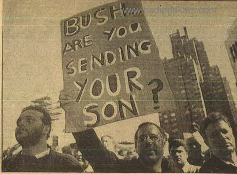
“புஷ் மாவாவே உன் மகனை வளைகுடா போருக்கு அனுப்பத் தயாரா?” அமெரிக்காவின் போர்வெறியை எதிர்த்து அமெரிக்க மக்களின் ஆர்ப்பாட்டம்.