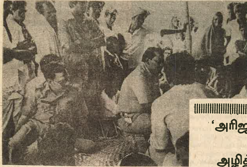
நிவாரண முகாமுக்கு வந்து ஆணைவார்த்தை கூறியும் பிரிட்டிய வழுக்குகளை வலக்கித் தகாளும்படி போலும் போலித்.

1969ல் தஞ்சை கீழ்வெண்மணி கிராமத்தில் அரைப்படி நெல் அதிகமாக கூலிகேட்டுப் போராடிய விவசாயத் தொழிலாளர்கள் 43 பேரை ஒரே குடிசையில் போட்டு பூட்டி உயிருடன் கொளுத்தினார்கள் பண்ணை பிரபுக்கள். ஆனால் கொலைகாரர்கள் யாரும் தண்டிக்கப்படவில்லை. இப்படு