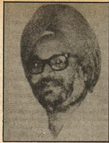
இந்திரா கொலையையும் சதீஷும் காரணமானவர்கள் என்கு இரண்டு சாட்டப்பட்ட பல்பீர் சிங், கேஹார் சிங் - ரூபாய்யான இரண்டு சாட்டப்பட்டவர்கள் என்கு பல்பீர் சிங் விடுவிக்கப்பட்டார், உச்ச நீதிமன்றத்தில் ஆதாரம்என்ற சூத்திரம் பட்டார் கேஹார் சிங்!

தியா, பாகிஸ்தான் ஆகிய இருநாடுகளுமே தமது உள்நாட்டு நெருக்கடிகளைத் திசைதிருப்பி விடுவதற்கான உத்திதான்! அதிலே ஒரு அங்கம்தான் அண்டை - அந்நியநாடுகளின் சதி என்ற கூச்சலும்!