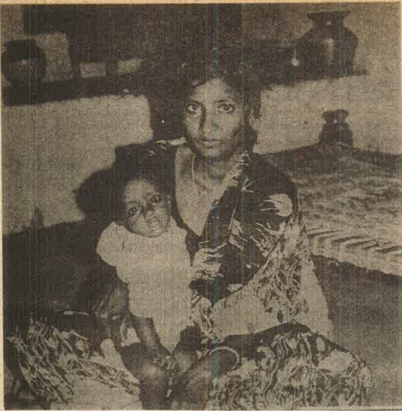
மேலீசாதிக்குளத்திலு் அந்தியப் பாயன் குடிநீர் படுத்தநாந கலீமாநாயுடு அனைஆனை செய்ந தகராஸ்தாதி நிரகீஉசெடு படுகாக்கை தியுத்தம்

செஞ்சுராமையாவை முதல் குற்றவாளியாக வழக்கில் குற்றஞ்சாட்டியிருந்தனர்.