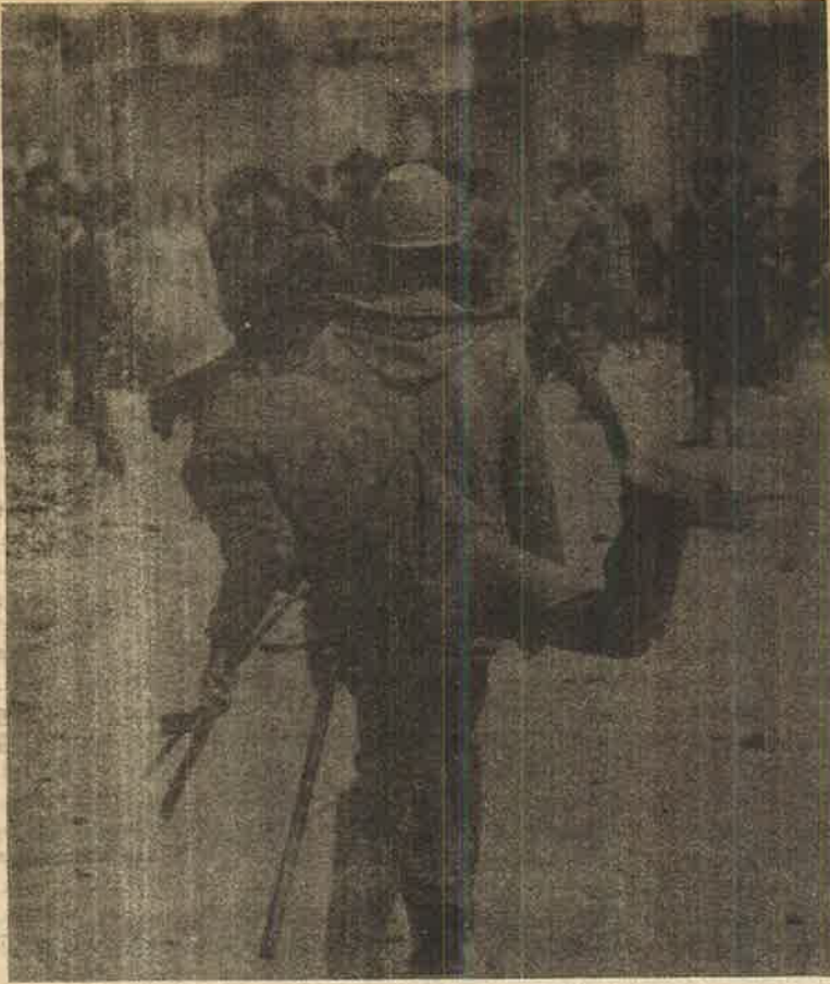
புரீநகர் வீதிகளில் ஆர்ப்பாட்டம் செய்யும் இளைஞர்கள் மீது கல்லெறிந்து தாக்கும் போலீசு ரௌடிகள்.