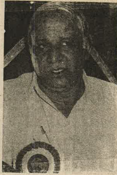
அம்பேத்காரின் 'வாரிக்' (?) கன்ஷிராமும்

'முற்பட்ட அல்லது பிற்பட்ட சாதிகளை பொருளாதார அடிப்படையில் தீர்மானிக்கக்கூடாது; சமூக மற்றும் கல்வி நிலைமைகள் அடிப்படையில் தீர்மானிக்க வேண்டும்' - இதுதான் ஏற்கனவே மேல்சாதியினர் ஆதிக்கம் - ஆட்சி வகிக்கும் அரசாங்கம் முடிவு செய்து அமுல்படுத்தும் காரணிகள், மண்டல் கமிஷனும் இதையே சிபாரிசு செய்துள்ளது. இது குறிப்பான வழிகாட்டும் வரையறுப்பு அல்ல. எனவேதான் அவ்வப்போது ஆட்சிக்கு வருபவர்கள், பல சாதியினரும் எழுப்பும் கோரிக்கை, ஒட்டுப்பொறுக்கும் அவசியத்துக்கேற்ப இடஒதுக்கீடு பட்டியலை மாற்றிக் கொள்கிறார்கள். ஒருகாலத்தில் முற்பட்ட சாதியாகக் கருதப்பட்ட வெள்ளாளக் கவுண்டர்கள் போன்ற சாதிகளை பிற்பட்டோர் பட்டியலில் சேர்த்துக் கொண்டே போகிறார்கள். மிகவும் பிற்படுத்தப்பட்டோர், பிற்படுத்தப்பட்டோர் என்று பிரிக்கிறார்கள். பிறகு சேர்க்கிறார்கள். தாழ்த்தப்பட்டோர் - பழங்குடியினர் பிரிவில் கூட புதுப்