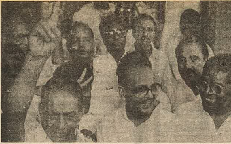
சி.ஏ.ஜி. அறிக்கை வெளியானதையடுத்து ஓட்டுமொத்த ராஜினாமா, பதவியைத் துறந்த எதிர்க்கட்சி எம்.பி.க்கள்

சொல்லி வழியனுப்பி வைத்தார்கள், கமிட்டி உறுப்பினர்கள்.