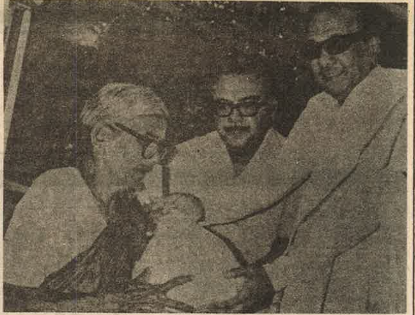
'கருணை' வள்ளலாக கருணாநிதி - எஞ்சியதை உருவும் வஞ்சகத்தனம்!

சார்பு செயலாளர்கள், துணைச் செயலாளர்கள், இணை இயக்குநர்கள், இணைச் செயலாளர்கள், துறைத் தலைவர்கள் ஆகிய, சிலில் நிர்வாகம், "நீதி" த்துறை, பொதுத்துறை, தலைமை மட்ட அதிகாரிகளுக்கான வாரிசு கொடுக்கப்பட்டது.