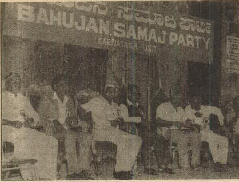
பெங்களூரில் பருஜன் சமாஜ் கட்சியின் தொட்டகவிழாக் கூட்டம் - சாதிய அரசியலுக்கு கால்கோள் விழா.

இந்திய மண்ணின் தனித்தன்மை பற்றி முடிவற்ற ஆராய்ச்சியில் ஈடுபட்டுள்ள மாஜிப் புரட்சியாளர்களும், இனவாதிகளும் கூட இனமற்றும் சாதிப்பாடுகளுக்கான அடிப்படையையும், பிரிவினையையும் முன்வைப்பதே இல்லை. எந்த அடிப்படையும் இன்றி தான்தோன்றித் தனமாக சில சாதிகள் புரட்சிகரமானவை, வேறு சில சாதிகள் எதிரிகள் என்று ஆணைமுத்து குழு பாடுபடுத்தியது. கேலிக்குரிய முறையில் முடிந்தது. ஏனெனில் புரட்சிகர சாதிகள் என்று ஆணைமுத்து குழு வரையறுத்த சாதிகள்தாம் பீகாரில் தாழ்த்தப்பட்ட மக்களை உயிரோடு கொளுத்தும் எதிர்ப்புரட்சி அணிகளுக்குத் தலைமையெடுக்கின்றன.