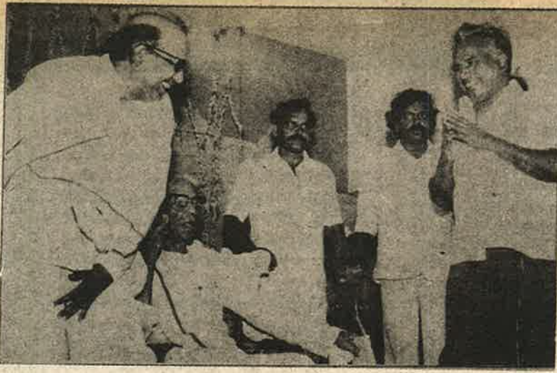
ஆதிபராசக்தியும் ஆன்மீகத் திராவிடமும்

ஏதோ ஓட்டுப் பொறுக்கிக் கட்சிகளிடையே நடக்கும் வழக்கமான அவதூறு அல்ல. நிதர்சனமான உண்மை!