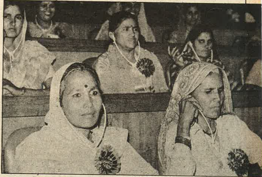
பஞ்சாயத்து மாநாட்டில் மகளிர் பிரதிநிதிகள் - ஒட்டுப் பொறுக்குவதற்கான உத்தி

★ ‘ஐந்தாண்டுகளுக்கு ஒரு முறை தேர்தல் கமிசன் மூலமாக தேர்தல்கள் நடத்துவது, பஞ்சாயத்துக்களைக் கலைத்தால் சட்டமன்ற அங்கீகாரம்; ஆறு மாதங்களுக்குள் மீண்டும் தேர்தல் நடத்த வேண்டும்.