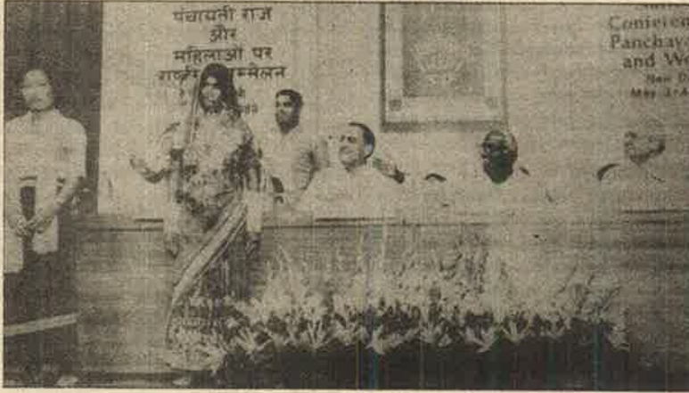
மகளிர் பஞ்சாயத்து மாநாடு: பாசிச கும்பலின் நாடக மேடை

★ பஞ்சாயத்துக்களுக்குள்ள குறைவான நிதியும் கூட வஞ்ச ஊழலுக்கும், நிர்வாகக் கேடுகளுக்கும் விரையமாகின்றது. அதிகார முறை கேடுகளுக்கும் நடக்கின்றன. —மேற்கண்ட குறைபாடுகள் 1969 ஆம் ஆண்டிலேயே ஆட்சியாளர்களுக்கு எடுத்துரைக்கப்பட்டன. அதிகாரவர்க்க பாணியிலேயே அவற்றுக்குத் தீர்வுகளைச் சொன்னார்கள். குறிப்பாக நக்சல் பாரிப் புரட்சி இயக்கம் வேகமாகப் பரவிக் கொண்டிருந்த சமயம்;