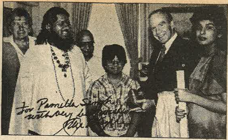
கஷோகி - சந்திராசாமி - பாலியலுடன் அமெரிக்க சென்ட் சுவநாயகர் ஜிம்கர்ட்

பர் புஷின் மகன், மனைவியோடு இந்துஜாக் களின் விருந்தில் கலந்து கொண்டார்.