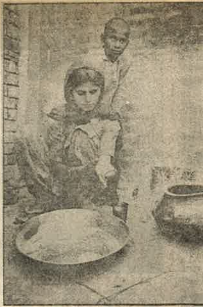
அறவை எந்திரத்தில் ஏற்பட்ட விபத்தினால் கை ஊனமான நிலையில் சப்பாத்தி தயாரிக்கும் விவசாயப் பெண்மணி.

மேலும், குறைந்த நேரத்தில் அதிக உழைப்பைச் சுண்டும் பொருட்டு கைகளால் இயக்குவதற்காக வடிவமைக்கப்பட்ட இவ்வியந்திரங்களை டிராக்டர் இன்ஜின்களுடனும், நீர் இறைக்கும் டீசல் இன்ஜின்களுடனும் பொருத்தி அசுர வேகத்தில் இயக்குகின்றனர். நடைபாதைகளில் இருக்கும் கரும்புச்சாறு பிழியும் இயந்திரங்கள் போன்ற வடிவமைப்புடன் இருக்கும் இவ்வியந்திரங்கள், நவீன 'கெல்வட்டிள்' களாக மாறி, கண்ணிமைக்கும் நேரத்தில் முழங்கையை உள்ளி முத்து மென்று, சிறுசிறு துண்டுகளாக, துப்பு