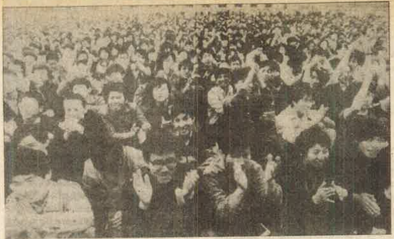
கூடுதல் 'ஜனநாயகம்' கோரி சீன மாணவர்கள் நடத்தும் போராட்டம்

ரஷியா, சீனாவைப் போலவே கிழக்கு ஐரோப்பிய போலிக் கம்யூனிச நாடுகளும் வியட்நாமும் தங்கள் பங்குக்கு 'கிளாஸ்நாஸ்ட்' கொள்கையை அறிவித்து, தனியார் முதலாளித்துவத்தை வெளிப்படையாகவே அங்கீகரித்து ஆதரிக்கத் தொடங்கிவிட்டன. ரஷிய சமூக ஏகாதிபத்தியத்தின் தொங்கு சதை நாடான போலந்தில் சிவப்புச்சாயம் பூசிய ராணுவ சர்வாதிகாரி ஜாருஜெல்ஸ்கியின் கொடிய ஆட்சியையும், தீராத உணவுப் பஞ்சத்தையும் எதிர்த்து 70களின் இறுதியில் சுயேட்சையான 'சாலிடாரிடி' தொழிற்சங்கத் தலைவர் வாலேசா 'ஜனநாயக'த்துக்குக் குரல் கொடுத்தார். எல்லா ஏகாதிபத்திய நாடுகளும் கிறிஸ்துவ மத நிறுவனங்களும் அவரது போராட்டத்துக்குப் பக்கபலமாக நின்றன. பீதியடைந்த போலந்தின் ராணுவ சர்வாதிகாரிகள் ராணுவத்தை ஏவி போராட்டத்தை அடக்கினர். உலகின் தலைசிறந்த மனிதர் என்று 'டைய' பத்திரிகை வாலேசாவைப் பாராட்டியது; அவருக்கு நோபல் பரிசு கூட வழங்கப்பட்டது.