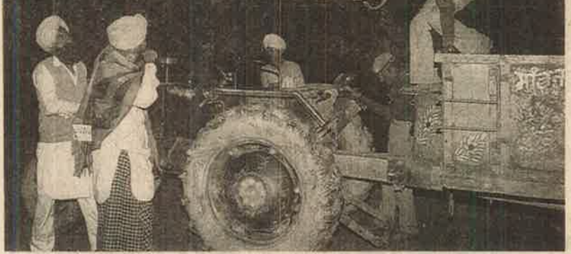
உழவு முடிந்து விட்டு வீடு திரும்பும் விவசாயிகளை பீதிகுள்ளாக்கும் இராணுவம்; சுற்றி வளைத்துச் சோதனையிடுகிறது.

களுக்கு தேவையான இடங்களுக்கு கூட சல்லிக்காக செலவு செய்வது இல்லை. கிராம பஞ்சாயத்து அலுவலகங்களிலும் பள்ளிக் கூடங்களிலும் நுழைந்து ஆக்கிரமித்துக்கொள்கிறது. அவ்விடங்களில் வசதிகள் குறைவாக இருந்தால் அக்கிராம பஞ்சாயத்துக்காரர்களை அழைத்து புதிய குடியிருப்புகளை இலவசமாக அமைத்துத் தரும்படி நிர்ப்பந்திக்கிறது. அதிகாரிகளுக்கு அதே போல், ஊரில் இருக்கும் வசதியான வீடுகளை இலவசமாக ஒதுக்கித் தருமாறு மிரட்டிச் சாதிக்கிறது. அதிரடி நடவடிக்கைகளுக்காக வந்திறங்கும் படைகளுக்குத் தேவையான உணவு கூட கிராம மக்கள்தான் வழங்க வேண்டும் என்று துப்பாக்கி முனையில் மிரட்டுகிறது.