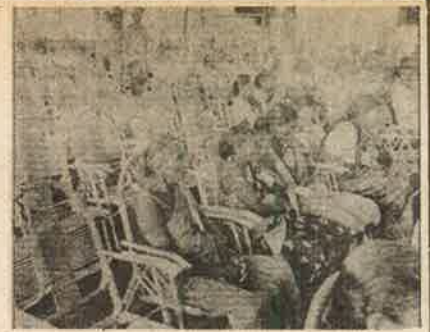
பெங்களூரில் பஞ்சாயத்து மாநாடு: எதிர்க்கட்சிகள் புறக்கணிப்பு! காலியான நாகாலிகள்; துப்புரவுப் பணியாளர் பங்கேற்பு.

நிலம் உட்பட நிலப்பிரபுக்கள், கோயில் - மடங்கள், பன்னாட்டு நடுவர்களின் அனைத்துச் சொத்துக்களையும் பறிமுதல் செய்து கூலி ஏழை விவசாயிகளிடம் பகிர்ந்தளிப்பது; பரந்து பட்ட மக்களின் கிராமப் புரட்சிக் கமிட்டிகளே அனைத்து நிர்வாக அதிகார உரிமைகளையும் பெறுவது என்கிற புரட்சிகர மாற்றம்தான் மக்களிடம் அதிகாரம் வருவதைக் குறிக்கும். மற்ற படி ஆளும் வர்க்கங்கள் கொண்டுவரும் சீர்திருத்தங்கள் மக்கள் அதிகாரத்தைக் கைப்பற்றுவதைத் தடுப்பதற்கான முயற்சிகள் தாம்!