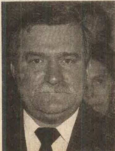
போலந்தின் 'சாலிடாரிடி' சங்கத் தலைவர். லேக்வாலேசா

பல கட்சி ஜனநாயகத் தேர்தல் வைத்தால் இந்நாடுகளில் சர்வாதாரணமாக முதலாளித்துவ கட்சிகள் வெற்றிபெற்று அதிகாரத்தையே கைப்பற்றிவிடக் கூடிய அளவுக்கு நிலைமை முன்னேறிவிட்டது. இந்திய போலிக் கம்யூனிஸ்டுகள் கூட இந்நாடுகளை 'சோசலிச' நாடுகளாக ஏற்றுக் கொள்ள முடியாத அளவுக்கு சிவப்புச்சாயம் வெளுத்து முற்றாக அம்பலப்பட்டுப் போயுள்ளன. அதேசமயம் போலி சோசலிசமும் போலி கம்யூனிசமும் எந்த அளவுக்கு தீங்கானது, நாட்டுக்கும் மக்களுக்கும் எதிரானது என்பதை எதிர்மறை அனுபவங்களாக உலகப் பாட்டாளிவர்க்கத்துக்கு இந்நாடுகள் போதிக்கின்றன.