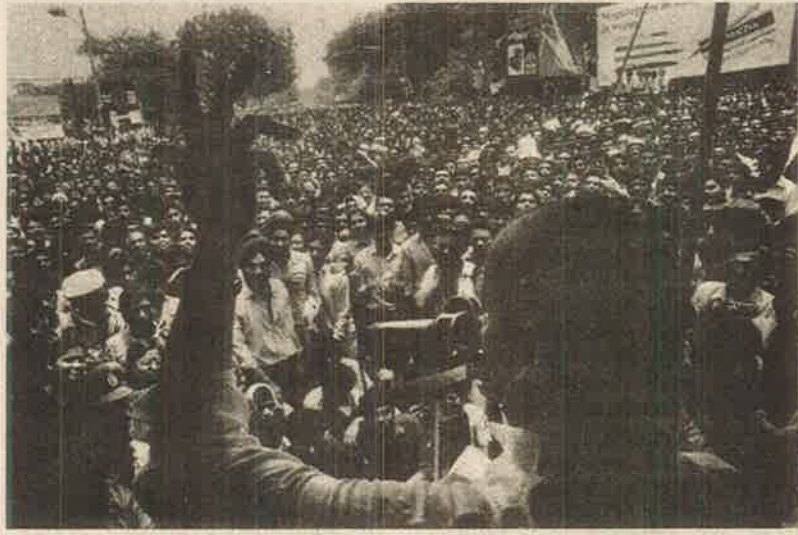
டெல்லி பல்கலைக்கழக மாணவர்களிடையே பேசுகிறார் வி.பி.சிங். "நீங்கள் அரிசி கொண்டு வாருங்கள்; நான் உமி கொண்டு வருகிறேன்; கலந்து ஊதித் தின்போம்!" என்கிறாரோ?

இதற்கிடையே, வாக்களிக்கும் வயது வரம்பை குறைந்த பெருமைக்காக ஓட்டுக் கட்சிகள் அடித்துக் கொள்கின்றன.