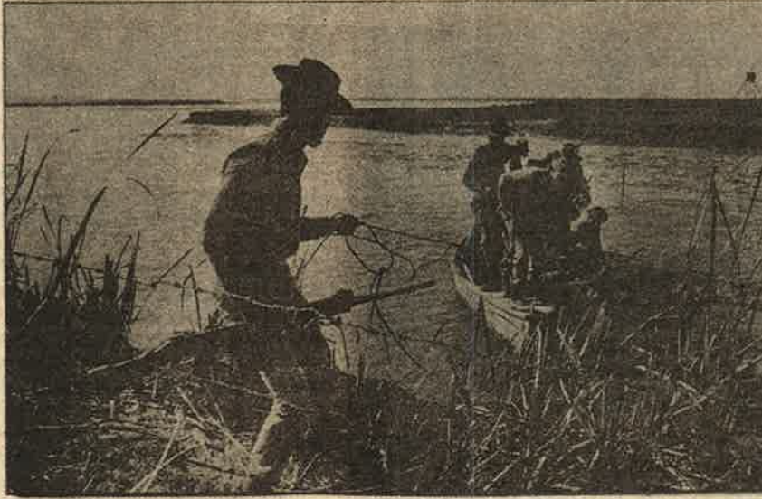
எதையும் விட்டு வைப்பதில்லை இந்திய ராணுவம்; விவசாயிகளின் படகுகளையே தேடுதல் வேட்டைக்குப் பயன்படுத்திக் கொள்கிறது.

மறுபுறம், பாசிச ராஜீவ் கும்பலின் மக்கள் விரோத, தேசவிரோத நடவடிக்கைகளுக்கு எதிராக சீக்கிய மக்களின் உரிமைகளுக்காகப் போராடும் உண்மையான தொண்டர்களாக வெளிக் கிளம்பியுள்ள சீக்கிய மதவெறி அமைப்புகள் எந்த விதத்திலும் பாசிச ராஜீவ் கும்பலின் அரசு பயங்கரவாதத்துக்குத் தீர்வாகாது. இம் மதவெறி அமைப்புகளின் அடிப்படை நோக்கம், பஞ்சாப் மக்களுக்கு ஜனநாயக உரிமைகளை மீட்டு தருவதோ, அம் மாநிலத்தின் நியாயமான உரிமைகளை பாசிசக் கும்பலிடம் இருந்து போராடிப் பெறுவதோ அல்ல. மாறாக, பஞ்சாப் மாநிலத்தில் நிலப்பிரபுத்துவ சீக்கிய மதவெறி ஆதிக்கத்தை நிலைநிறுத்துவதும், புதுவகைப் பணக்கார நிலப்பிரபுக்களுக்கு அதிகாரப் பங்கீட்டில், திட்ட ஒதுக்கீட்டில் உரிமைக்கோருவது, அதை அங்கீகரிக்க, பாசிச ராஜீவ் கும்பலை நிர்பந்திப்பது - இந்த இலட்சியங்களை அடைவதுதான் மதவெறி அமைப்புகளின் உண்மையான நோக்கம். அந்நோக்கங்களை அடைவதற்கு தம் பலத்தை பெருக்கிக் கொள்வதற்கு பரந்துப்பட்ட சீக்கிய மக்களை கவர்ந்திழுக்க இம் மக்களின் உரிமைகளையும் உள்ளடக்கிய கோரிக்கைகளை வைத்துப் மாத்து செய்கிறது, மதவெறி கும்பல்.