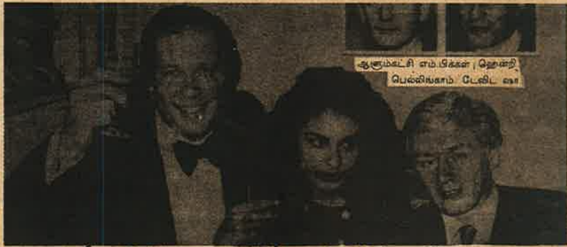
பரீலாவுடன் 'தி ஸ்பீலர்' மற்றும் 'ஹார்ல்டி' பத்திரிக்கைகளின் ஆசிரியர்கள்

பிரிட்டனின் நாவாந்தர பத்திரிக்கைகளும் அவற்றோடு போட்டி போட்டுக் கொண்டு இந்தியப் பத்திரிக்கைகளும் பரீலா விவகாரத்தைப் பற்றி தினமும் பரப