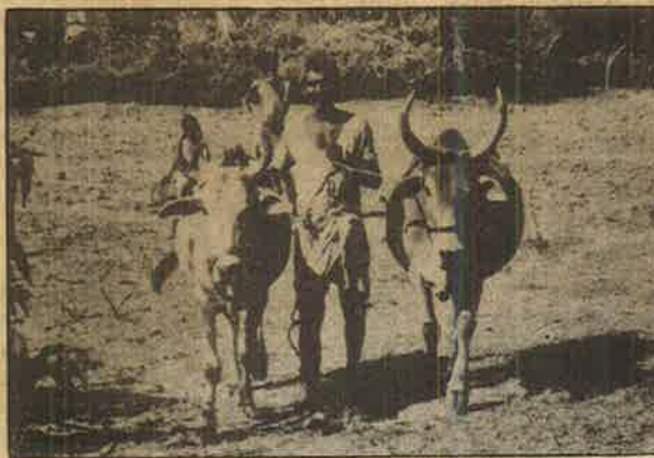
நன்ஹலுவால்; ஐ.ஆ.டி.பி. திட்டத்தின் கீழ் 5000 ரூபாய் கொடுக்கப் பட்டிருப்பதாக கணக்கெழுதி 3000 ரூபாய்தான் கொடுக்கப் பட்டிருக்கிறது. வண்டி இல்லாமல் வெறும் மாடுகளை வரங்கி வைத்திருக்கிறார்!

தணிக்கை செய்யப்பட்ட கணக்கின்படி கடந்த 8 ஆண்டுகளில் ஒதுக்கப்பட்ட பணத்தில் விநியோகிக்கப்படாமல் இருக்கும் பணத்தின் மதிப்பு ரூ. 77.29 கோடி. ஆனால் மாநில அரசு கையிருப்பு காட்டும் கணக்கோ வெறும் 14.53 கோடி!