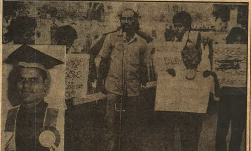
காண்டிராக்டருக்கு பட்டமளிக்கப்படுவதை எதிர்த்து பல்கலைக்கழக மாணவர்கள் நடத்தும் கழுதைக்கு பட்டமளிக்கும் விழா.