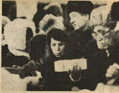
ரேஷனுக்கு முண்டியடிக்கும் ரஷிய மக்கள்.

சாதாரண ரசிய குடிமகன் உணவு பஞ்சத்தால் தெருவில் நாயாய் அலையும்போது ரசிய அதிகார வர்க்கத்தினரும், அரசியல் தலைவர்களும் குளியல் சோப்பு முதல் உடுத்தும் ஆடை வரை பன்மடங்கு விலை கொடுத்து நேர்த்தியான வெளிநாட்டுப் பொருட்களாக வாங்கி அனுப்பலிக்கின்றனர் இறக்குமதி செய்யப்பட்ட பதப்படுத்தப்